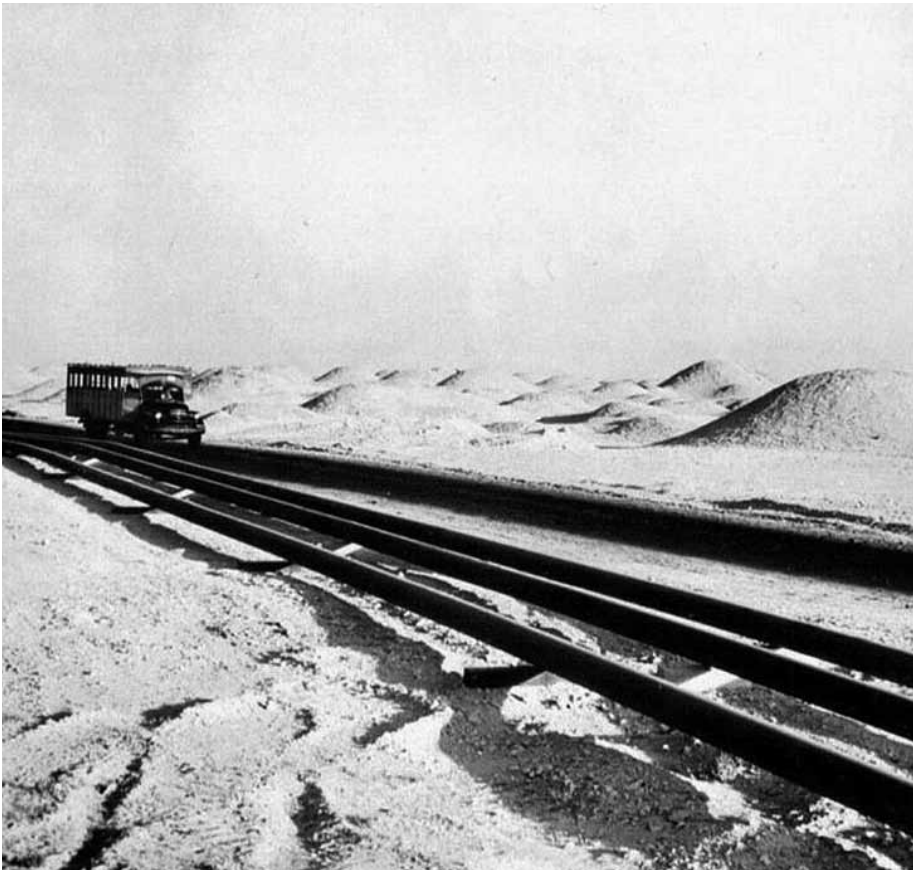
الشارع الصحراوي في المنطقة الجنوبية ويرى تلالك عالي في منتصف الأربعينيات