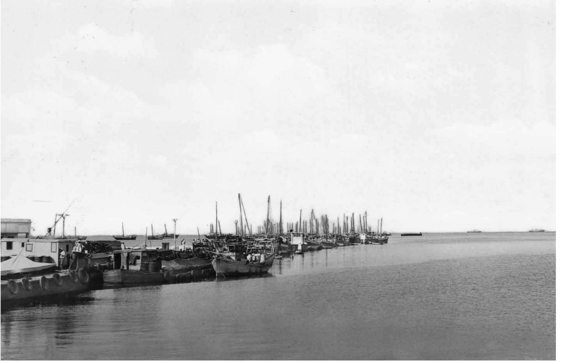
عدد من السفن الشراعية في فرضة النامة في الستينيات