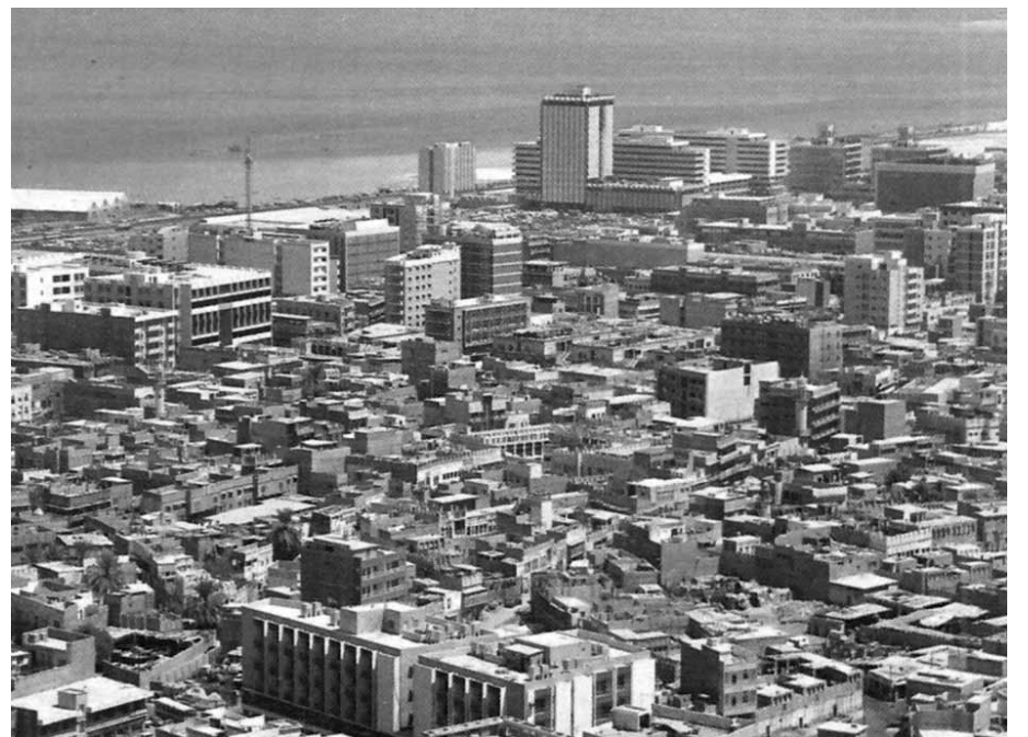
منظر جوي لمدينة النامة في السبعينيات