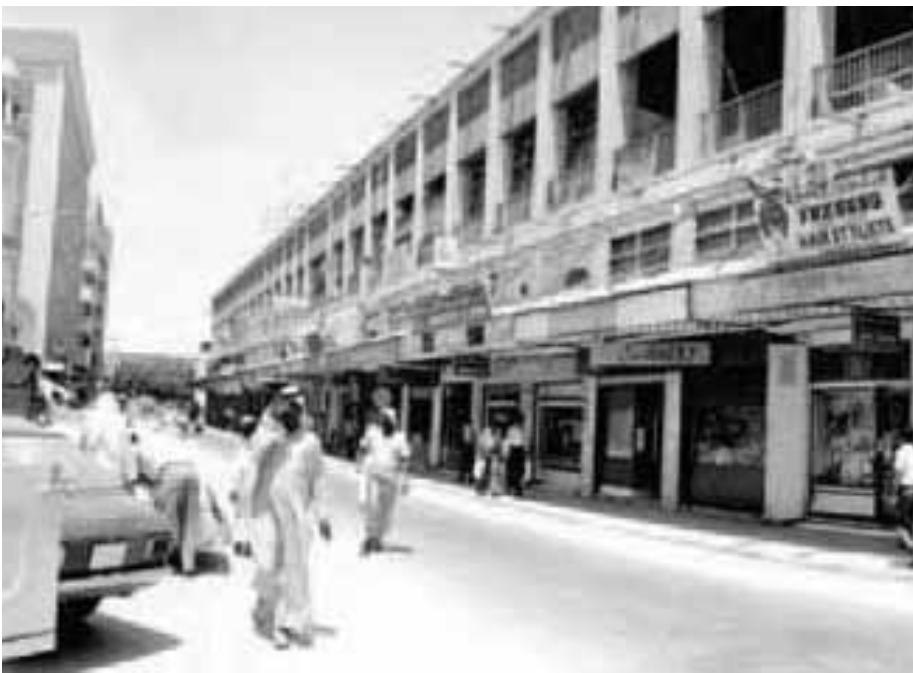
شارع الحكومة ويرى بناية هلاك المطيري في السبعينيات