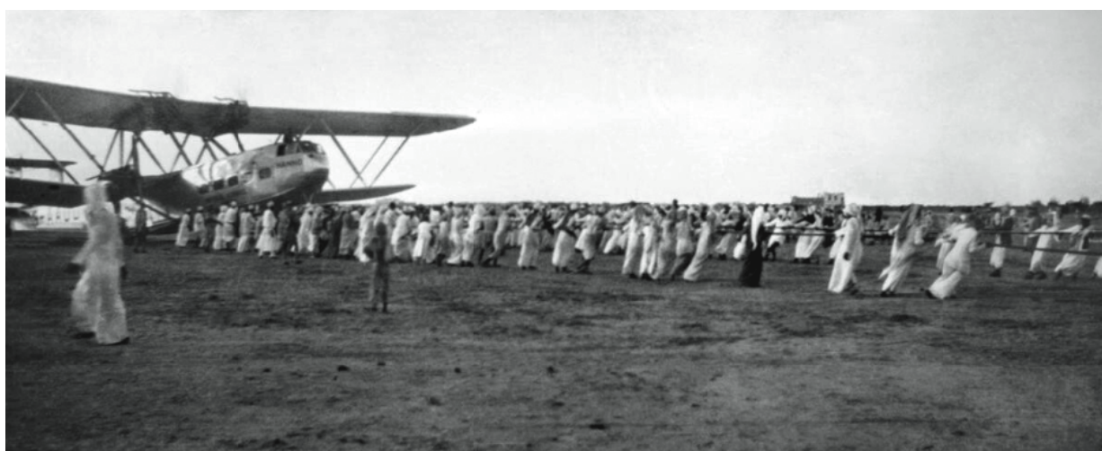
آثناء سحب الطائرة من الرمال

شركة طيران الشرق الأوسط وخطوط الطيران الهندية وطيران سيلان وخطوط إيران الجوية، وكانت أغلبها تشغل رحلاتها باستخدام طائرات "داكوتاس".