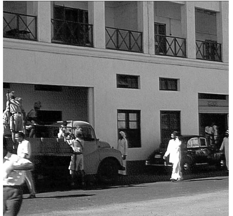
مركز شرطة النامة المتصل بمكتب بريد بالنامة في أواخر الخمسينيات