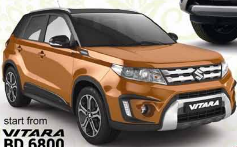
start from VITARA BD.6800