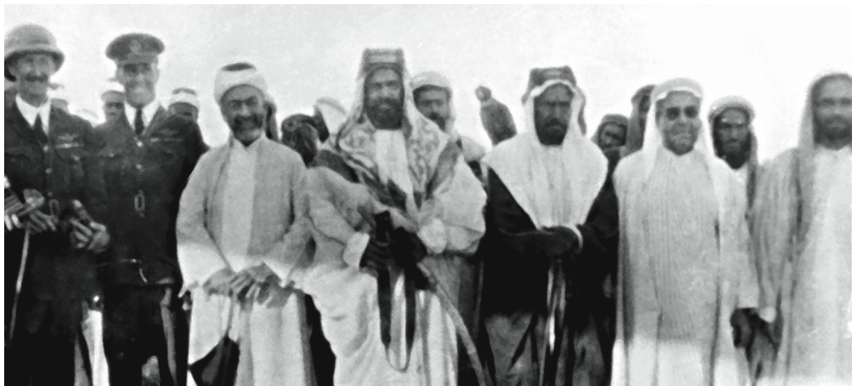
المغفور له صاحب العظمة الشيخ حمد بن عيسى آل خليفة لدى استقبالة أول طائرة في المطار البحري