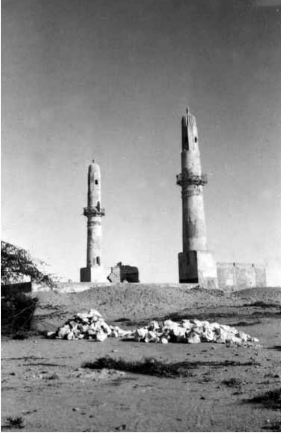
مسجد الخميس في الأربيعيات