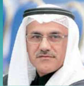
محافظ المحافظة الشمالية