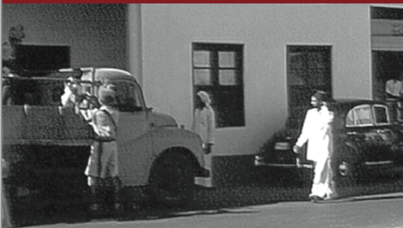
ذكريات من أيام زمان