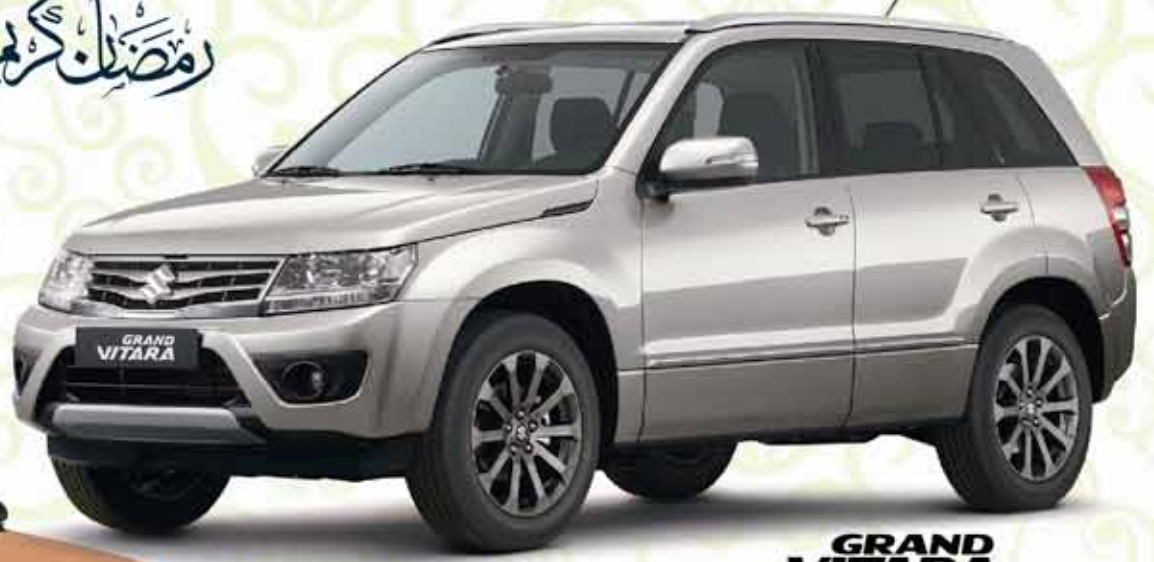
GRAND VITARA BD.8500