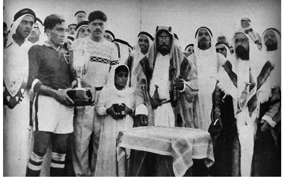
المغفور له صاحب العظمة الشيخ سلمان بن حمد آل خليفة برفقة المغفور له الشيخ محمد بن عيسى آل خليفة لدى تفضله بتوزيع الكؤوس على الفرق الفائزة ورئيس فريق المحرق الرياضي محمد جاسم الشيرازي في عام 1954م