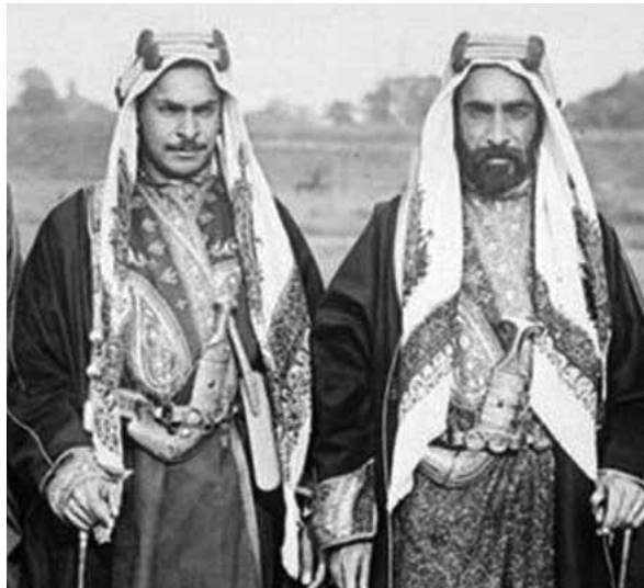
الشيخ عبدالله بن عيسى وابنة الشيخ محمد بن عبدالله بن عيسى آل خليفة عام ١٩١٩

وكان أول طيار في البحرين هو المغفور له الشيخ عبدالله بن عيسى بن علي آل خليفة نجل حاكم البحرين آنذاك طيب الله ثراه الشيخ عيسى بن علي آل خليفة، وكان الشيخ عبدالله بن عيسى قد غادر إلى بريطانيا هو وأبنة الشيخ محمد بن عبدالله في عام ١٩١٩م في سفينة نقلته إلى لندن عبر قناة السويس ثم إلى بريطانيا العظمى وفي مطار ميندون بالقرب من لندن ركب الطائرة وحلقا في الجو ليكونا أول شخصين في الجزيرة العربية يصعدان إلى الطائرة وباللباس العربي، وفي تلك السنوات الأولى قاد الشيخ عبدالله بن عيسى آل خليفة طائرة بدائية بعد تدريب قصير أثناء تواجده في لندن وفي مطلع القرن الـ ٢١ تم العثور على صورة لدى أحد هواة التصوير البريطانيين للشيخ عبدالله عندما كان في الطائرة باللباس العربي، ويعد الشيخ عبدالله بن عيسى آل خليفة أول بحريني يقود طائرة، وبعد سنة من هذه التجربة الوطنية من تلك الرحلة أي في عام ١٩٢٠م منح المغفور له الشيخ عيسى بن علي آل خليفة حاكم البحرين آنذاك الترخيص لبناء المطار وتم اختيار بقعة صحراوية خارج المنامة، وفي يوم الأحد الثامن من يونيو ١٩٢٤م انطلقت ثلاث قاذفات من سلاح الجو الملكي البريطاني من طراز de havilland dh9a من البصرة إلى البحرين، وبحسب قائد السرب ريتشارد بيك اقترنت الطائرات من المنامة في تشكيل جيد على إرتفاع ٥٠٠٠ قدم وهبطت بسلاسة، في الصباح