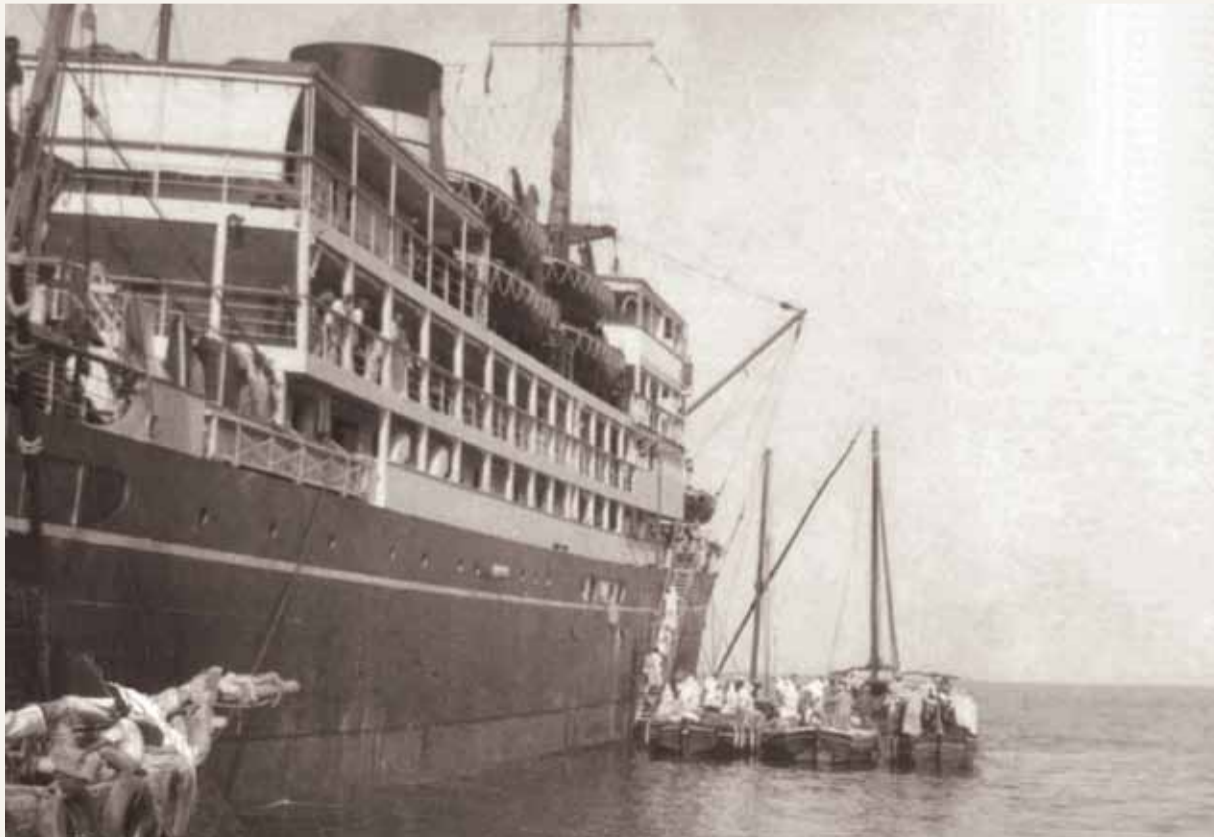
تفريغ السفن في مرسى في شمال المنامة