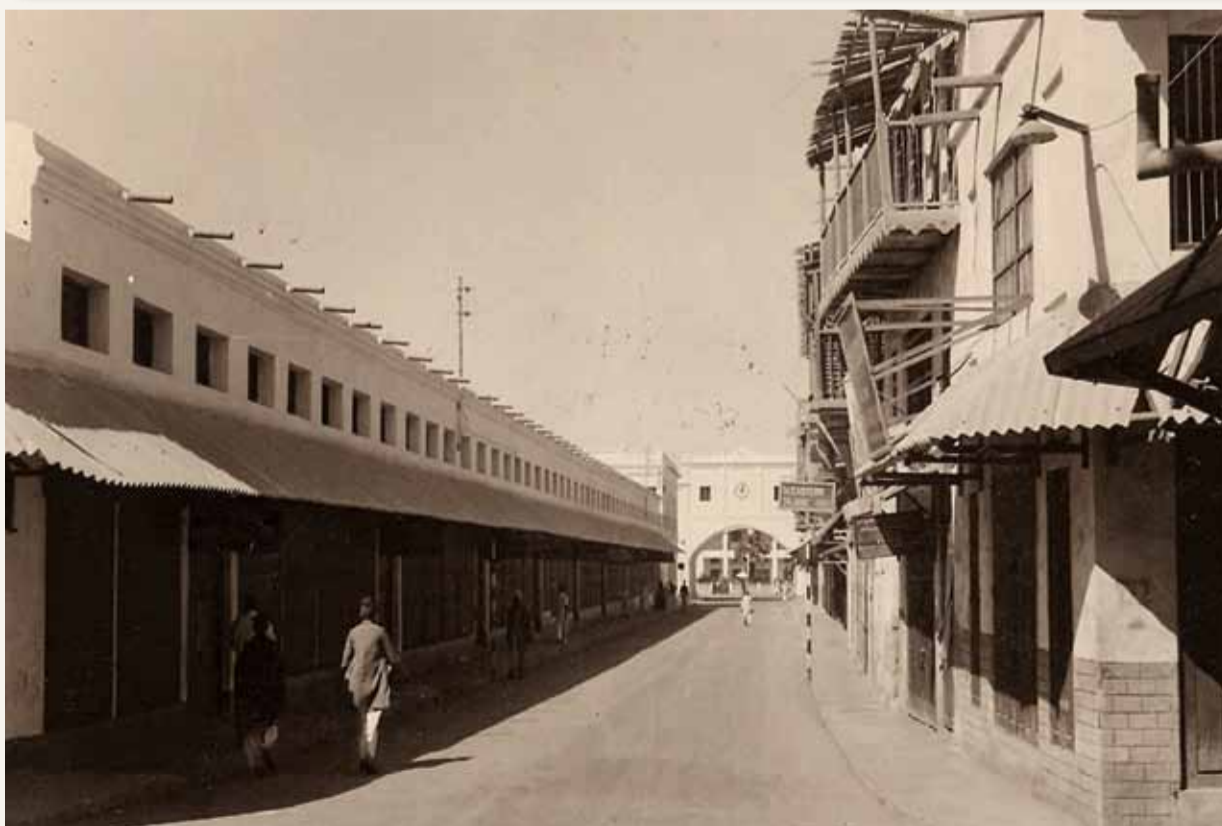
شارع باب البحرين