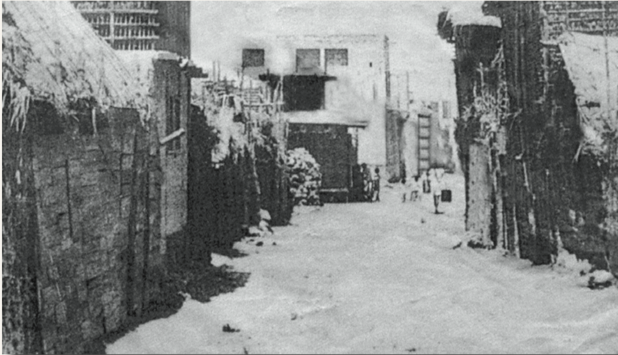
شارع المنامة في أواخر عام 1940، حيث كانت المنازل البحرينية مصنوعة من سعف النخيل