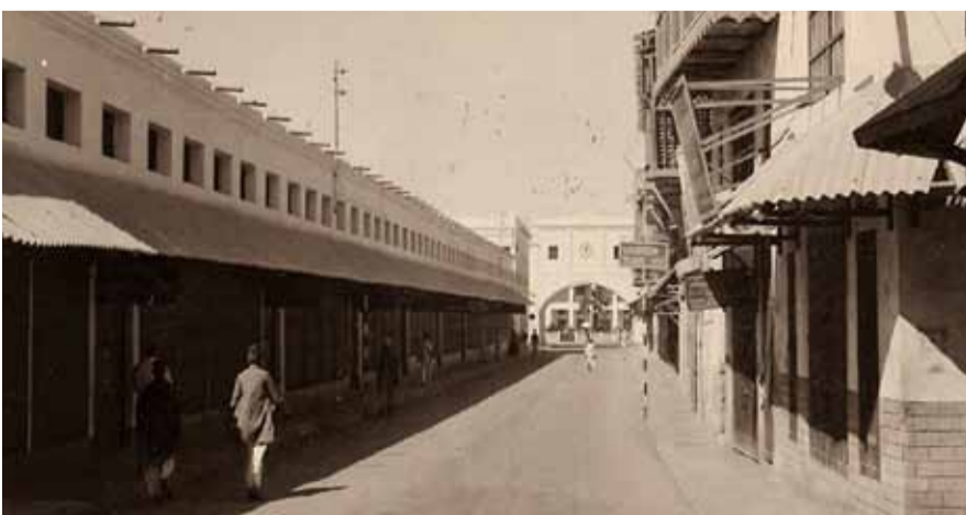
”رمضانيات“ تروي ذكريات من أيام زمان