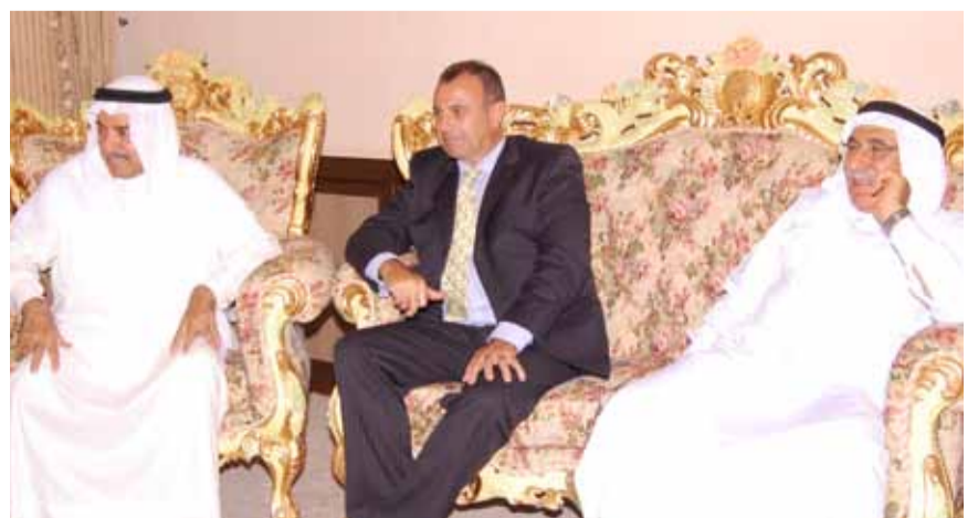
صور المجالس الرمضانية