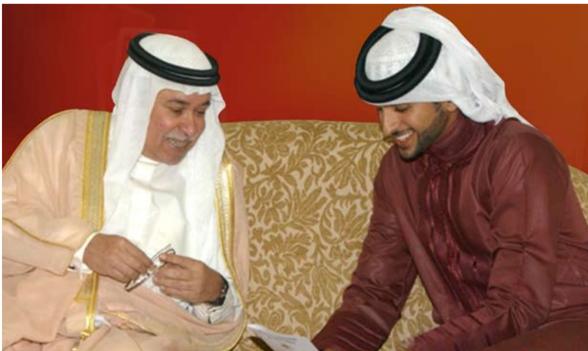
الشيخ عيسى بن راشد آل خليفة مع سموالشيخ ناصر بن حمد آل خليفة

تقلد مناصب قيادية عدة في البحرين بدءاً من رئاسته لنادي البحرين اعرق الأندية الوطنية والذي أصبح الشيخ عيسى بن راشد آل خليفة رئيساً فخرياً له كما تولى رئاسة الاتحاد البحريني لكرة القدم منذ العام ١٩٧٤ حتى ١٩٨٨ (وهي أطول فترة لرئيس يتولى فيها رئاسة اتحاد كرة القدم في البحرين).. عايش كل دورات كأس الخليج العربي لكرة القدم.. وترأس مجلس إدارة اللجنة الاولمبية البحرينية منذ تأسيسها في ١٩٧٩ وحتى كتابة هذه السطور.. كما عين رئيساً للمؤسسة العامة للشباب والرياضة بدرجة وزير وحالياً يشغل منصب