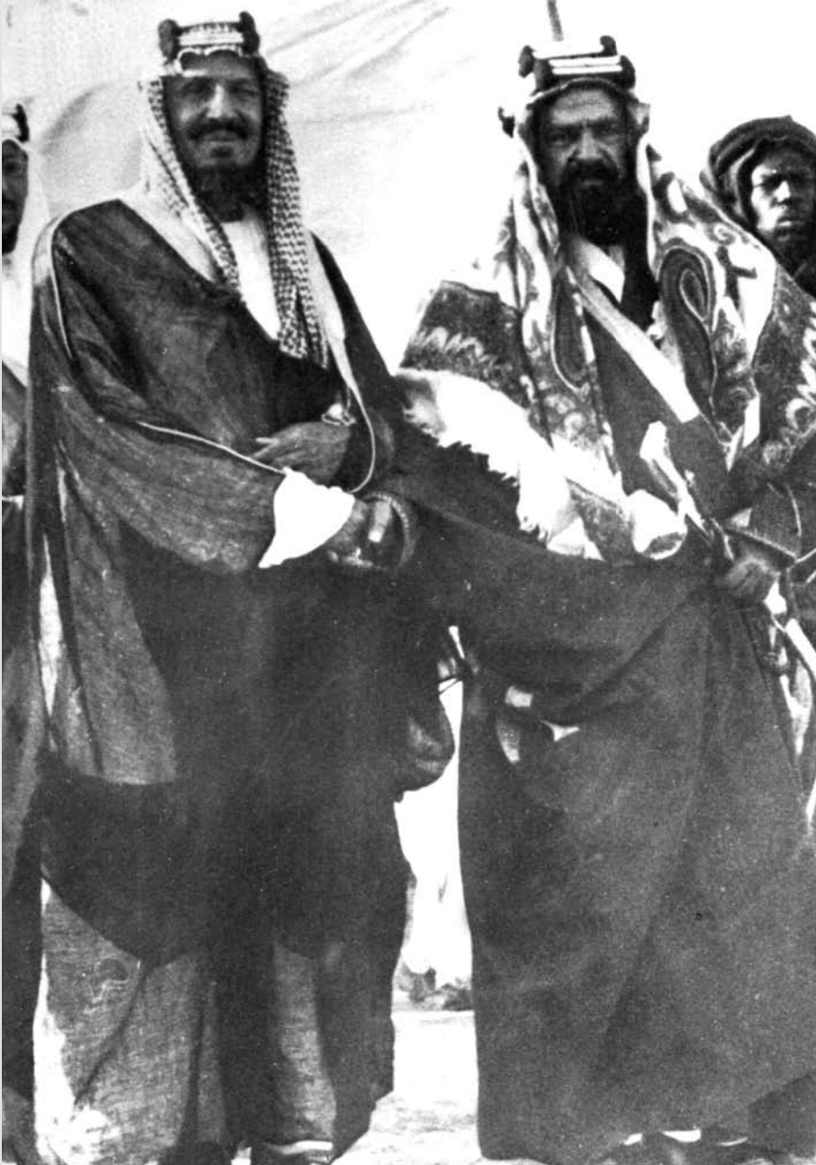
المغفور له صاحب العظمة الشيخ حمد بن عيسى آل خليفة، مع جلالة الملك عبد العزيز آل سعود لدى زيارته للبحرين في عام 1939م