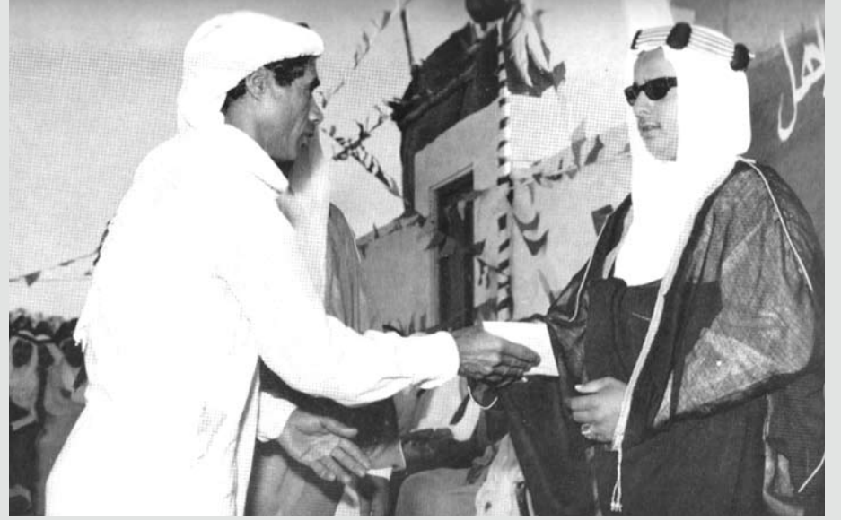
صاحب الجلالة الملك حمد بن عيسى آل خليفة، عندما كان ولياً للعهد، يسلم ملكية الأراضي لعدد من المواطنين