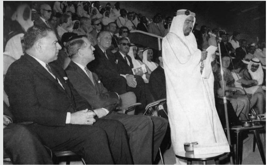
المغفور له صاحب السمو الشيخ عيسى بن سلمان آل خليفة، يلقي كلمة الافتتاح في حفل تدشين مدينة عيسى في عام 1968م