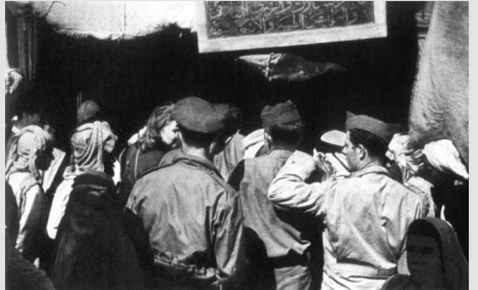
حشود من الناس يجتمعون ويستقبلون أفراد من سلاح البحرية الأمريكية خلال جولاتهم في الأسواق الشعبية وسط المنامة في عام 1947م