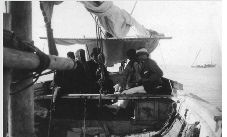
السيد كارتير على متن إحدى مراكب الغوص في عام 1911م