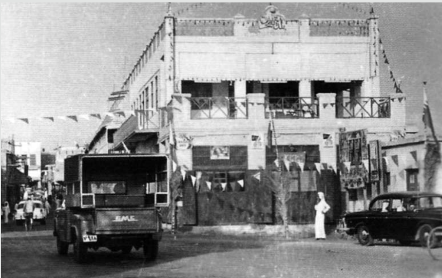
مدخل المحرق القديم