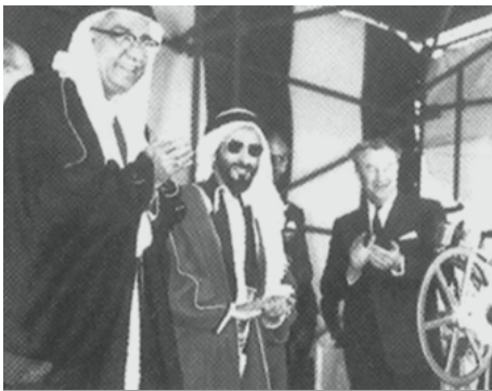
ذكريات من أيام زمان