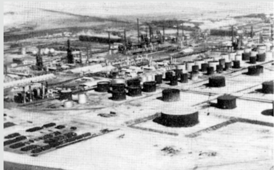
صورة جوية لخزانات النفط بستره إلتقطت من قبل طائرة خاصة لوحدة سينما رامنا للأفلام، لعمليات بابكو في عام 1955م