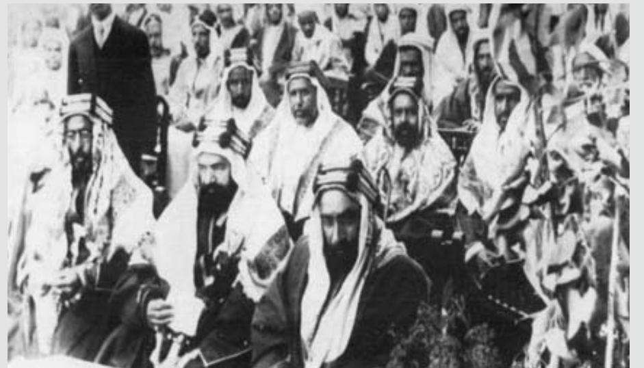
افتتاح المدرسة الغربية بالمنامة بحضور صاحب العظمة المغفور له الشيخ حمد بن عيسى آل خليفة حاكم البحرين، الشيخ محمد بن عيسى والشيخ عبد الله بن عيسى، والصف الثاني الشيخ سلمان بن حمد آل خليفة عام 1937م