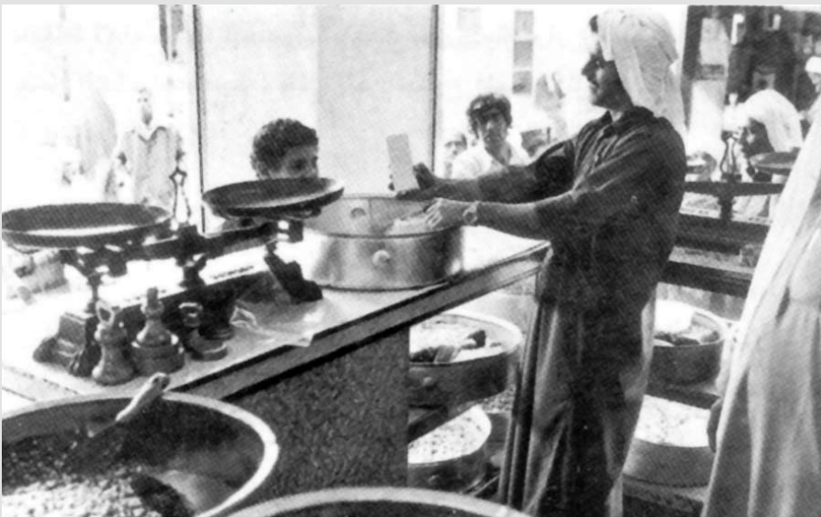
صناعة الحلوى - إحدى الصناعات الشعبية البحرينية التي شاعت في المجتمع البحريني واشتهرت به مدينتي المنامة والمحرق