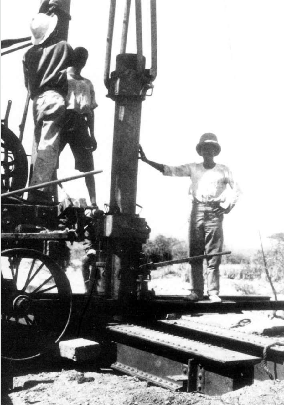
حفر آبار المياه في البحرين في عام 1925م