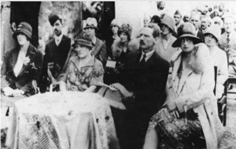
حفل افتتاح المدرسة الغربية، حيث خصص قسم خاص للنساء الأوروبيات عام 1937م