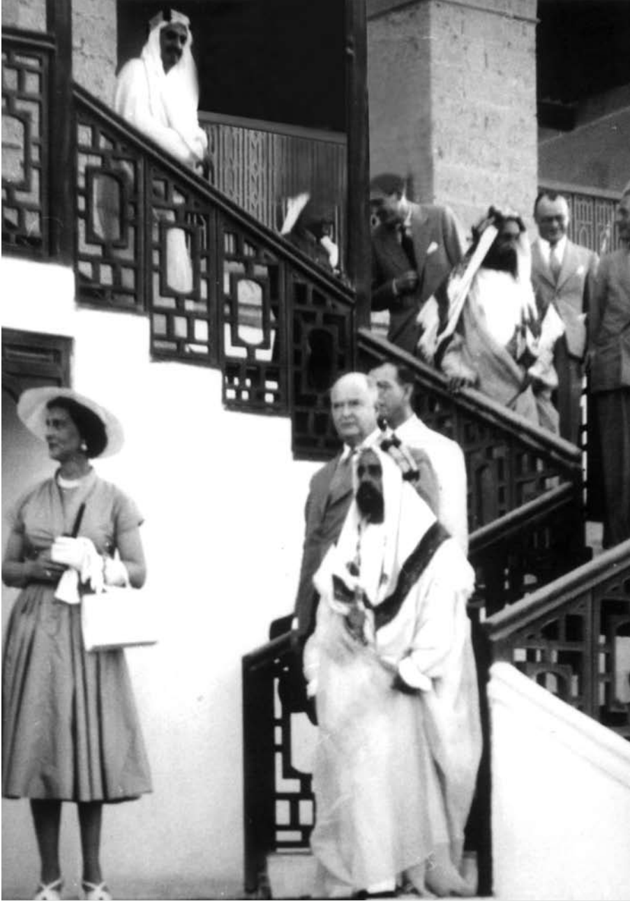
المغفور له صاحب العظمة الشيخ سلمان بن حمد آل خليفة يستقبل الأميرة الكسندريا إينة أمير مقاطعة (كنت)، لدى زيارتها للبحرين في قصر القضيبة