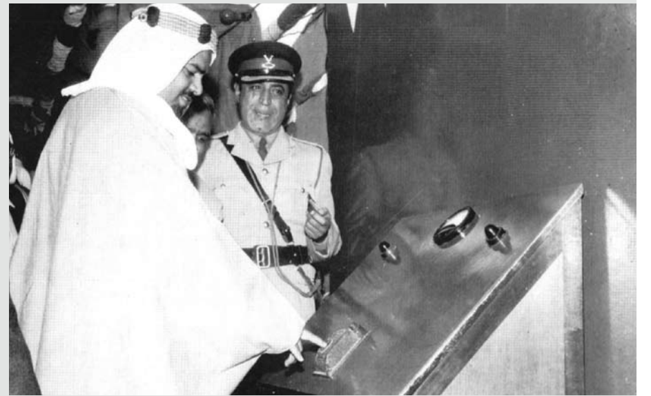
المغفور له صاحب السمو الملكي الأمير محمد بن سلمان آل خليفة خلال حفل بدأ تشغيل شبكة الكهرباء في البحرين