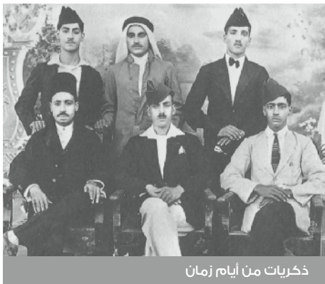
ذكريات من أيام زمان