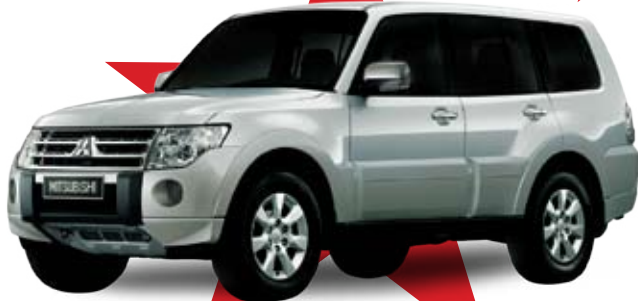
MITSUBISHI PAJERO 221 د.ب