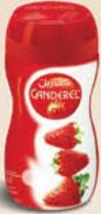
الحياة حلوة مع كاندريل