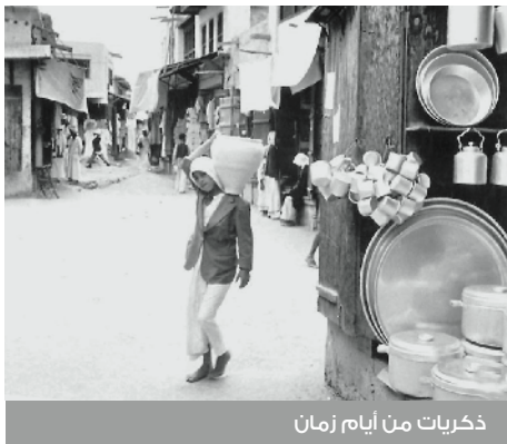
ذكريات من أيام زمان