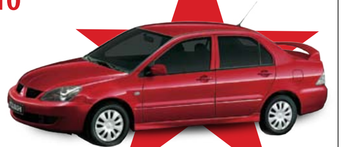
MITSUBISHI LANCER 77 د.ب