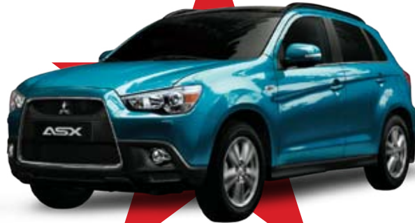
MITSUBISHI ASX 110 د.ب