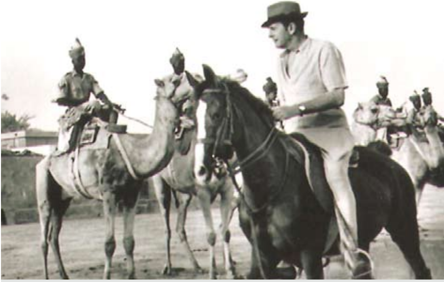
المستشار بلجريف يتفقد شرطة الهجن عام 1935 م