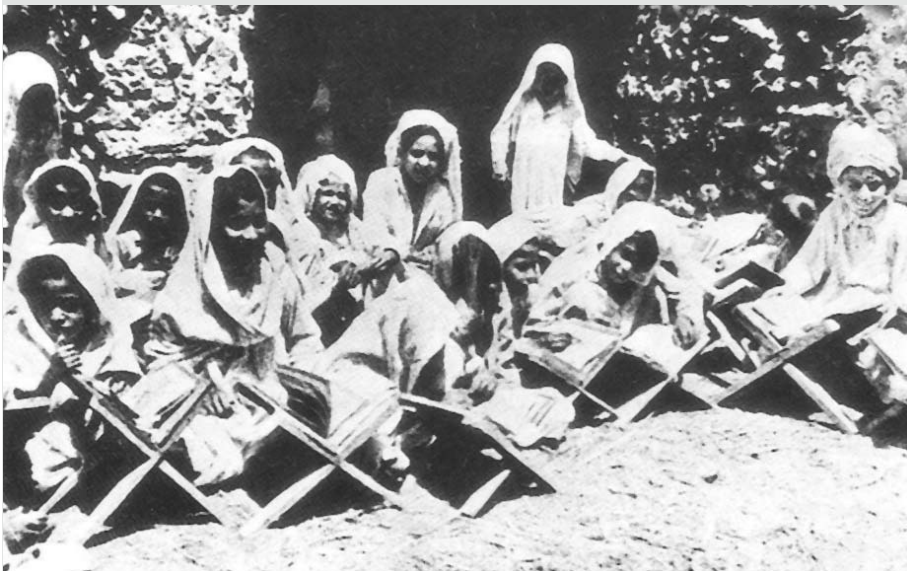
العديد من مدارس تحفيظ القرآن الكريم المنتشرة في المحرق والمنامة في الربع الأخير من عام 1955م