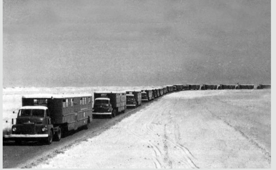
إسطول سيارات شركة نفط البحرين المحدودة سالم خطر لنقل موظفو وعمال الشركة