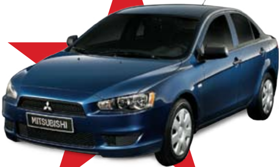
MITSUBISHI LANCER 86 د.ب