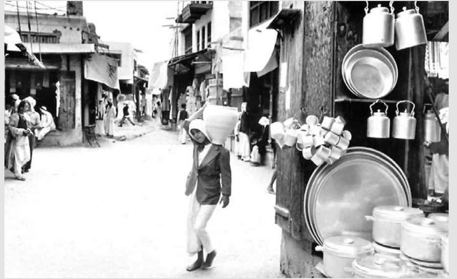
المحلات التي تباع الأواني المنزلية في وسط المنامة بالقرب من باب البحرين