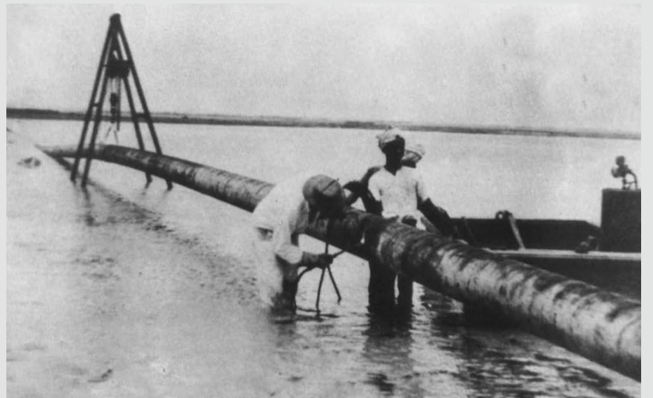
مد خط أنابيب نفط الخام بين السعودية والبحرين وكان يومها أطول خط من نوعه في العام 1945م