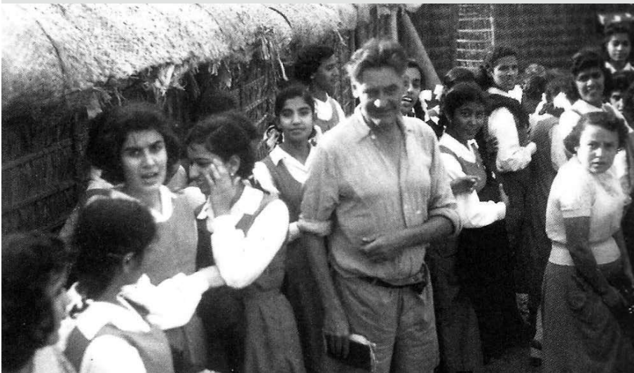
زيارة طلبة المدرسة الثانوية النموذجية للبنات لمواقع التنقيب الأثري في قلعة البحرين في عام 1953 م