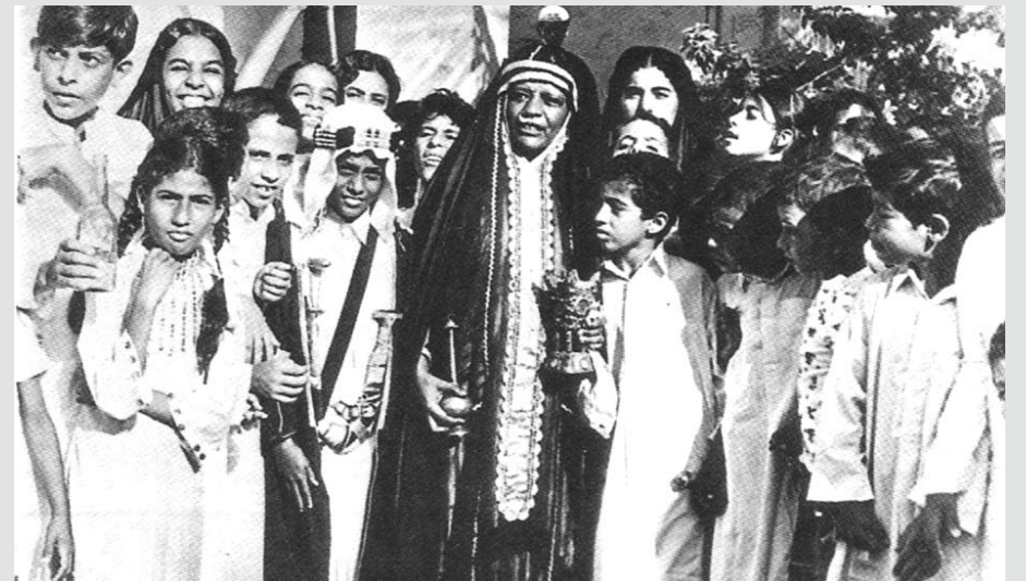
ختم القرآن - يقام احتفال بهيج بهذه المناسبة حيث يلبس خاتم القرآن ثياباً جديدة ويرتدي العباءة أو البشت ويحمل سيفاً في يده ويطوف على بيوت الغريخ ويعطيه أهل البيوت ما تجود به أنفسهم