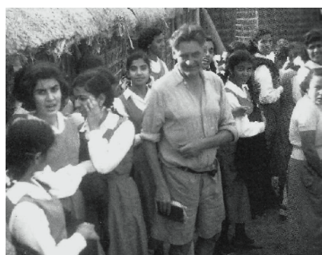
ذكريات من ايام زمان