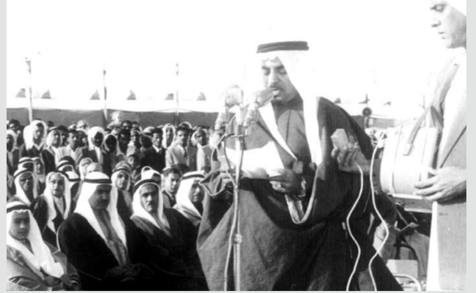
صاحب السمو الملكي الأمير خليفة بن سلمان آل خليفة رئيس الوزراء الموقر يلقي كلمة في حفل بمناسبة تزويد الكهرباء لاحدى قرى البحرين ويرى بجانبه المرحوم السيد ابراهيم كانو مدير الاذاعة يسجل كلمة سموه