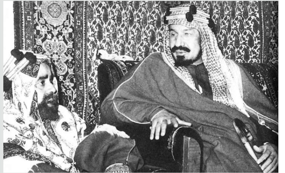
المغفور له صاحب العظمة الشيخ سلمان بن حمد آل خليفة مع ضيفه المغفور له جلالة الملك عبد العزيز آل سعود في إحدى زيارته إلى البحرين في عام 1940م