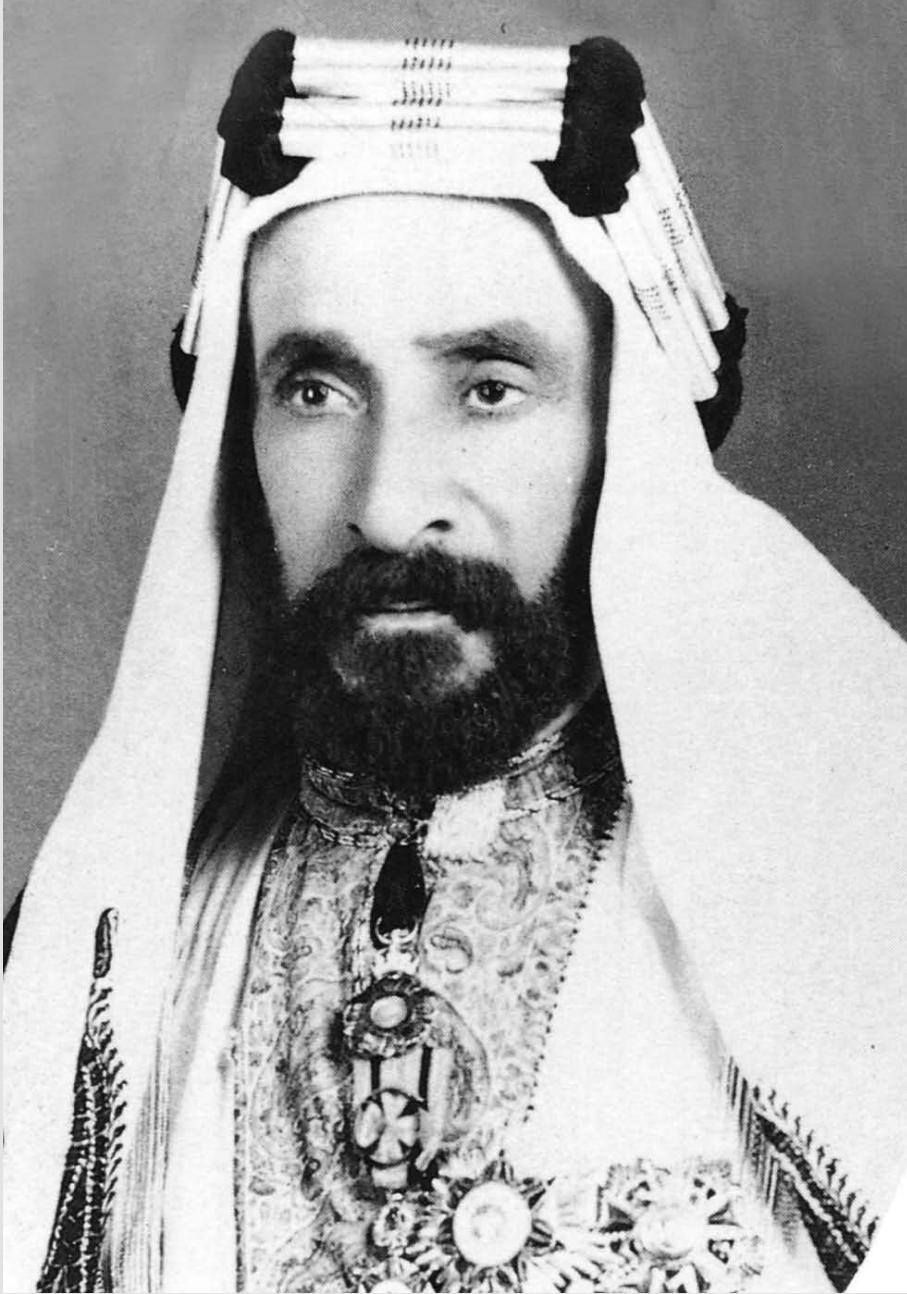
الراحل الشيخ عبد الله بن عيسى آل خليفة وزير التربية والتعليم في العشرينيات