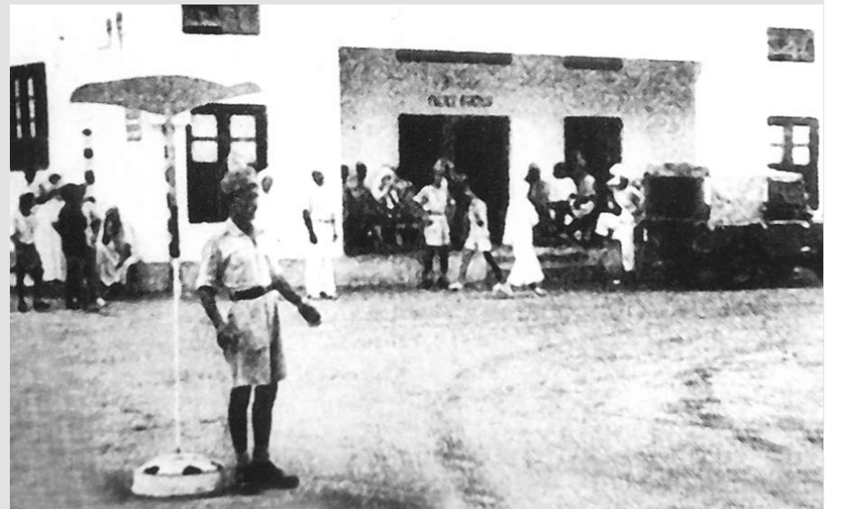
مركز الشرطة قرب باب البحرين