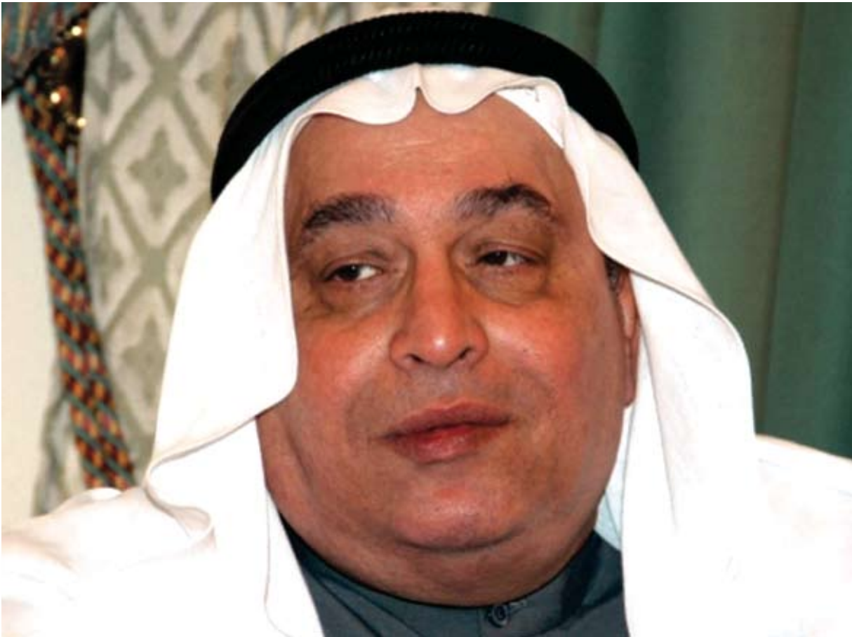
سعادة السفير كريم الشكر

لم يكن الشاب اليافع كريم إبراهيم الشكر ليتصور ما ستأخذه إليه الأقدار من دور وطني كبير في تأسيس وتفعيل الدبلوماسية البحرينية في أبرز المحافل الدولية في نيويورك وجنيف ولندن والصين، إلا في ظل أجواء ورؤية ثاقبة وبعيدة لقيادتها السياسية، ووجود رجالات أكفاء حملوا على عاتقهم مسؤولية التعبير عن المواقف الرائدة والخيرة لمملكة البحرين في مختلف المحافل والمواقع الدولية التي يحضرونها أو يتفاعلون معها، فلقد ولد كريم إبراهيم الشكر وكيل وزارة الخارجية للشؤون الدولية في أعقاب انتهاء الحرب العالمية الثانية ومع بزوغ شمس منظمة الأمم المتحدة، والتي ستكون له أنشطة متميزة في أروقتها، مع بزوغ شمسها ولد كريم إبراهيم الشكر، وذلك في ٢٣ من شهر ديسمبر لسنة ١٩٤٥م، وفي فريج «الحطب» بين «الفاضل و«كانو» كانت البداية، حيث اللعب والمرح في أجواء المحبة والإياء ودروس الكتابيب الجاذبة والمحبة إلى روح كريم الشكر الذي انتقل كما يروي لـ «رمضانيات» للدراسة في المدرسة الشرقية الابتدائية، وفي تلك الاثناء انتقل محل سكن أسرته من فريج «الحطب» إلى فريج «المخارقة» الذي فرض عليه تغيير مدرسته إلى «الغربية»، والتي سميت بمدرسة ابوبكر الصديق لاحقا، لينتهي بعد ذلك دراسته الثانوية، وينطلق نحو آفاق الجامعة في الهند إحدى الوجهات الأساسية للطلبة البحرينيين آنذاك.