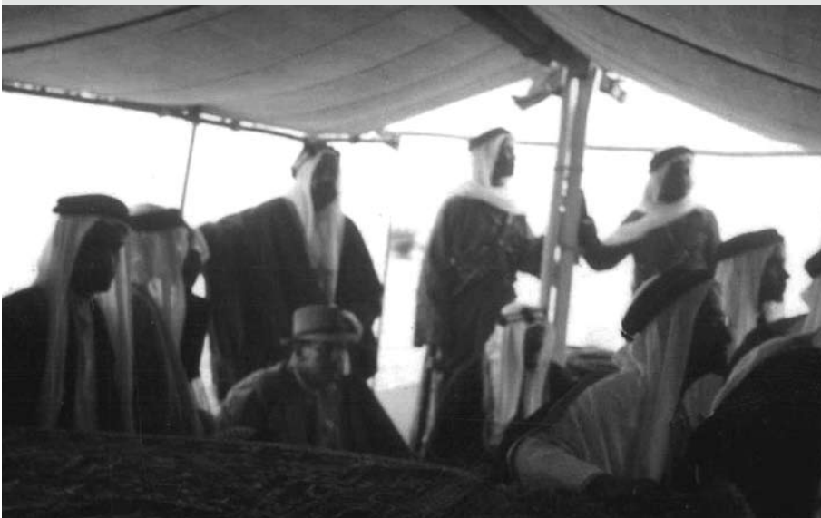
المغفور له الشيخ سلمان بن حمد آل خليفة مع المستشار بلجريف على ظهر قارب في عرض البحر في عام 1952 م