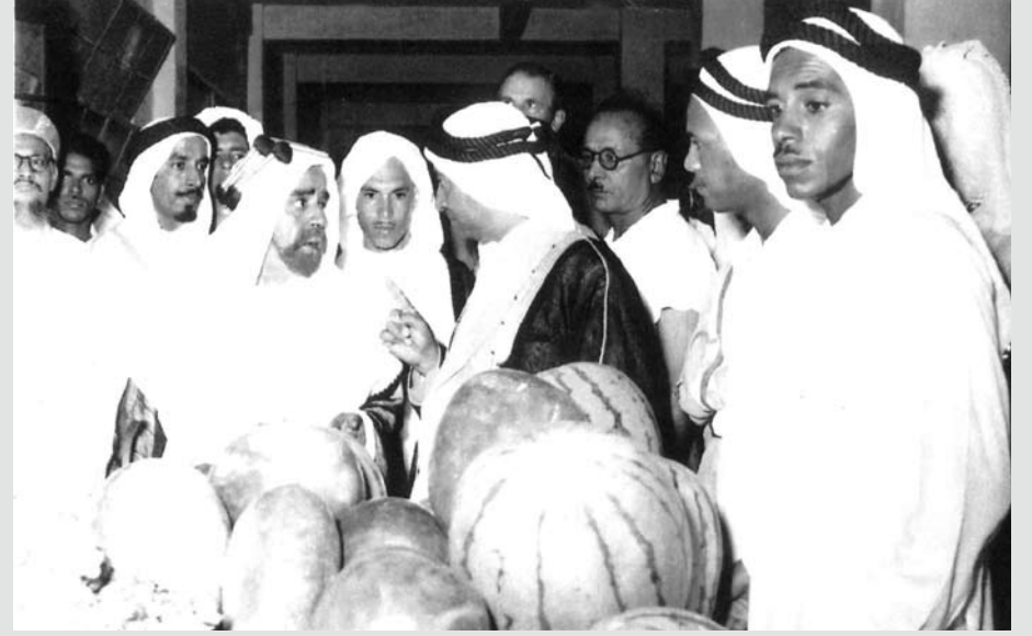
المغفور له صاحب العظمة الشيخ سلمان بن حمد آل خليفة أثناء تفقده الأسواق وبرفقته المستشار بلجريف والسيد كاظم العلوي والسيد صالح الصالح وعدد من المرافقين