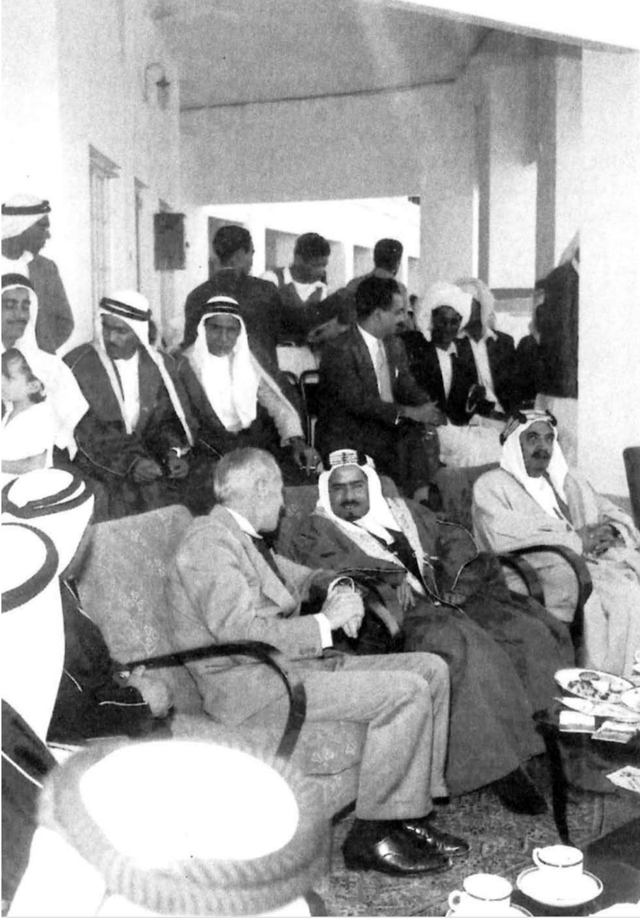
المغفور له صاحب السمو الشيخ عيسى بن سلمان آل خليفة يقوم بزيارة الى مستشفى النعيم يرافقه الشيخ مبارك بن حمد آل خليفة مدير ادارة الصحة