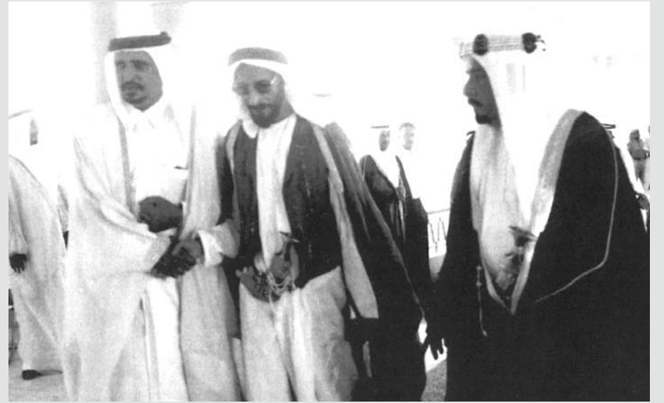
المغفور له صاحب السمو الشيخ عيسى بن سلمان آل خليفة مع الراحل الشيخ شخبوط حاكم أبوظبي وحاكم قطر في عام 1968 م