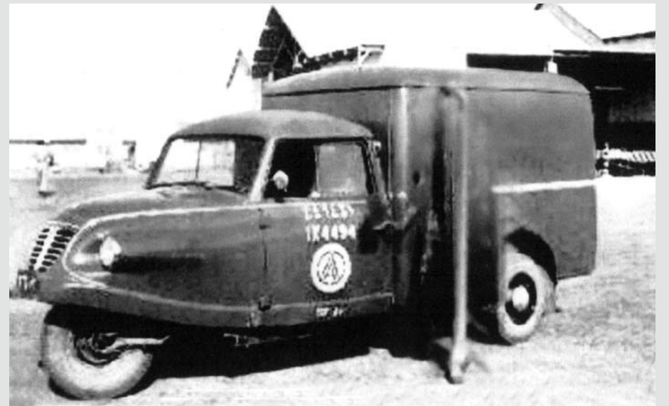
سيارة (سكوتر) كانت تستخدم في داخل مجمع شركة بابكو في عام 1950 م