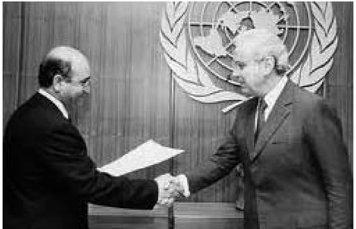
سعادة السفير مصافحا الأمين العام للأمم المتحدة خافيير بيريز دي كويلار

وبعد تأمل قصير، علق الشكر والمسرة تملؤ شفثيه «تشرفت بحضور العديد من الزيارات التي قام بها سمو الأمير الراحل الشيخ عيسى بن سلمان آل خليفة - طيب الله ثراه -، كما رافقته أثناء مشاركته في مؤتمرات عدم الانحياز، وفي زيارته لكل من الهند