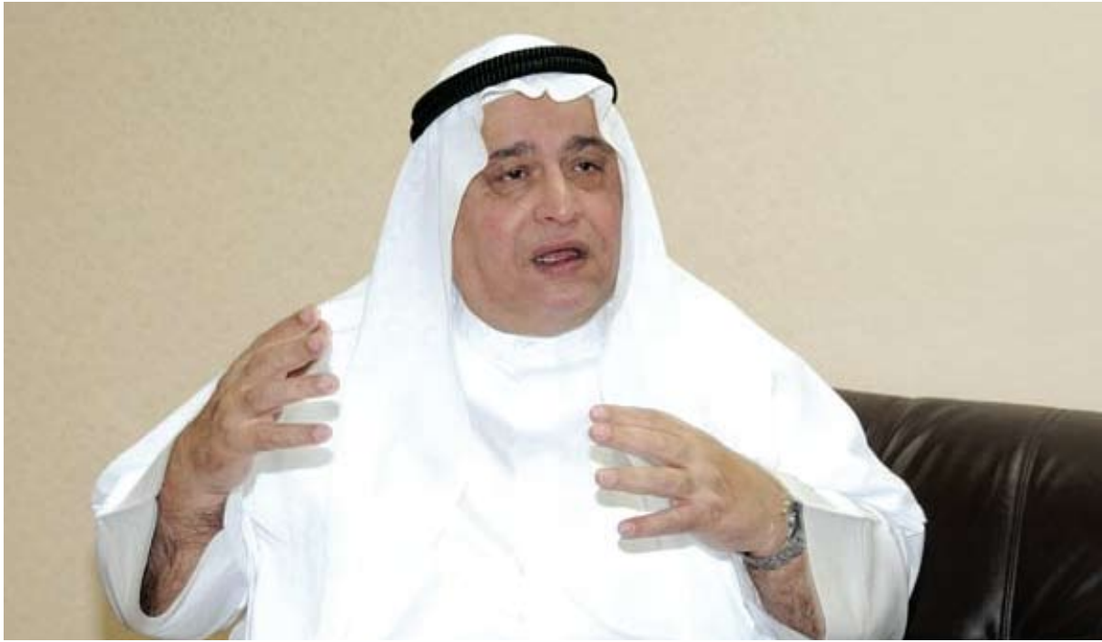
سعادة السفير كريم الشكر

الأمم المتحدة، كما تضم العديد من المنظمات التابعة لمنظمة الأمم المتحدة، كمنظمة الصحة الدولية، ومنظمة حماية الملكية الفكرية، ومنظمة العمل الدولية، ولجنة حقوق الإنسان، وكانت جنيف تستضيف المؤتمرات والاجتماعات طيلة العام.