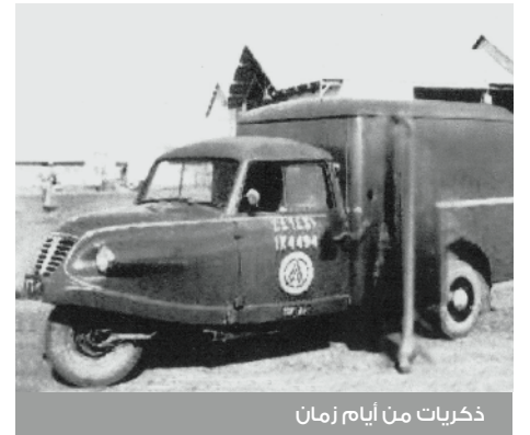
ذكريات من أيام زمان