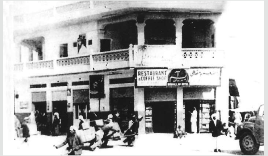
أحد المناطق المزدهمة في العاصمة ويرى فيها مطعم ومقهى (بسم الله)