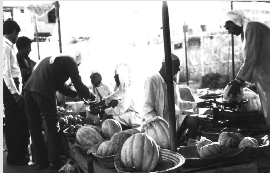
سوق الخضروات والفواكه المفتوح بالقرب من بلدية المنامة القديمة