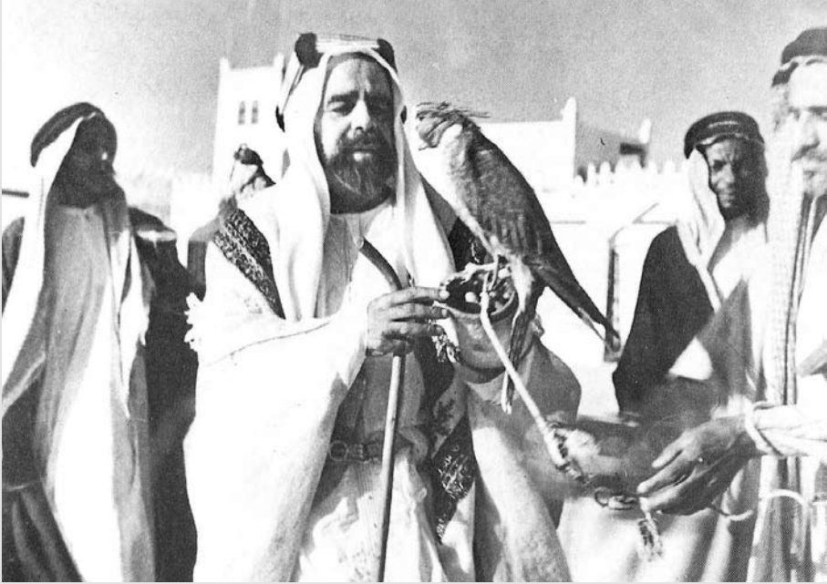
المغفور له صاحب العظمة الشيخ سلمان بن حمد آل خليفة حاملاً أحد الصقور وبجانبه الصقار وبعض المرافقين