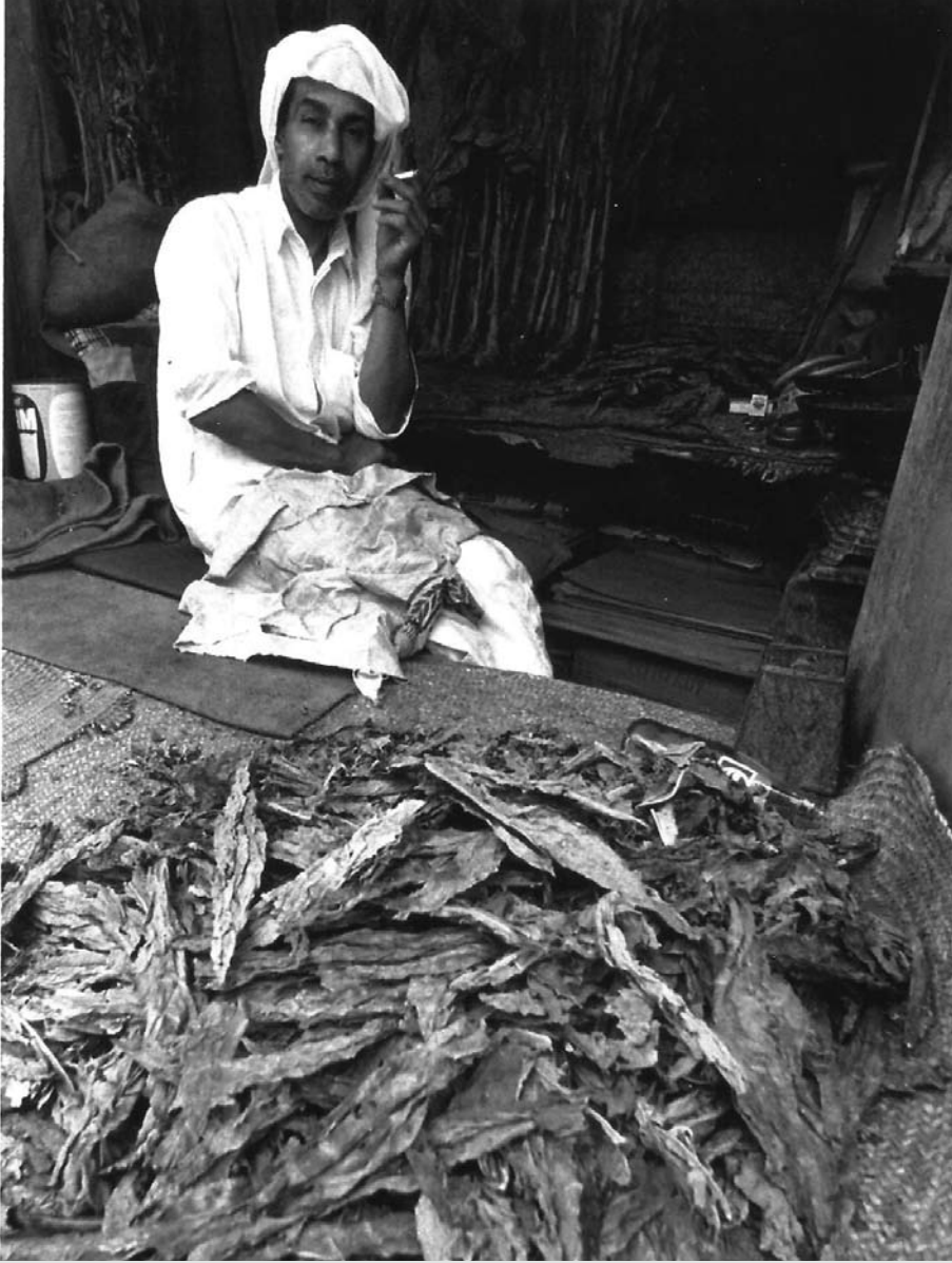
بائع التتن (التبناك) وهي أحد المهن التي مازال لها شعبية وكان هناك سوق خاص لبيع التتن