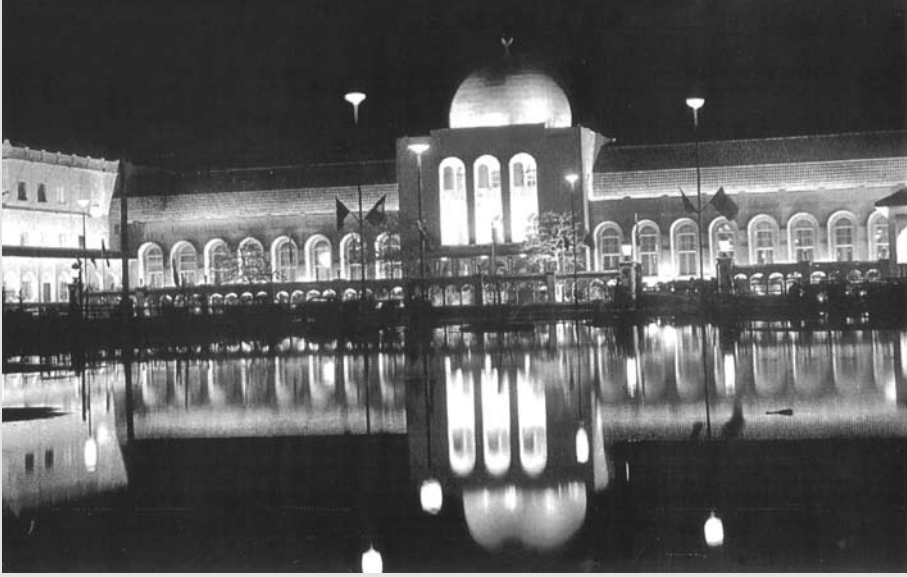
قصر الضيافة في القضيبة