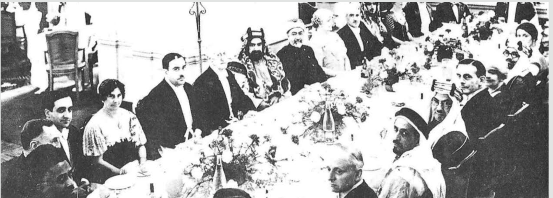
مأدبة عشاء أقامه اللورد زتلاند على شرف المغفور له صاحب العظمة الشيخ حمد بن عيسى آل خليفة خلال زيارة الى المملكة المتحدة بدعوة من الحكومة البريطانية في عام 1936م