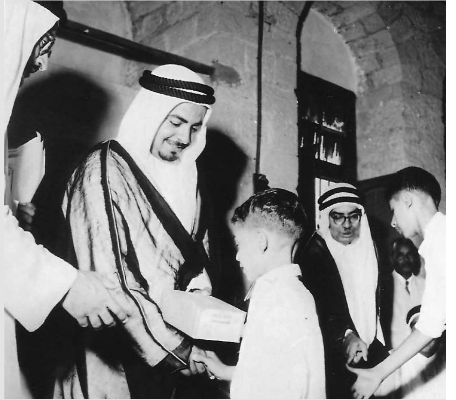
صاحب السمو الملكي الأمير خليفة بن سلمان آل خليفة يتشرف بتقديم جوائز للطلبة المتفوقين بإحدى المدارس الأجنبية في البحرين