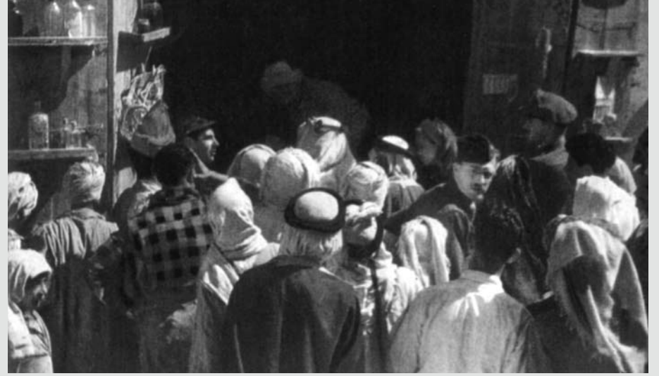
مواطنون يجتمعون على محل في السوق حيث يتواجد أفراد من البحرية الأمريكية لدى تسوقهم في الأسواق الشعبية