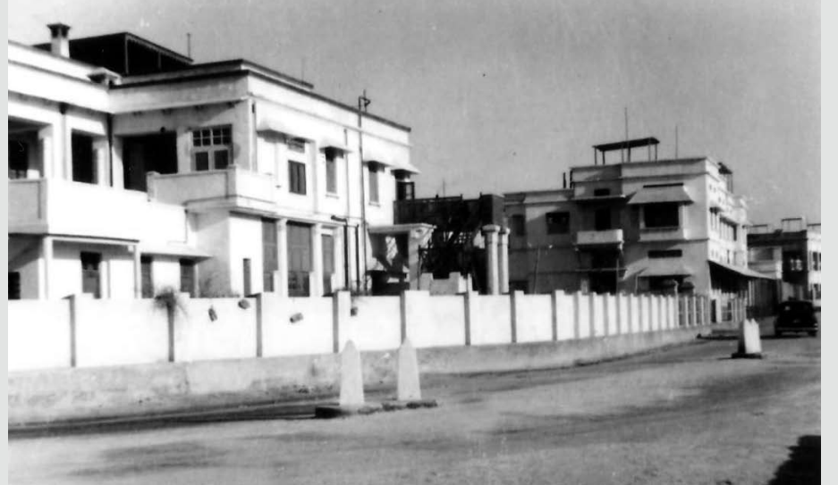
مستشفى النعيم بالمنامة في عام 1952 م