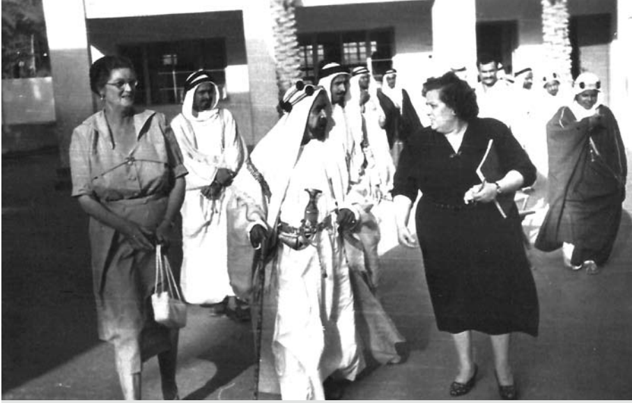
المغفور له صاحب العظمة الشيخ سلمان بن حمد آل خليفة في زيارة الى مستشفى النعيم وذلك بمناسبة توسعة مبنى المستشفى