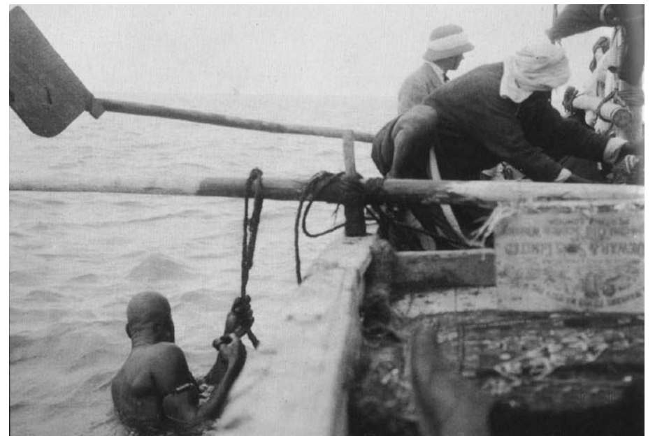
الغواص أثناء قيامه بمهمة الغوص