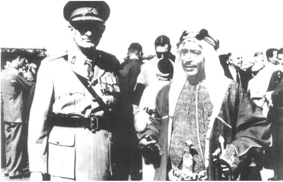
المرحوم الشيخ خليفة بن محمد آل خليفة رئيس شرطة المنامة مع احد كبار الضباط في مضمار سباق الخيل (الريس) بمنطقة العدلية في عام 1940 م