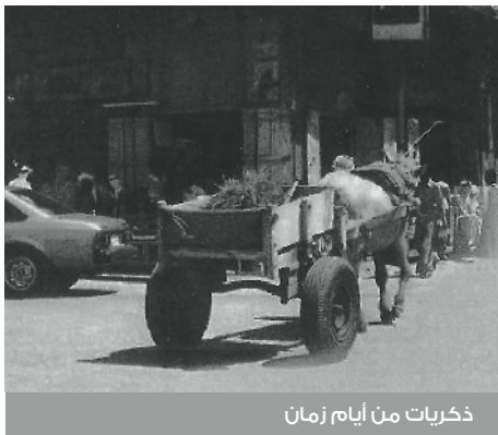
ذكريات من أيام زمان