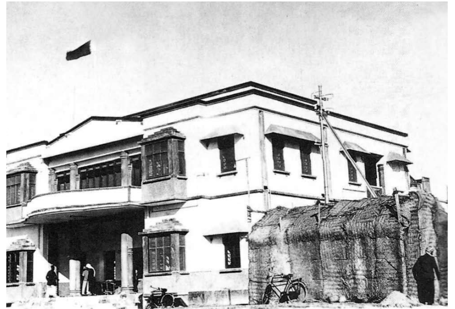
منظر عام لمستشفى النعيم