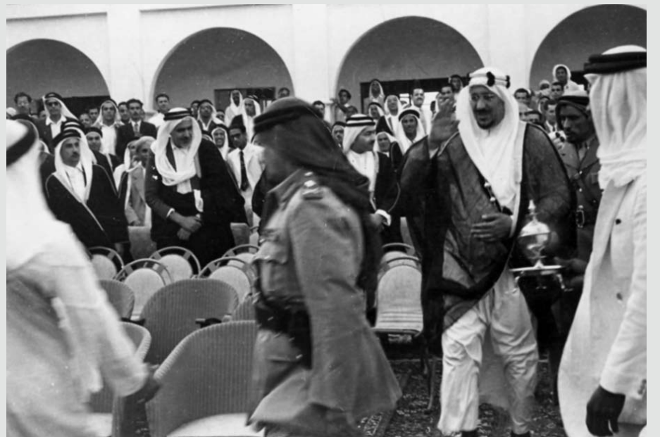
المغفور له جلالة الملك عبدالعزيز آل سعود لدى وصوله الى مكان حفل الاستقبال بمناسبة زيارته الى البحرين