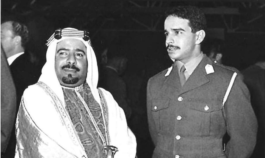
المغفور له صاحب السمو الشيخ عيسى بن سلمان آل خليفة مع صاحب الجلالة الملك حمد بن عيسى آل خليفة في أكاديمية مونز في عام 1968 م