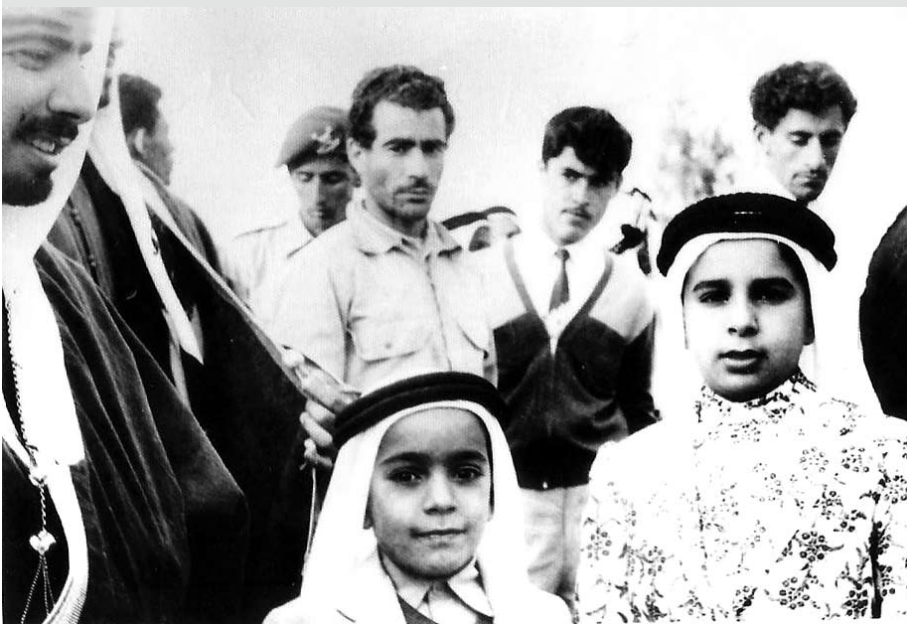
المغفور له صاحب السمو الشيخ عيسى بن سلمان آل خليفة ونجليه صاحب الجلالة الملك حمد بن عيسى آل خليفة والشيخ محمد بن عيسى آل خليفة خلال حضورهم إحدى المناسبات الوطنية