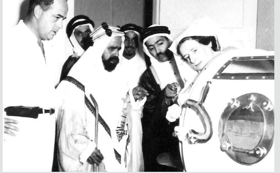
المغفور له صاحب العظمة الشيخ سلمان بن حمد آل خليفة عند تفقده الأجهزة الحديثة في قسم الولادة بمستشفى النساء