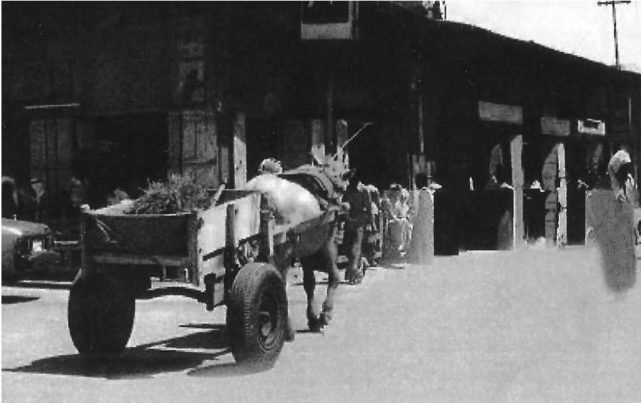
المحلات التجارية بالقرب من بلدية المنامة