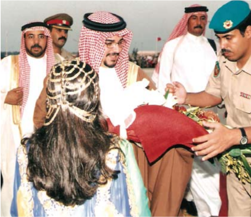
مع صاحب السمو الملكي الأمير سلمان بن حمد آل خليفة في إحدى المناسبات