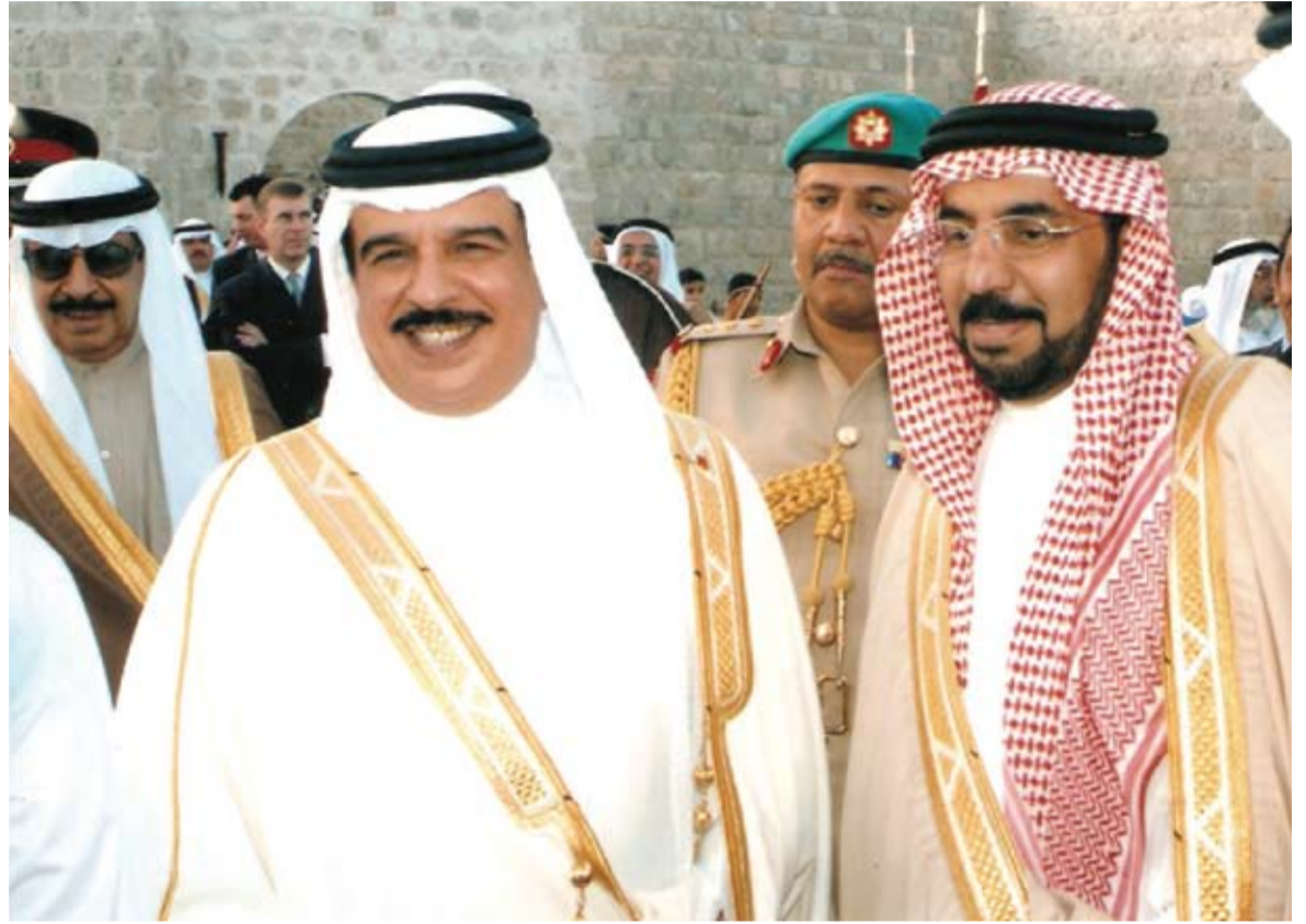
مع صاحب الجلالة الملك المفدى وسمو رئيس الوزراء يوم تعيينه في مجلس الشورى عام 1996م

ولله الحمد، نحن في الحقيقة نعيش في خير بين أهلنا وذوينا ومع كل أسرة على أرض البحرين الطيبة، بدءاً بالعائلة الحاكمة، آل خليفة الكرام، مروراً بأصغر بيت وأ أسرة في أي مكان في البحرين.. ولهذا، قلت هذه المقدمة لأشير إلى أنني مع اخوتي وأخواتي نشكر الله دوماً على نعمة المحبة بيننا وبين كافة أفراد العائلة، وأكثر من يبعث في القلب السرور هي أن الجميع على كلمة (قلب واحد)، في السراء والضراء.. ونسأل الله أن يديم علينا وعلى الجميع الخير والمعروف والرخاء.