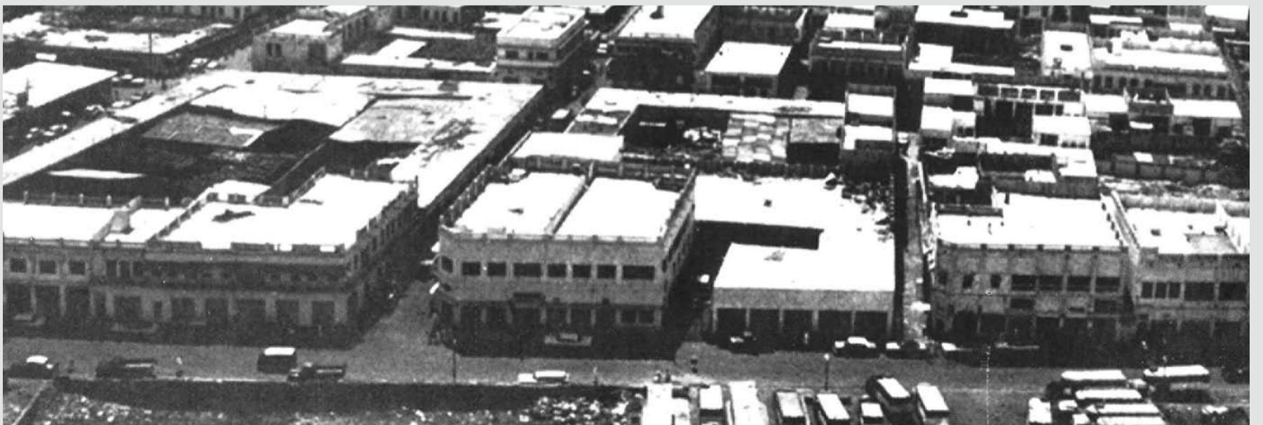
شارع الحكومة، ومن أسفل اليسار (الأرض الخالية) حالياً فندق دلمون ومقابلها بناية الشيخ مبارك بن حمد آل خليفة، تليه بناية خليل بن إبراهيم كانو، تليه القهوة الشعبية المشهورة، ثم بناية يوسف إنجنير ومقابلها محطة الباصات