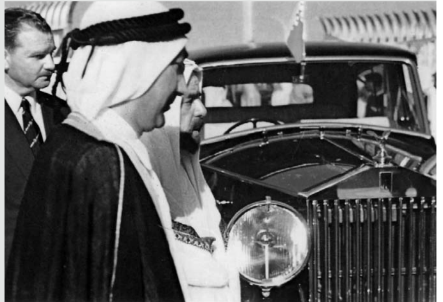
صاحب العظمة المغفور له الشيخ سلمان بن حمد آل خليفة برفقة سيد شرف العلوي، مدير الكهرباء، خلال الإفتتاح الرسمي لمحطة الكهرباء