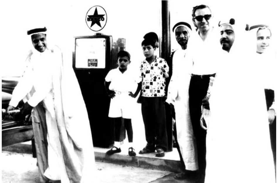
المغفور له صاحب السمو الشيخ عيسى بن سلمان آل خليفة وبجانبه صاحب الجلالة الملك حمد بن عيسى آل خليفة والحاج محسن بن سلوم خلال افتتاح محطة الوقود بالبسيطين لصاحبه محمد علي حسن