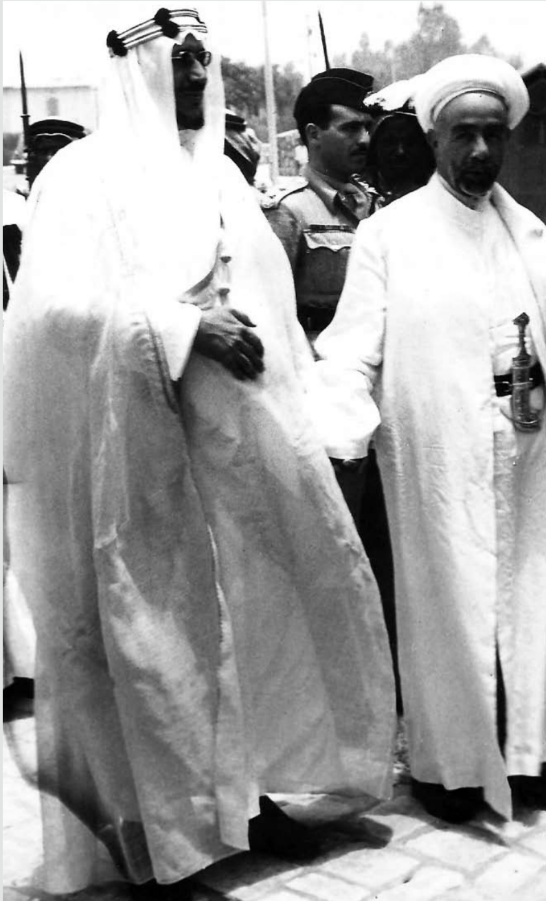
الملك عبدالله ابن الشريف حسين، ملك الأردن وفلسطين في زيارة إلى الملك سعود بن عبدالعزيز آل سعود ملك المملكة العربية السعودية عام 1952م