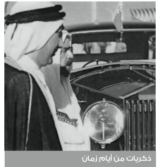
ذكريات من أيام زمان