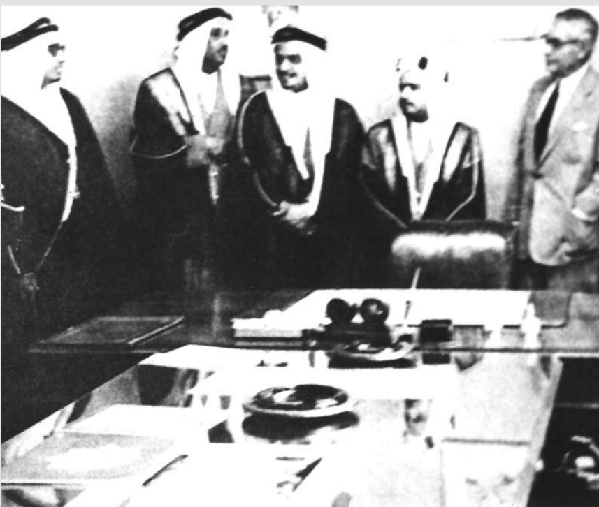
المغفور له صاحب السمو الشيخ عيسى بن سلمان آل خليفة، برفقة صاحب السمو الملكي الأمير خليفة بن سلمان آل خليفة، حفظه الله ورعاه، خلال زيارة إلى مكتب شركة كالتكس في نيويورك