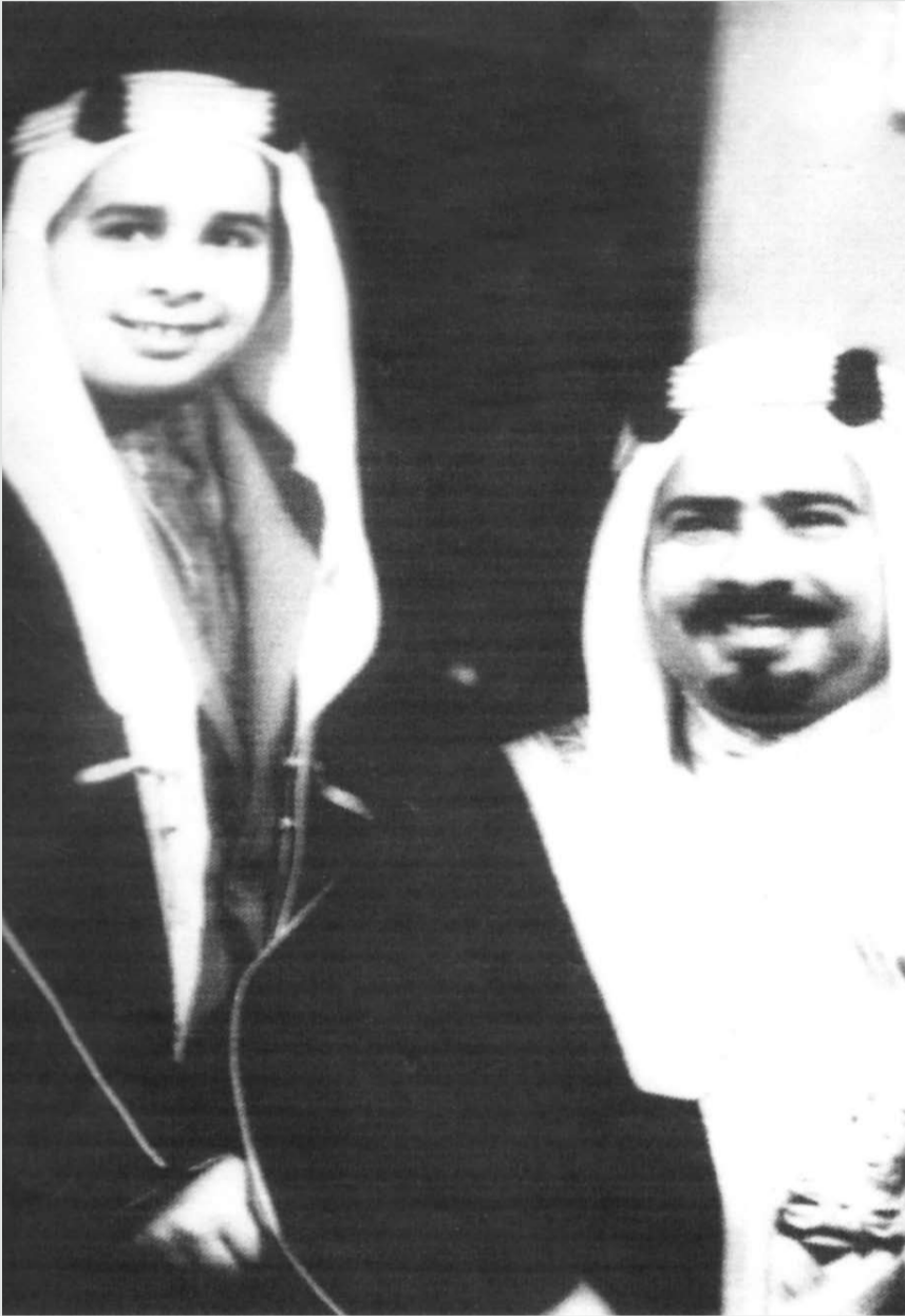
المغفور له صاحب السمو الشيخ عيسى بن سلمان آل خليفة ونجله صاحب الجلالة الملك حمد بن عيسى آل خليفة حفظه الله ورعاه