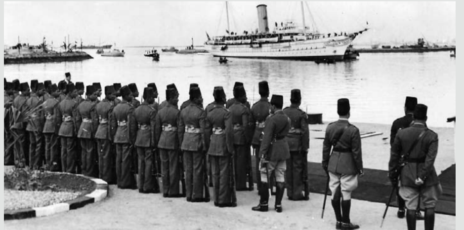
حرس الشرف المصري في استقبال الملك عبدالعزيز آل سعود لدى وصول جلالته بالباخرة