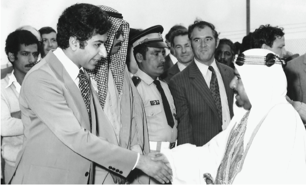
مصافحاً المغفور له الشيخ عيسى بن سلمان آل خليفة، عند زيارته لمحطة ستره للكهرباء والماء عام 1974