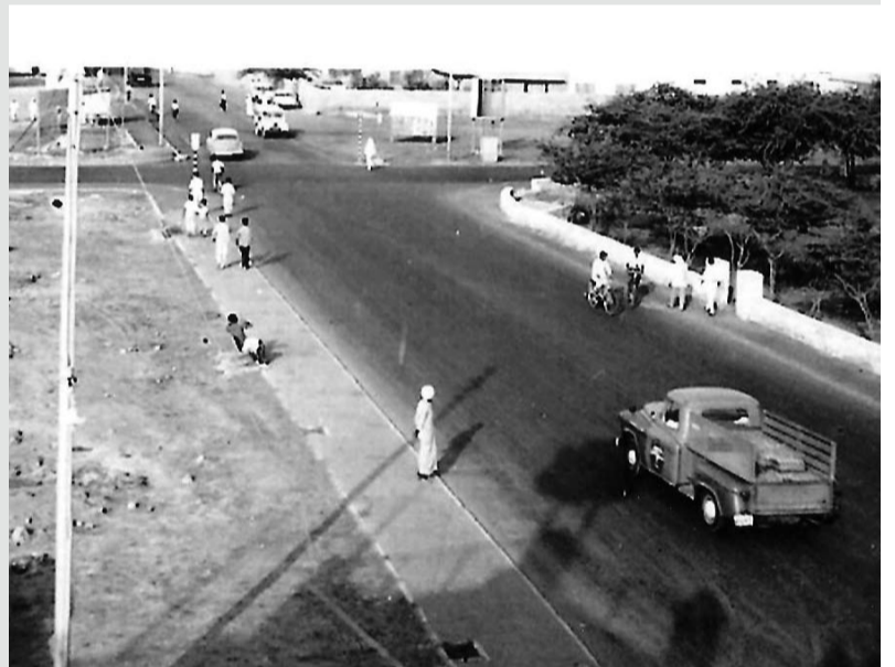
تقاطع نادي باكستان وفندق الشرق الأوسط