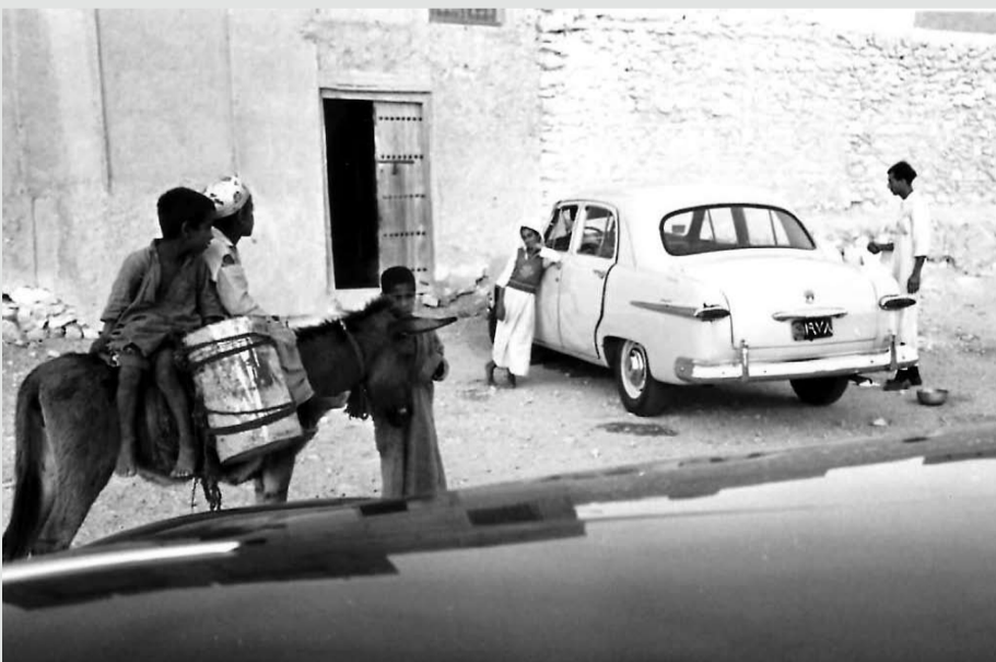
نقل وتوصيل المياه عن طريق الحمير في إحدى الأحياء القديمة ويرى في الخلف سيارة أوستن