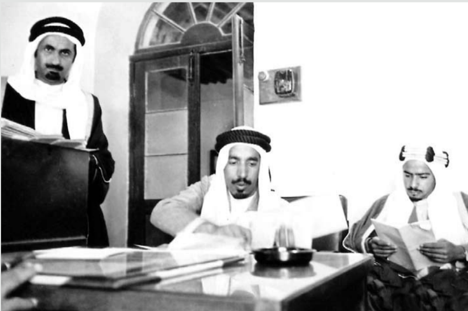
المغفور له صاحب السمو الشيخ عيسى بن سلمان آل خليفة، في المكتب بالرفاع ويظهر بالصورة خليفة القعود وعبدالله عيسى بن سبت