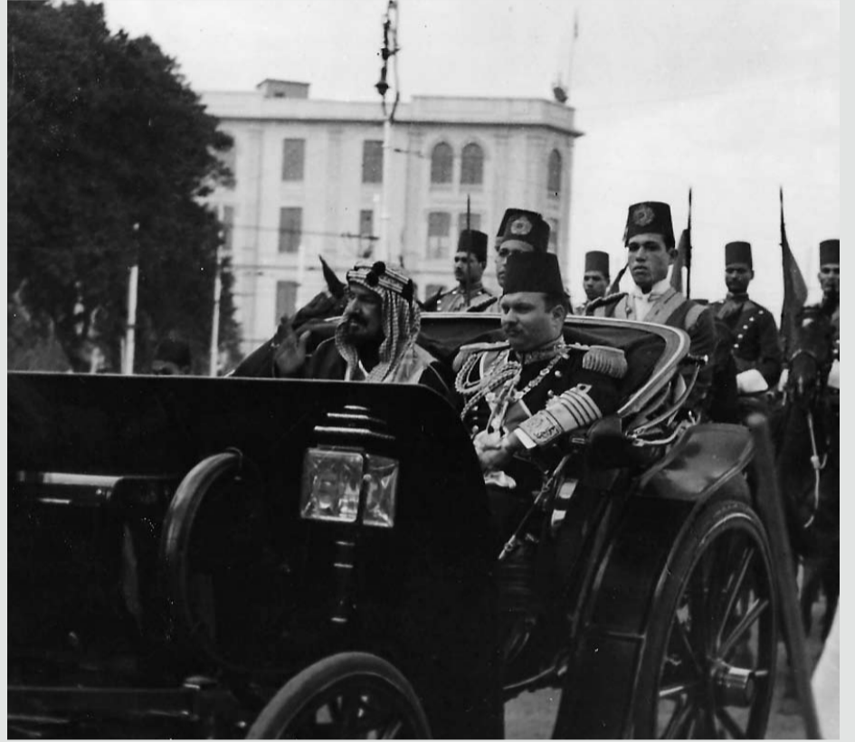
الملك عبدالعزيز بن آل سعود في زيارة تاريخية للملك فاروق فؤاد، ملك مصر والسودان في ذلك الوقت في عام 1934م