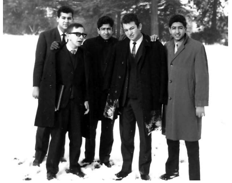
خلال فترة الدراسة في كلية كونكورد في إنجلترا