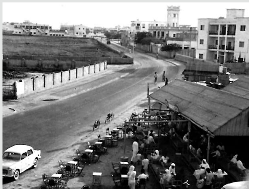
قهوة بالقرب من المقبرة في المنامة