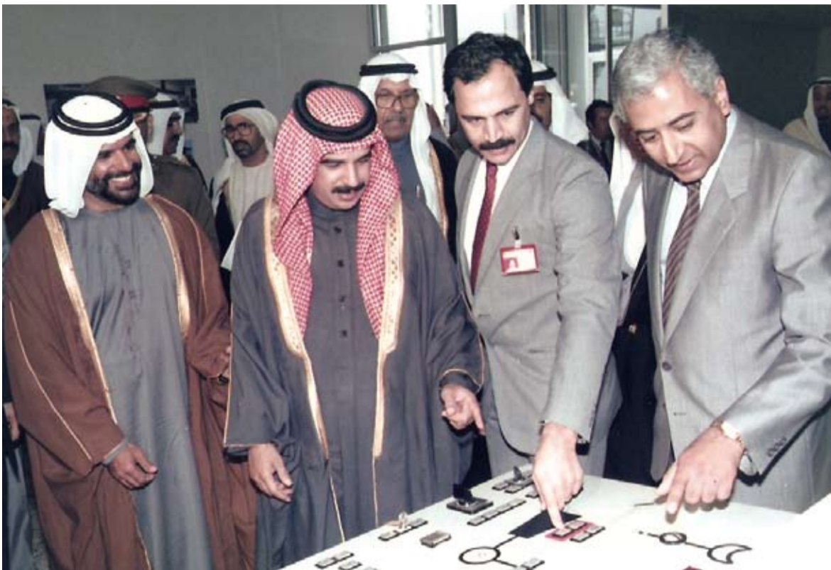
مع جلالة الملك المفدى خلال تدشين مشروع محطة سترة للكهرباء والماء (أبو ظبي) وقت ما كان جلالتة ولياً للعهد