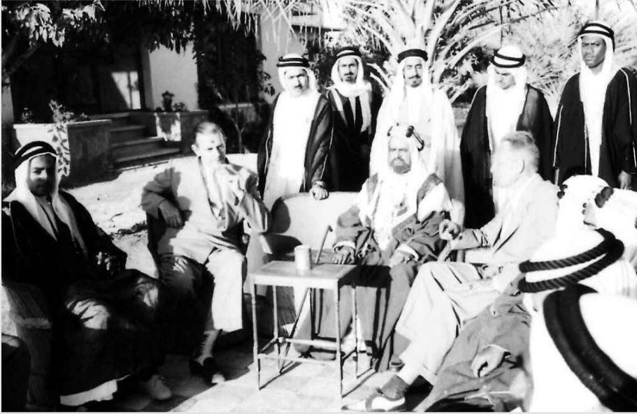
المغفور له صاحب العظمة الشيخ سلمان بن حمد آل خليفة، وبجانبه المستشار بلجريف والواقفين من اليسار، حسين يتيهم وخليفة القعود وعبدالله بن سبت ويوسف إرحمة الدوسري