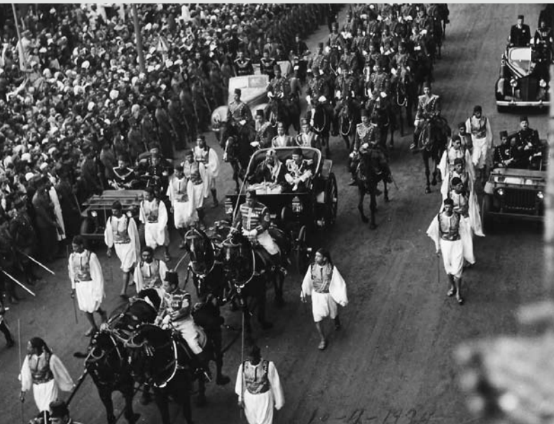
الإستقبال الرسمي الكبير للملك عبدالعزيز بن آل سعود في القاهرة