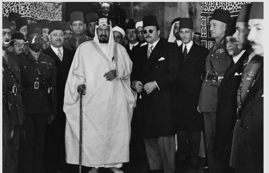
الملك عبدالعزيز بن آل سعود والملك فاروق في الجامع الأزهر الشريف