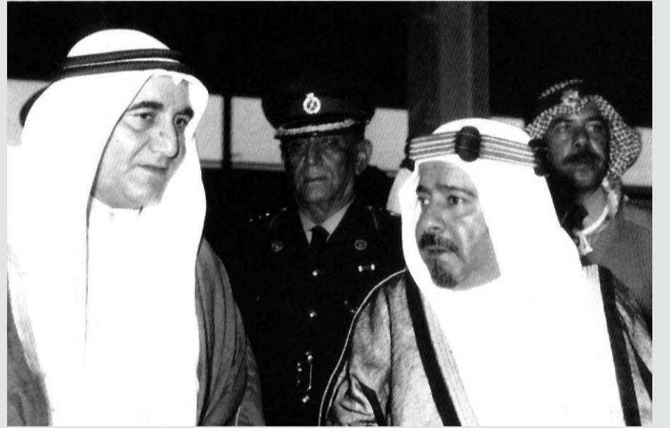
المغفور له صاحب السمو الشيخ عيسى بن سلمان آل خليفة، مع علي بن يوسف فخر، وفي الخلف المرحوم العميد علي ميرزا