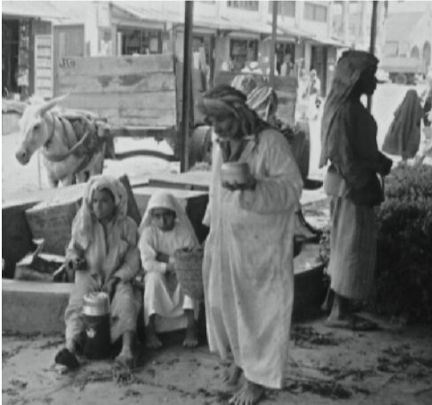
ذكريات من أيام زمان