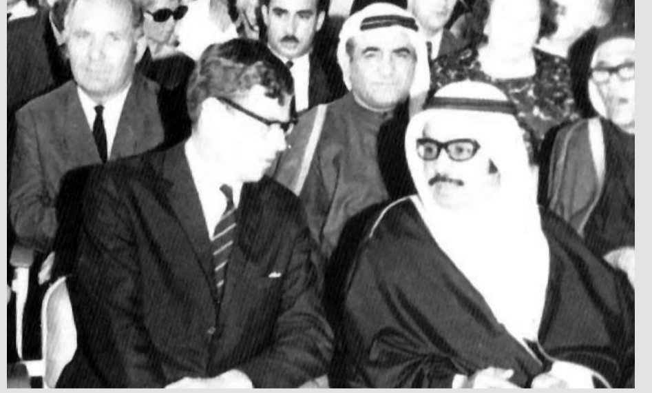
صاحب السمو الملكي الأمير خليفة بن سلمان آل خليفة، ويرى في الخلف المرحوم علي بن يوسف فخر، المرحوم سيد محمود العلوي، وسعادة الأستاذ جواد سالم العريض، في حفل إفتتاح مبنى البلدية بالمنامة