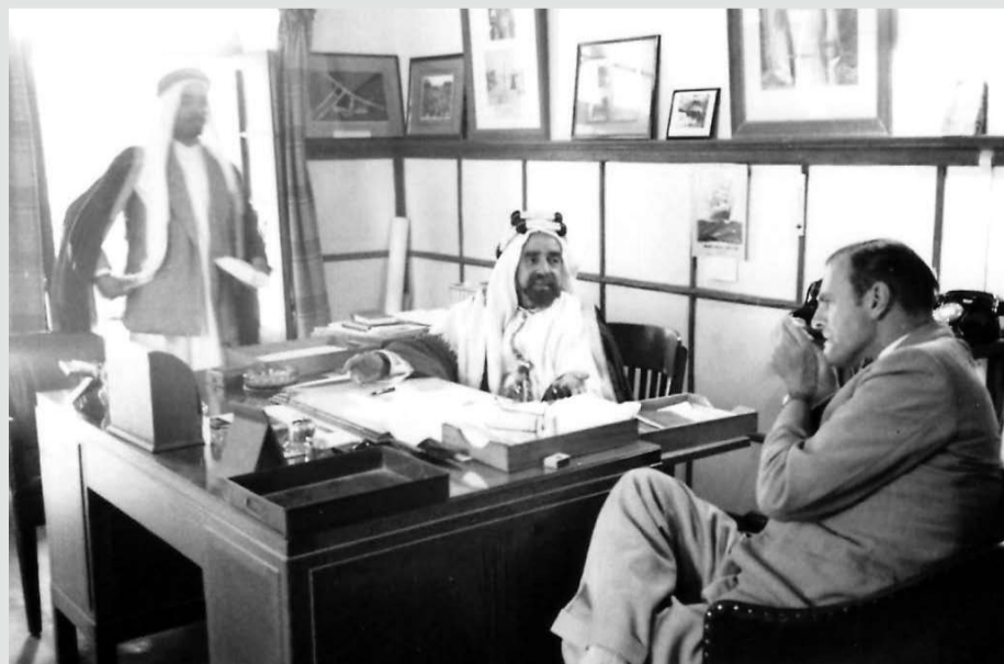
المرحوم له صاحب العظمة الشيخ سلمان بن حمد آل خليفة في مكتبه بالرفاع ومعه المستشار بلجريف وعبدالله عيسى بن سبت