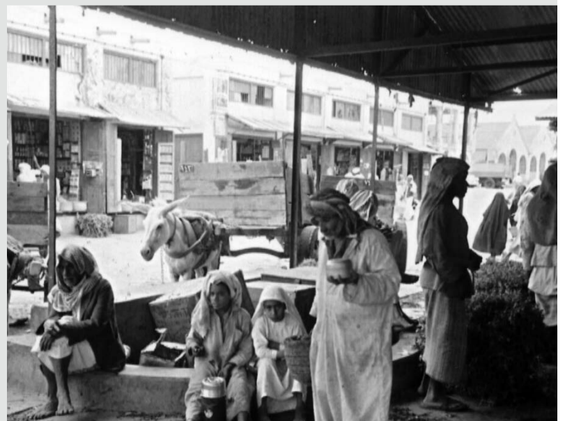
موقف عربات النقل قرب سوق الخضرة واللحم في المنامة، و كان لكل عربة رقم مسجل لدى البلدية