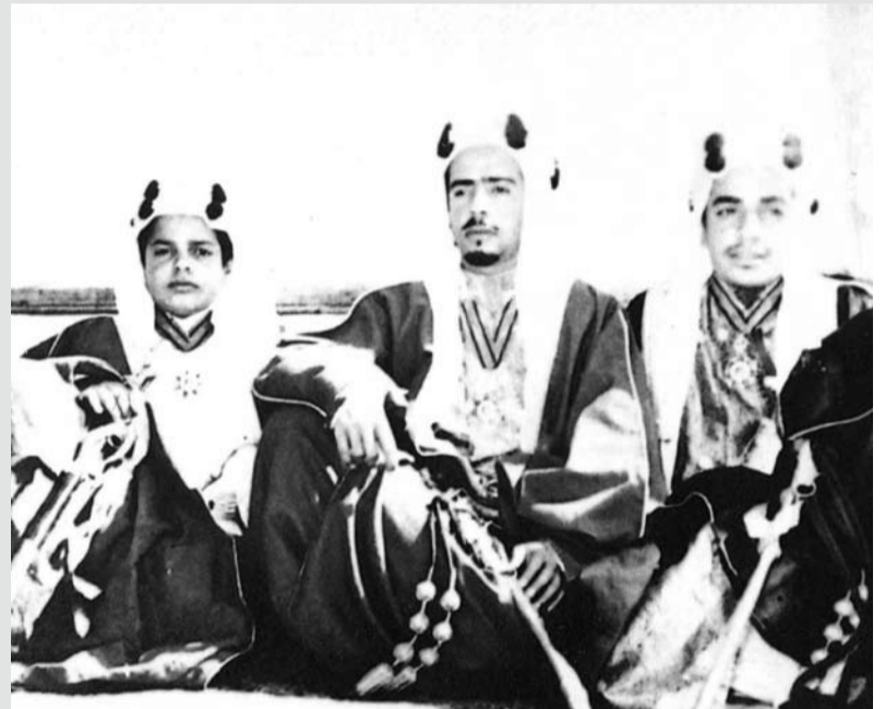
المغفور له صاحب السمو الشيخ عيسى بن سلمان آل خليفة، والمغفور له صاحب السمو الملكي الأمير محمد بن سلمان آل خليفة، وصاحب السمو الملكي الأمير خليفة بن سلمان آل خليفة