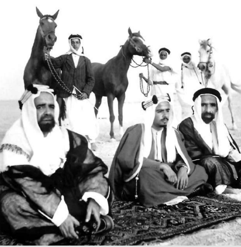
المغفور له صاحب العظمة الشيخ سلمان بن حمد آل خليفة، والمغفور له صاحب السمو الشيخ عيسى بن سلمان آل خليفة (ولي العهد آنذاك) خلال متابعة لسباق الخيل في منطقة سافرة.