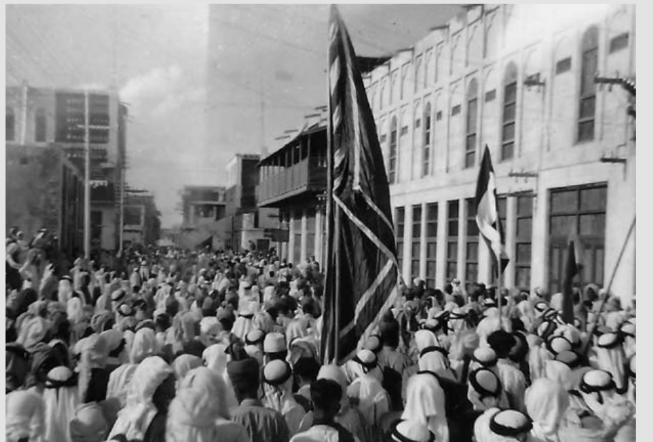
مظاهرات شعب البحرين ضد تقسيم فلسطين في سوق التجار بالمنامة، الموافق 5 ديسمبر 1947م