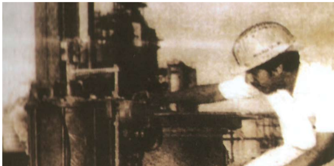
مهندساً في إحدى مراحل العمل

المؤهلات العلمية تتمثل في - بكالوريوس الهندسة الميكانيكية - المملكة المتحدة، ثم ماجستير إدارة المشاريع الصناعية - إيرلندا، ودكتوراه إدارة المشاريع الصناعية - المملكة المتحدة، وقد عملت وتقلدت الكثير من المناصب التي ضاعفت من خبراتي، حيث عملت مشرف إنتاج الكهرباء والماء، ثم العمل في شركة نبط البحرين بابكو، ثم رئيساً للمهندسين لمدة (8 سنوات)، ومسؤول عن إنتاج الكهرباء في مملكة البحرين وزارة الأشغال والكهرباء والماء، شركة ميدال للكابلات المحدودة، المدير العام، شركة الخليج لصناعة البتروكيماويات، الرئيس التنفيذي لشركة نبط البحرين، عضو سابق في مجلس الشورى، ورئيس جمعية البحرين للصحة والسلامة، ثم نائب رئيس الجمعية العالمية لمنتجي الأسمدة الكيماوية، رئيس الجمعية العربية لمصنعي الأسمدة الكيماوية، مؤلف لعدد من الكتب موجهة للناشئة في موضوع السلامة والبيئة، ومؤلف لكتاب حول الإدارة بعنوان "مفتاح نجاح المؤسسات"، وآخر إصدار لي كتاب "الإدارة الاستراتيجية" الذي وجد صيته عالياً واحتفى به المجتمع البحريني رسمياً واهلياً، وعضو مجلس أمناء جامعة البحرين، وعضو مجلس أمناء مركز البحرين للدراسات والبحوث، وبعد كل هذه النجاحات التي حققتها حظيت بنقطة جلالة الملك المفدى