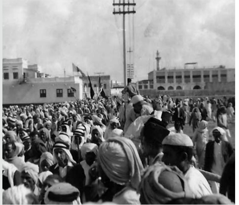
مظاهرات شعب البحرين بعد اجتماعهم في مسجد الفاضل بالمنامة ويظهر في الصورة مبنى محاكم و مسجد الفاضل