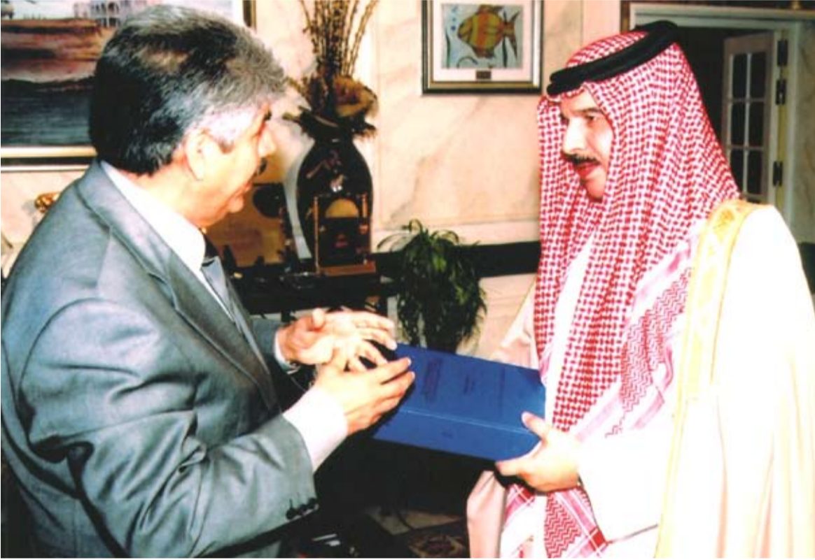
مع جلالة الملك في إحدى المناسبات