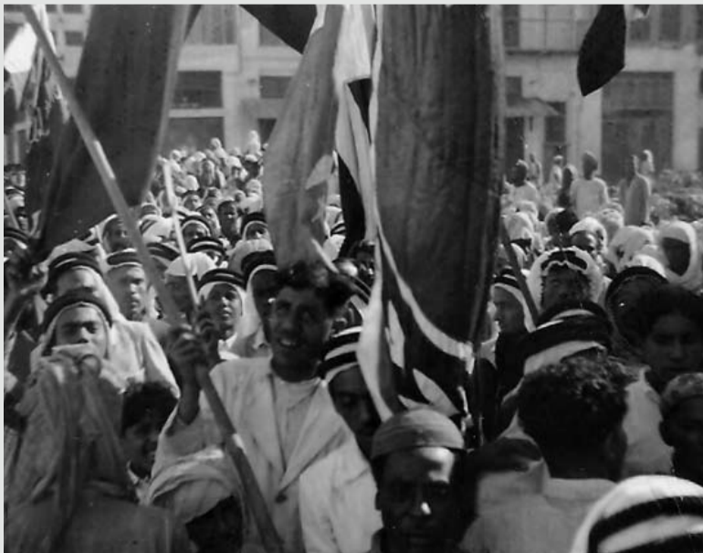
مظاهرات شعب البحرين في سوق المنامة