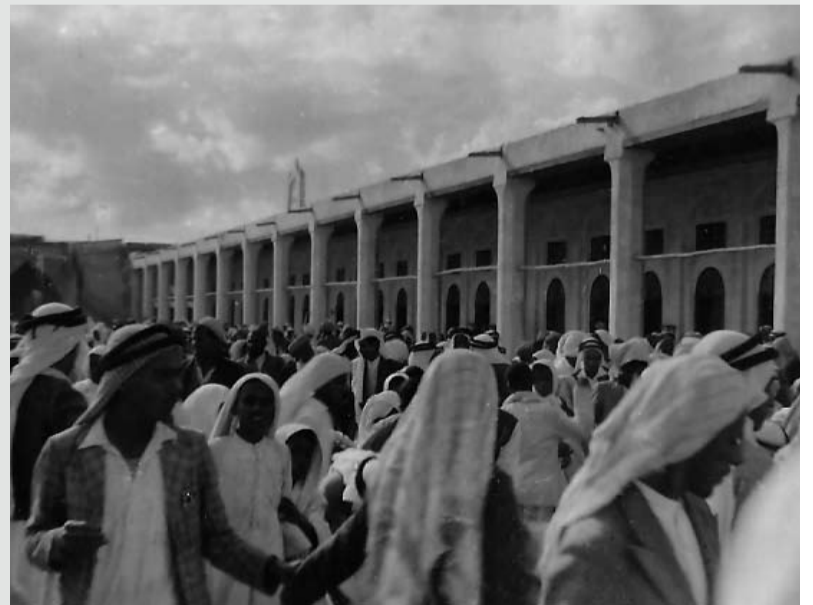
مظاهرات شعب البحرين في مسجد الفاضل بالمنامة