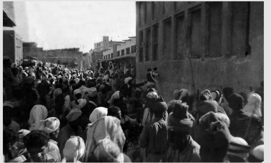
مظاهرات شعب البحرين ضد قرار تقسيم فلسطين، في المنامة