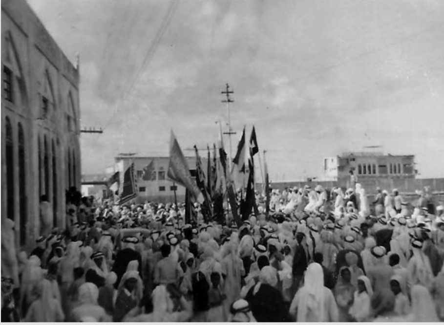
مظاهرات شعب البحرين بعد الإجتماع في مسجد الفاضل بالمنامة، ضد قرار تقسيم فلسطين، متجهين للسوق