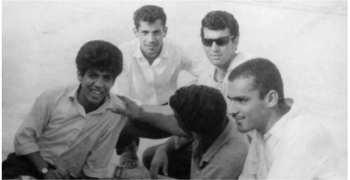
مع مجموعة من أصدقاء الدراسة

الخلاصة تكمن في أن التعبير عن ثقافة مجتمع ما لا يكون فقط في فنه أو تراثه أو تاريخه، لكن أيضاً في الكيفية التي