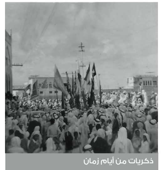
ذكريات من أيام زمان