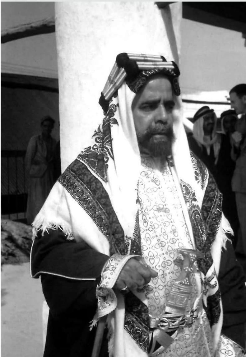
صاحب العظمة الشيخ سلمان بن حمد آل خليفة حاكم البحرين