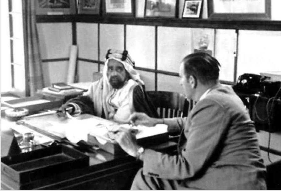
اجتماع حاكم البحرين الشيخ سلمان بن حمد آل خليفة مع المستشار بلجريف في مكتبه بالرفاع