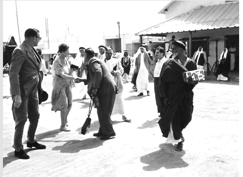
مطار المحرق في 1950 م وفي الصورة المستشار بلجريف وزوجته والشيخ عبدالله بن حمد آل خليفة رئيس دائرة الصحة