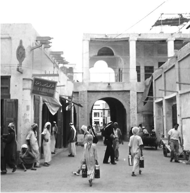
شارع المتنبى قرب البريد ويظهر دكان علي أجور