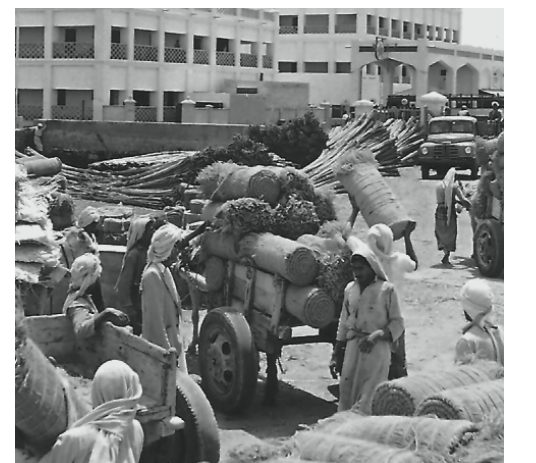
ذكريات من أيام زمان