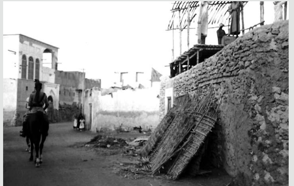
شرطة الخيالة في فريق العوضية