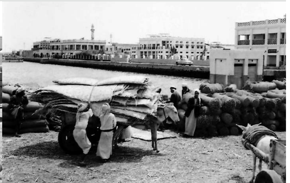
سوق قرب فرضة المنامة لتخزين وبيع الحبال والدنجل والمنكرور ويظهر مبنى المحاكم وبيت كريبال ومحطة يتيم للبتترول وكيبيل وايلس (بتلكو حالياً)