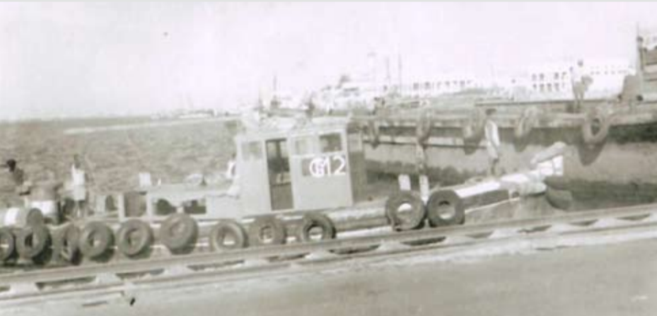
تكاك شركة كرف مكنزي أمام المحكمة