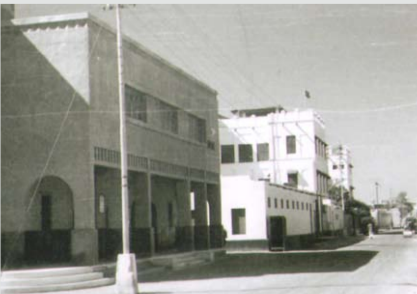
مكاتب الخطوط الجوية البريطانية