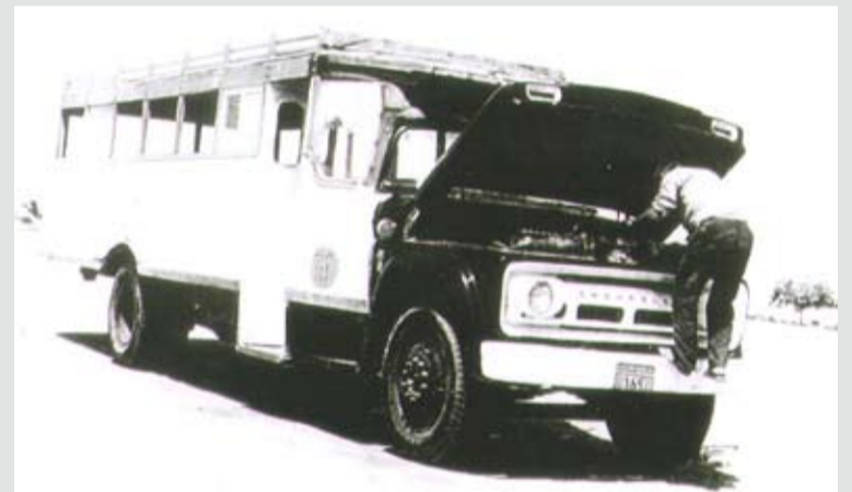
البست أو الباصات