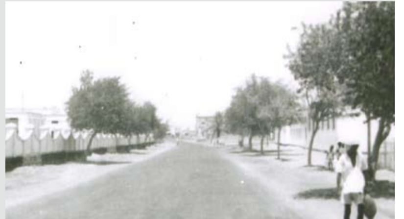
مدرسة الغربية (الإمام علي حالياً) مقابل مدرسة الصناعة سابقاً