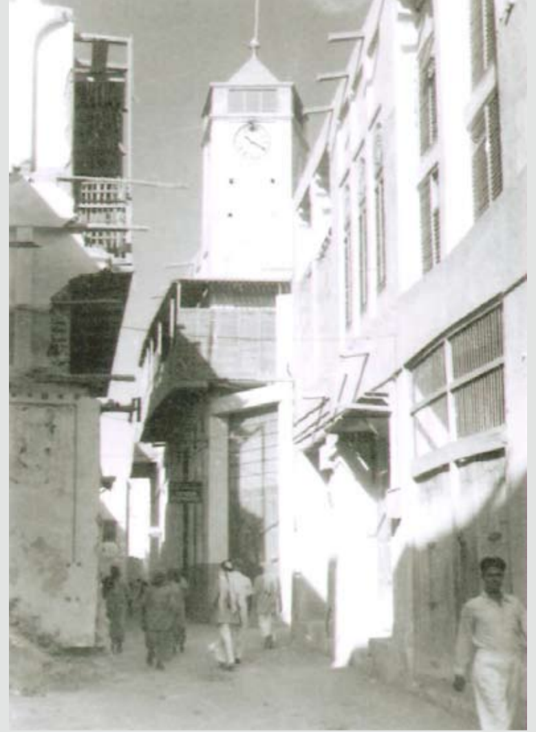
ساعة يتيه، قرب نظارات يتيه في السوق