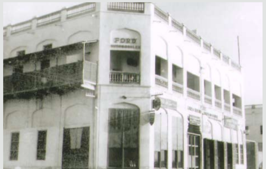
معرض كانو للسيارات (فورد)