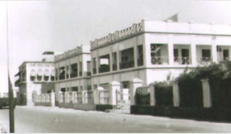
مبنى المحاكم على شارع الحكومة