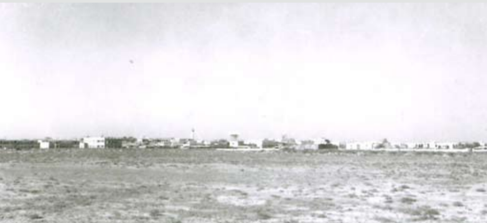
منظر عام من القضيبة