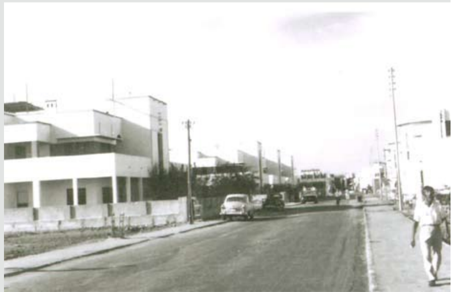
شارع الشفخ عفسى الكبر وموقع عفاة عبالله كمال