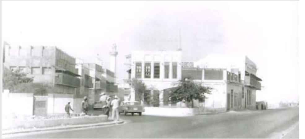
مدخل شارع الخليفة