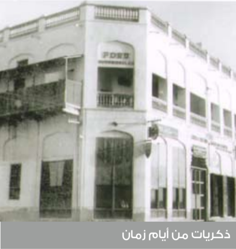
ذكريات من أيام زمان