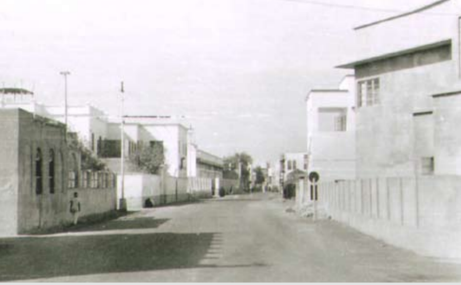
مدرسة العجم قرب بيت ففهم