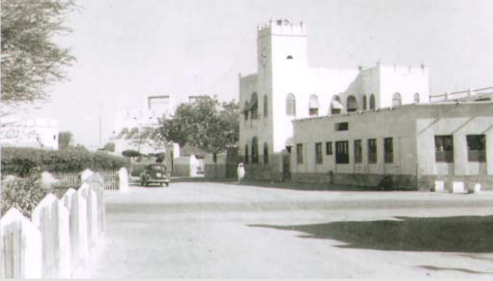
الكنيسة الموجودة في المستشفى الأمريكي