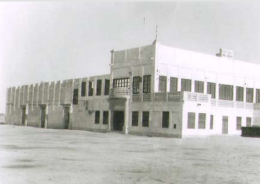
سفنما أوال في شارع الزبارة