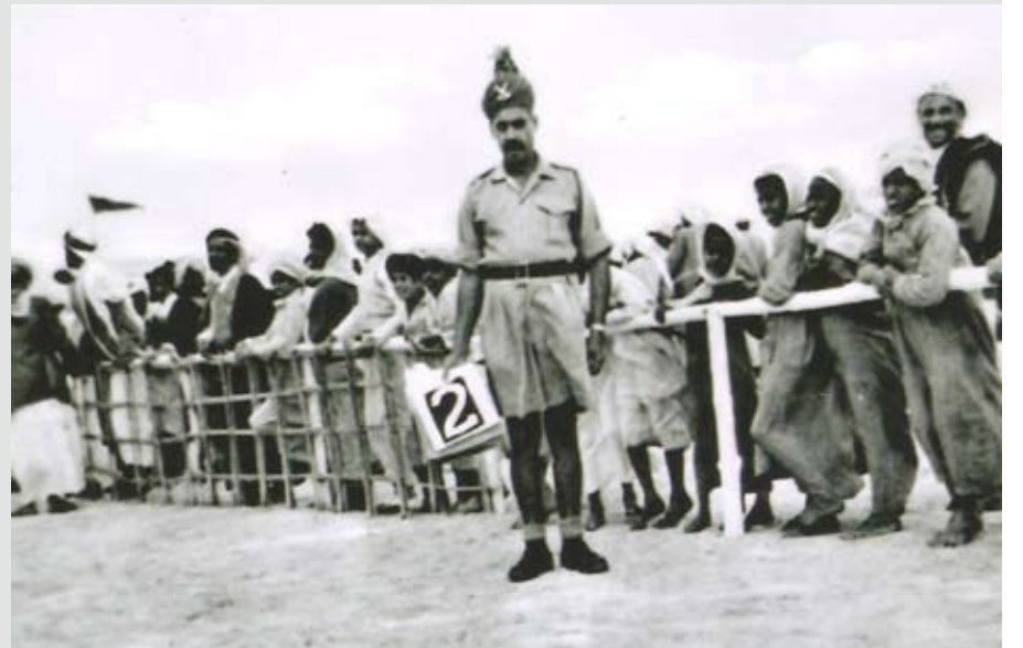
شرطي يتابع سباق الخيل في العدلية