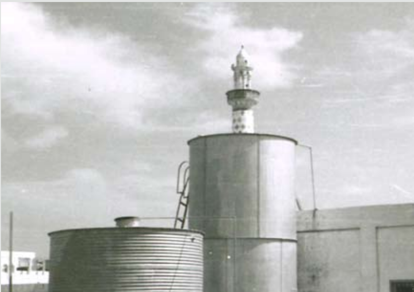
محطة حسين يتيم لتلية المياه