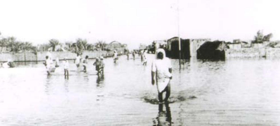
مياه الأمطار في سوق جدحفص