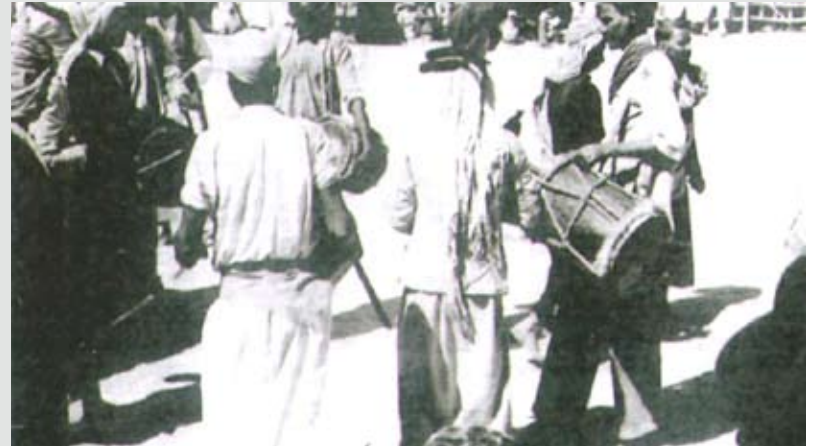
احتفالات العيد في ملعب النسور