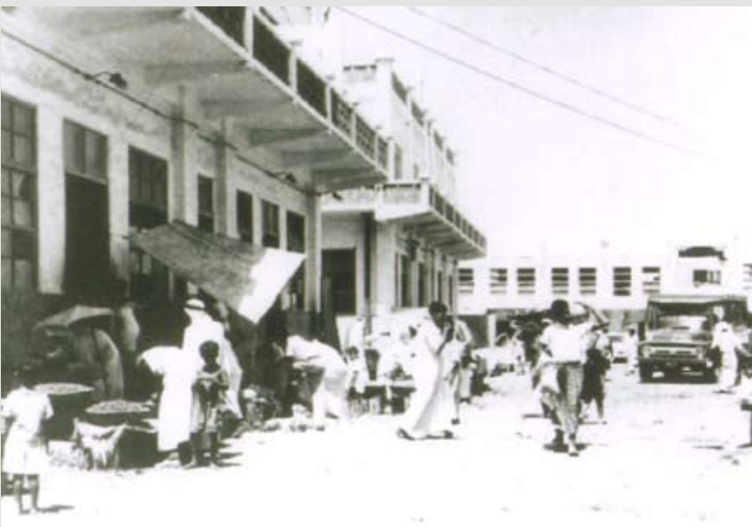
سوق الفاكهة والخضروات، قرب بلدية المنامة