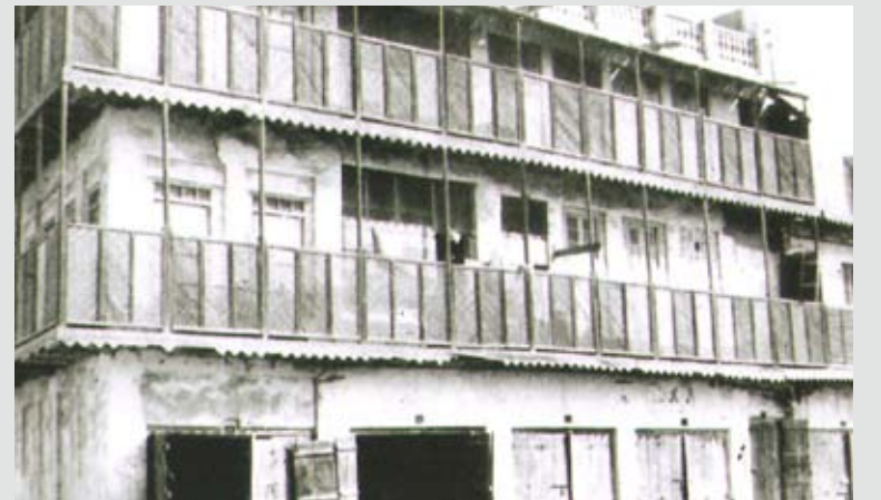
بيت أحمد يحيى البستكي