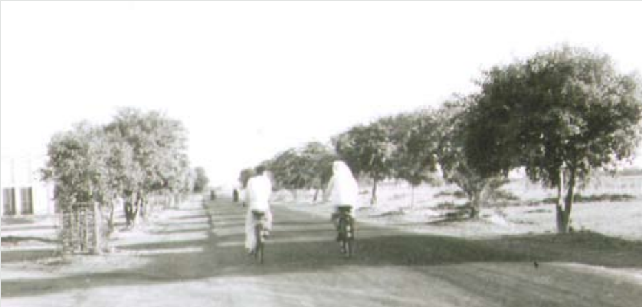
شارع الجفير من دوار حديقة الأندلس إلى محطة الكهرباء في أم الحصم