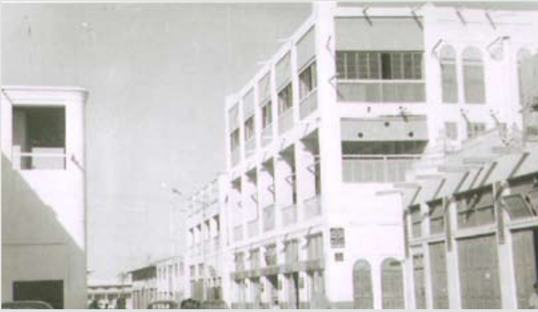
بناية كانو في شارع الخليفة