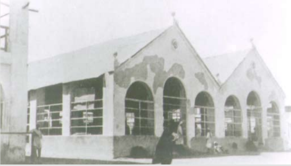
سوق اللحم في المنامة