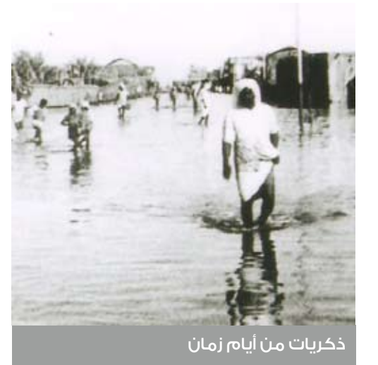
ذكريات من أيام زمان