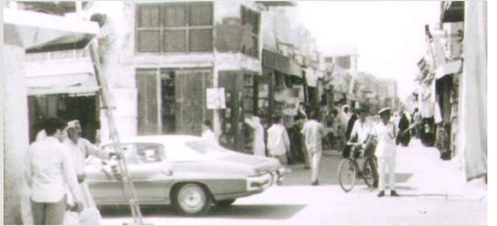
شارع الشيخ عبدالله