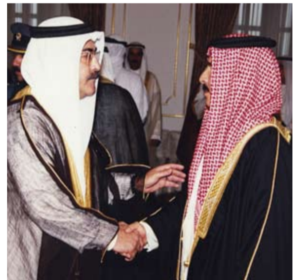
في إحدى المناسبات الرسمية مصافحا جلالة الملك المفدى، سبتمبر 1999م

□ تحدثتم عن الوالد، كيف استفدت من تعليمه لك؟ تعلمت من والدي - رحمه الله - الكثير، فقد تعلمت منه العصامية، والمثابرة، وحب الفضول، ومعرفة الناس، وإضافة لذلك فقد تعلمت منه البر بالوالدين، إذ كان باراً بدرجة كبيرة بوالديه رغم كونه أصغر إخوانه، أما فيما يتعلق بالعلاقات فإنني أنظر اليوم إلى ما كانت عليه علاقات والدي الممتدة والمتنوعة مع الغالبية من فئات المجتمع البحريني، وهو الأمر الذي انعكس ايجابا على عمله في التجارة، كذلك عمله في الجيش وفر له العمل مع خليط من الفئات البحرينية المتنوعة ومع الضباط الإنجليز والعراقيين، وكل ذلك أثر وبشكل كبير على مالي - شخصيا - من علاقات متشعبة مع الجميع، وهو الأمر الذي نتاجه وبشدة في مجتمعاتنا، نحتاج لأن تكون الصداقات ممتدة مع الجميع من أجل توفير بيئة صحية تبعثنا عن الإنغلاق وتدفعنا للإفتتاح على بعضنا البعض، ومما تجب الإشارة إليه أن الإفتتاح المذكور انعكس على مسألة