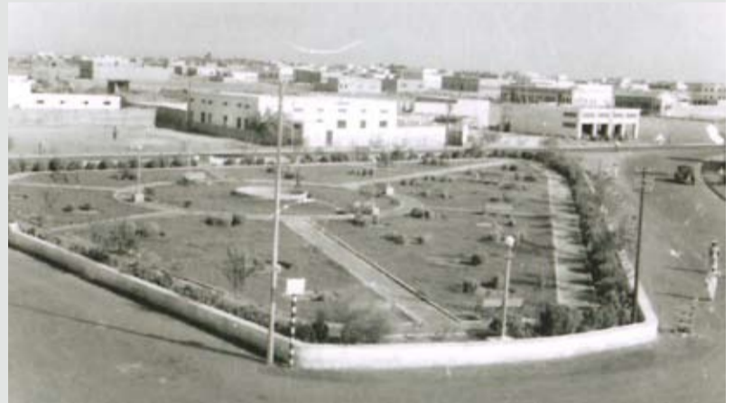
ميدان أوال ويرى سينما الزباني ونادي الفردوسي