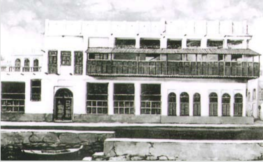
بيت الزامل في فريق الفاضل