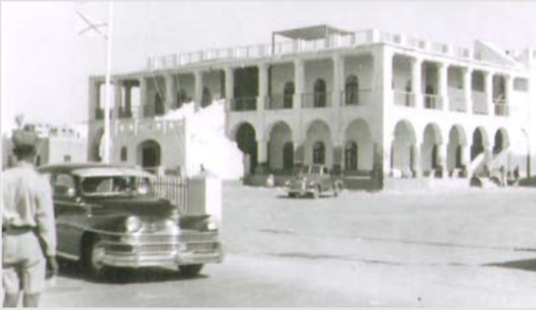
مبنى كري مكنزي أمام محطة يتيم، مجمع يتيم حالياً