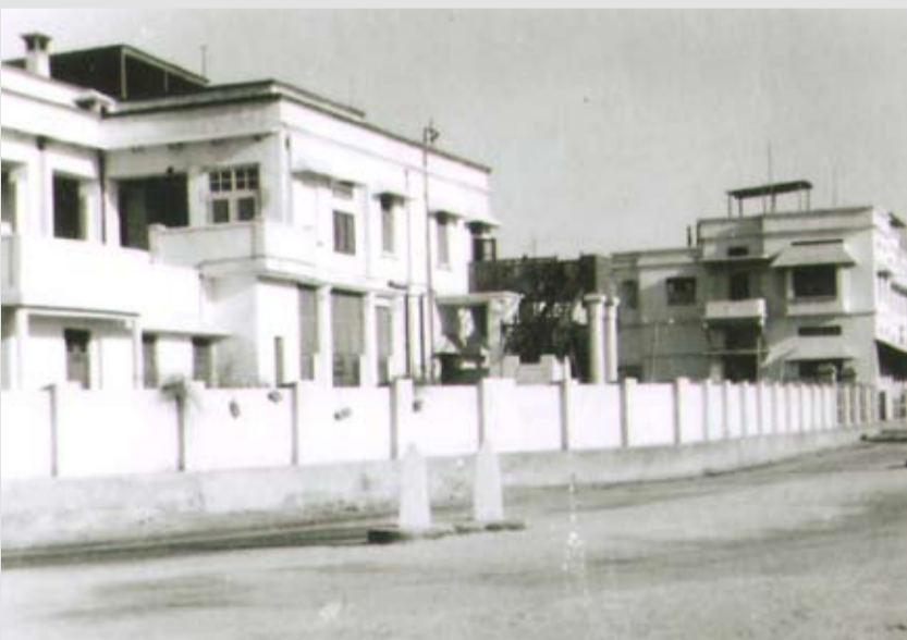
مستشفى النعيم وقد تم بناءه في عام ١٩٣٧