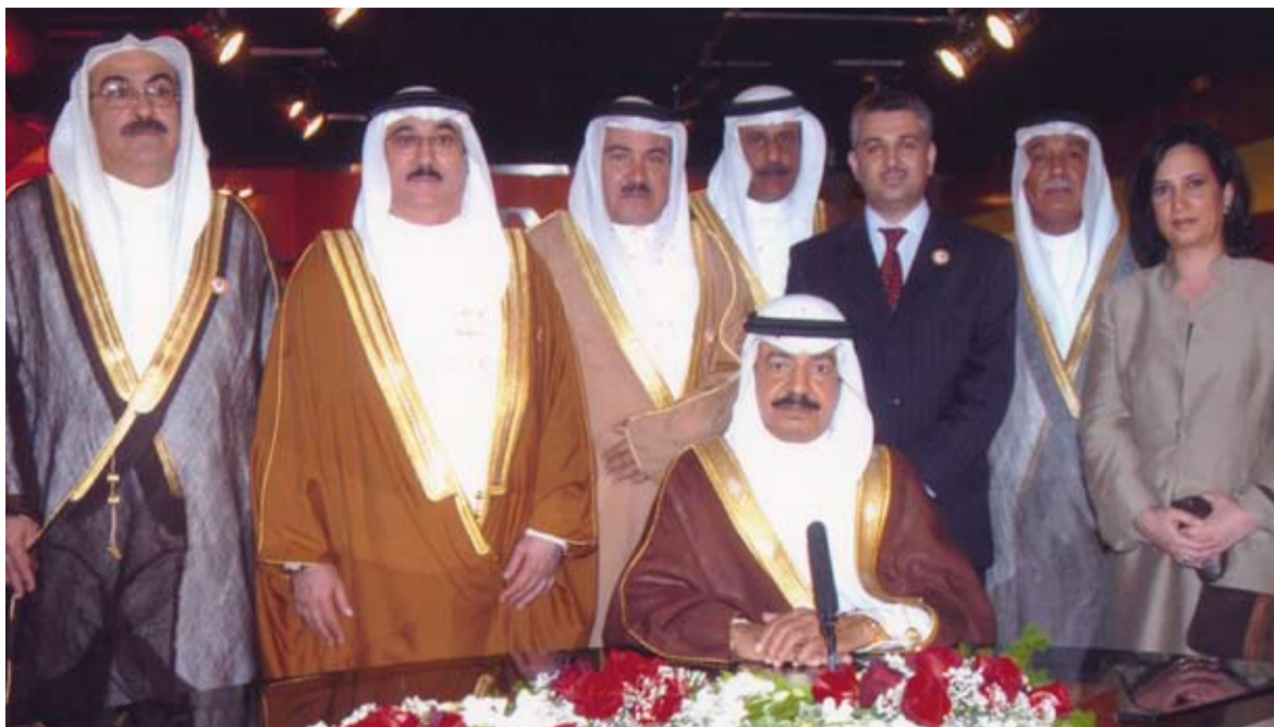
برفقة قيادات وزارة الاعلام وذلك عند تفضل سمو رئيس الوزراء بافتتاح مركز الاخبار بتلفزيون البحرين، 19 يوليو 2005م

المؤسسة الثقافية الرسمية والقطاعات الثقافية الأهلية بمختلف توجهاتها، وهذه المسألة أحدثت نقلة هامة في رسم السياسات والمشاريع الثقافية الوطنية تحديداً، فعلى سبيل المثال أنجزنا تطورا في سياسة العمل بمشروعات هامة ومن بين ذلك مايتعلقة بالمتحف الوطني وجعله بوتقة ثقافية ومركزا للنشاطات الثقافية واحتضان الأمسيات الموسيقية، ليؤدي كل ذلك إلى نقل المتحف من كونه متحفاً فقط إلى مكان وملقى يتردد عليه الناس طوال الوقت.