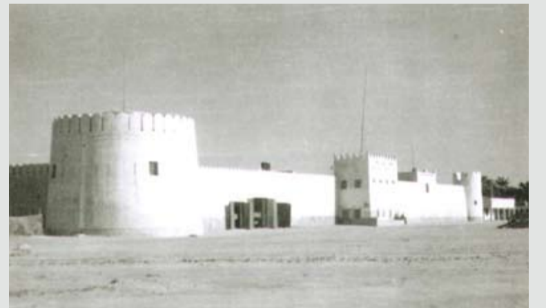
القلعة في السلمانية أمام مدرسة الصناعة