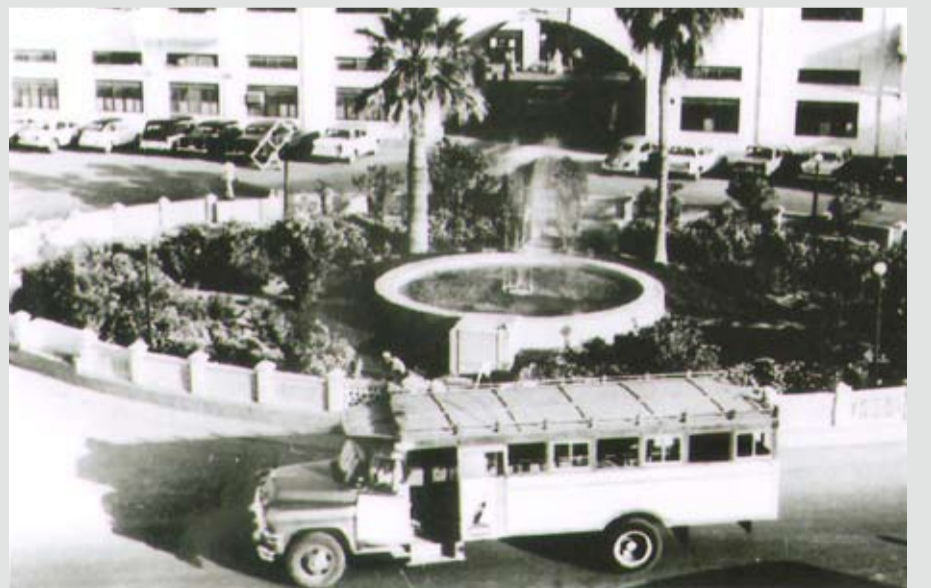
باص من خشب على دوار باب البحرين