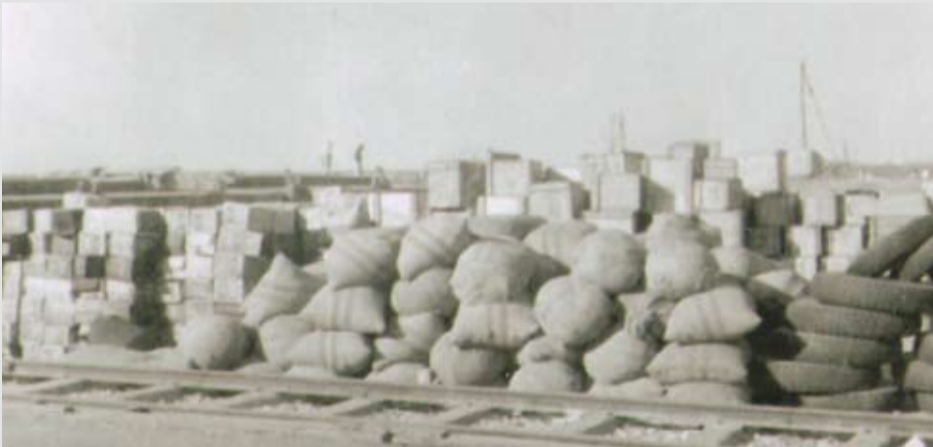
بضاعة على رصيف الفرصة لنقلها إلى المملكة العربية السعودية