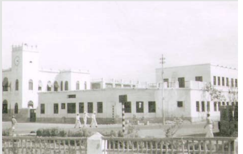
الكنسية الموجودة في المستشفى الأمريكي