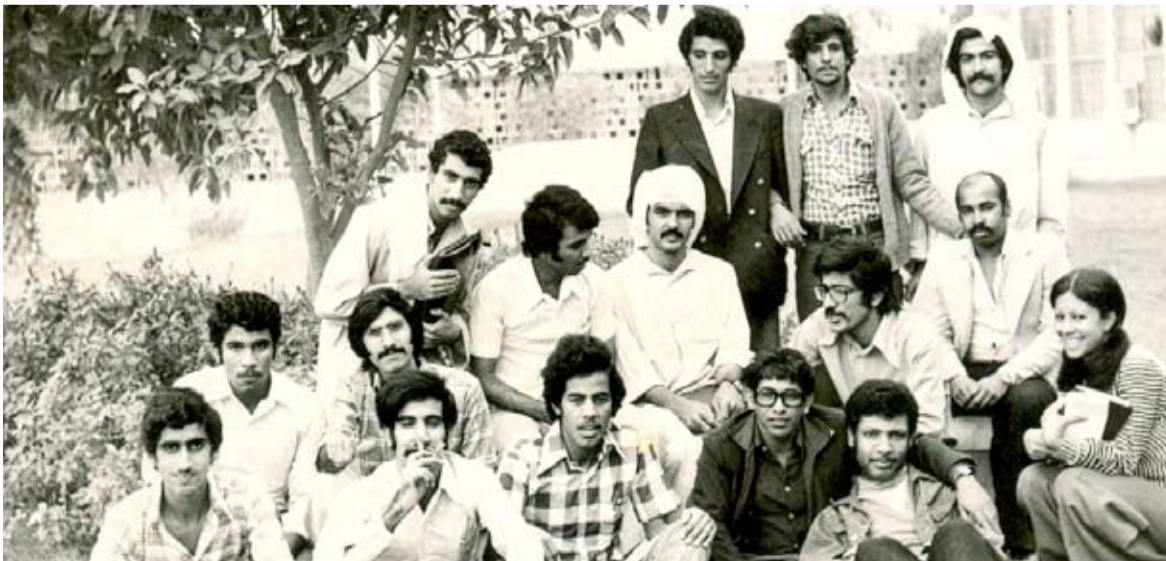
مع الاصدقاء والزلاء بجامعة الكويت، أوائل السبعينيات، أقصى اليمين، الصف الثالث وقوفا

أنا أكبر اخواني، ويمكن القول أنني مع أبناء جيلي كنا من بقايا نظام تعليم المطوع إضافة إلى التعليم النظامي، التحقت بالمدرسة الابتدائية المعروفة في البداية بمدرسة الشمالية وبعد ذلك بمدرسة عمر بن الخطاب، وكما إن دراستي النظامية كانت جنبا إلى جنب مع تعليم المطوع، فقد درست القرآن على يد