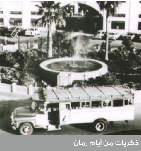
ذكريات من أيام زمان