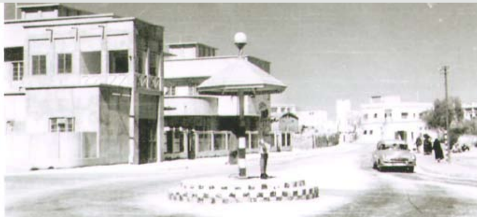
شارع نمرة (5) ويرى مستشفى الأمريكي وعيادة شركة نפט البحرين