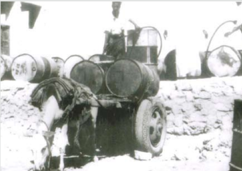
راعي الكاز يعبأ الكيروسين في منطقة النعيم