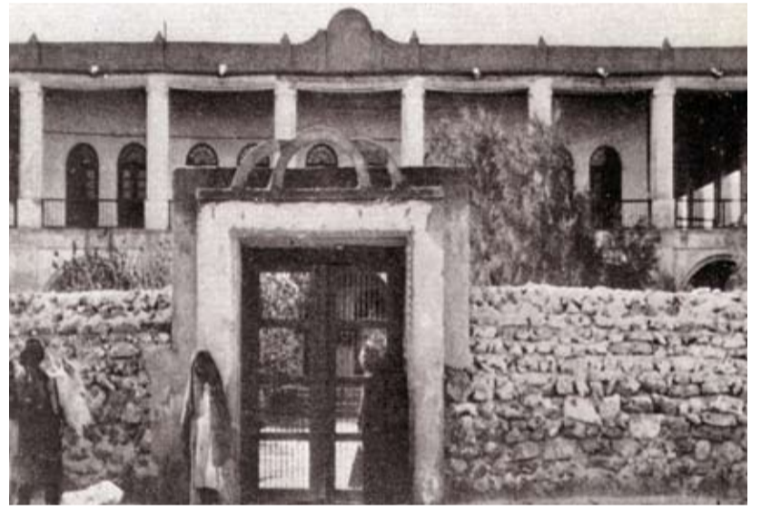
مستشفى الإرسالية الأمريكية