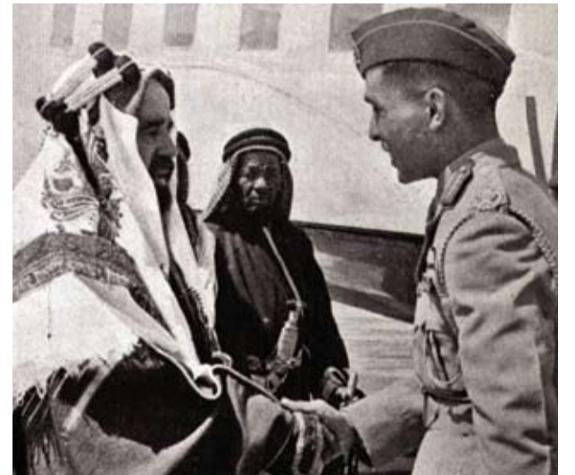
المغفور له الشيخ سلمان بن حمد آل خليفة مع المغفور له الملك حسين، ملك الأردن