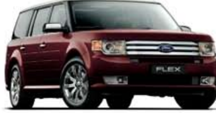
فليكس موديل ٢٠٠٩