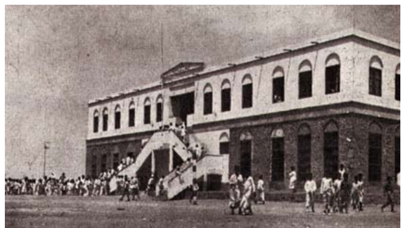
مدرسة الهداية الخليفية