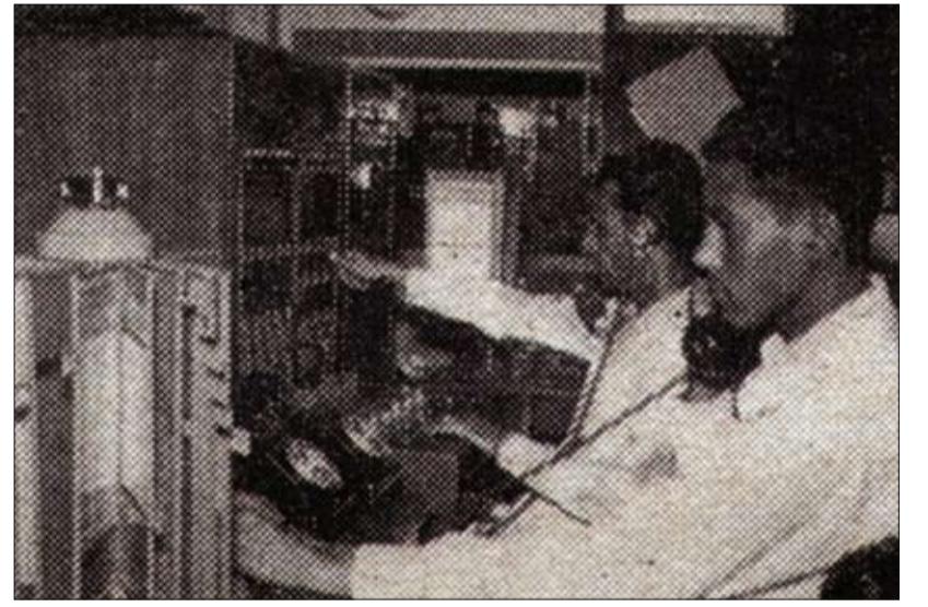
بدالة الهواتف في بابكو