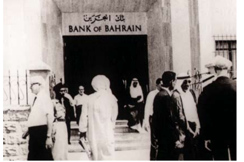
بنك البحرين الوطني