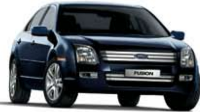
فيوجن موديل ٢٠٠٩