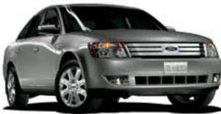
فايف هاندرد موديل ٢٠٠٩