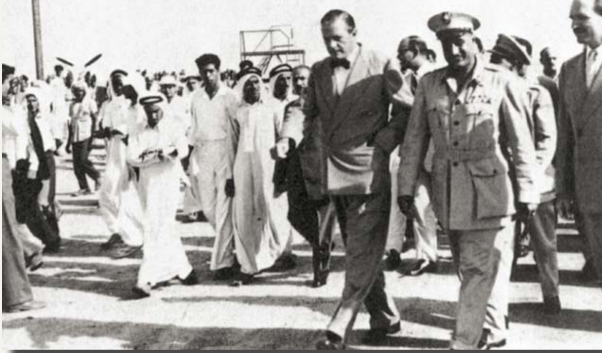
زيارة الرئيس المصري جمال عبدالنصر في الخمسينيات