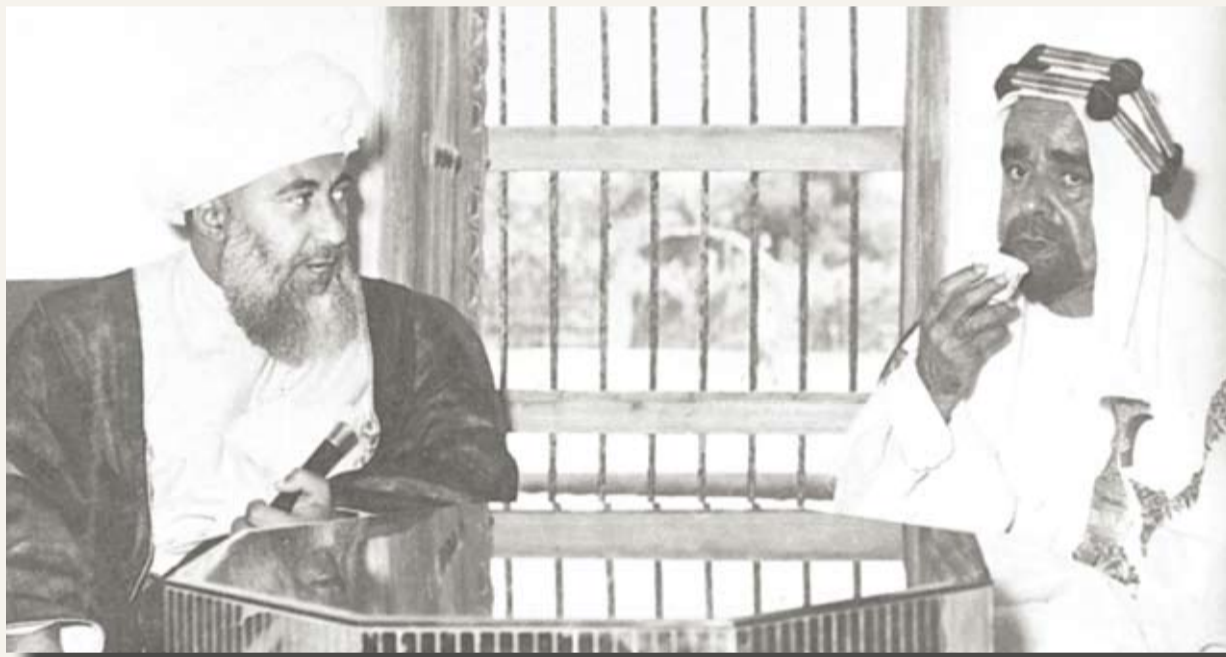
زيارة سلطان سعيد بن تيمور سلطنة عمان