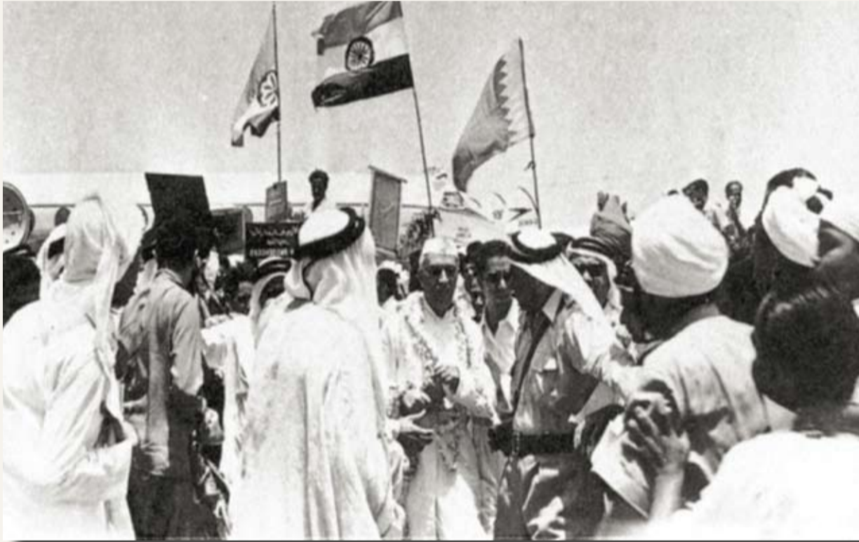
زيارة الزعيم الهندي جواهر نهرو