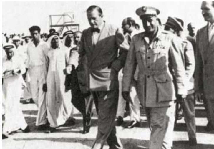
” رمضانيات“ تروي ذكريات من أيام زمان