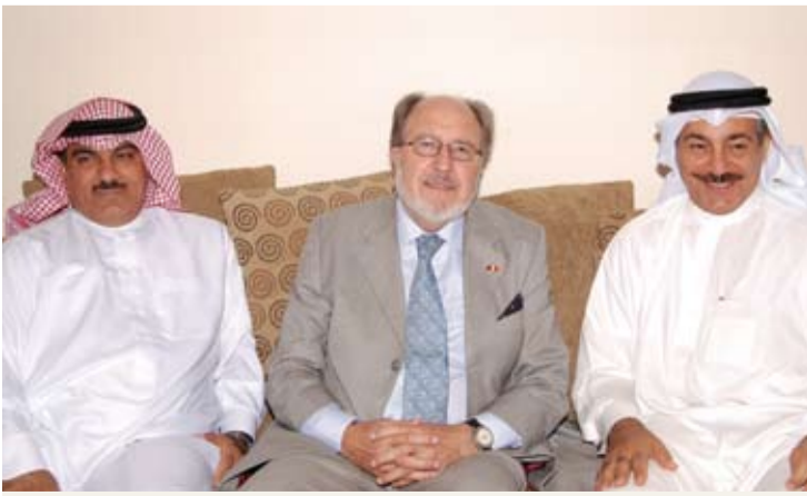
صور المجالس الرمضانية