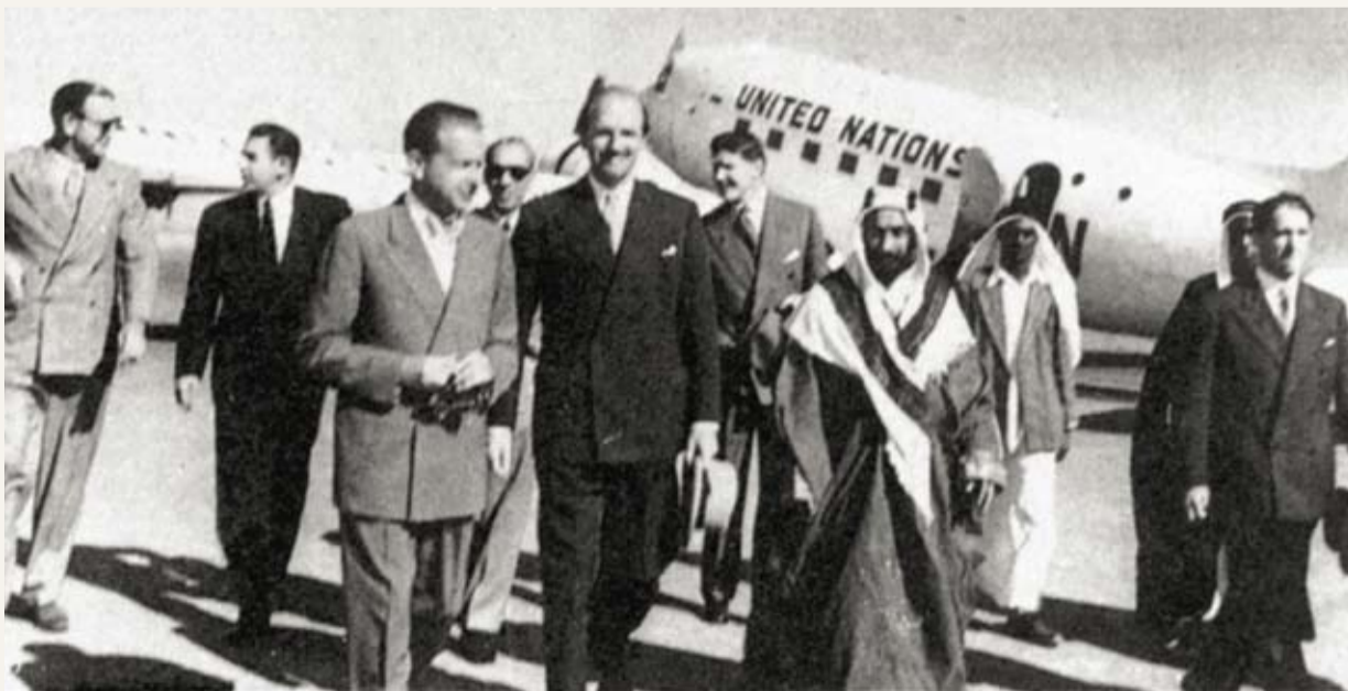
زيارة السكرتير العام للأمم المتحدة داك سكجوليد