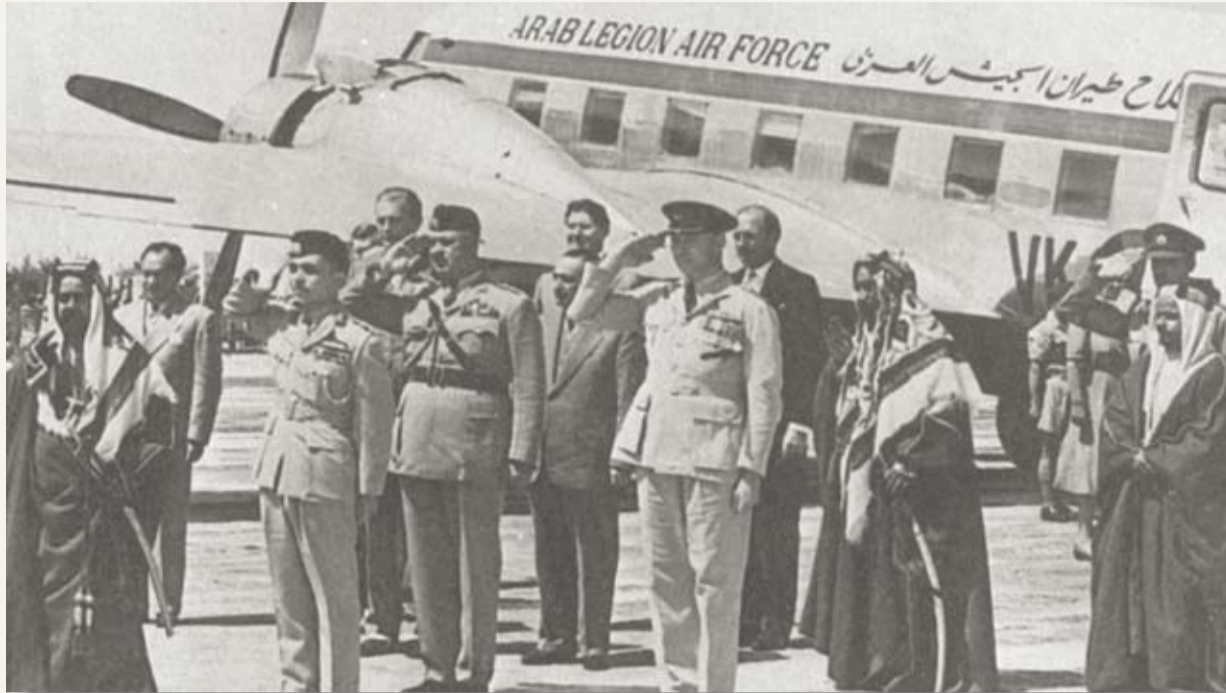
زيارة ملك المملكة الاردنية الهاشمية الحسين بن طلال