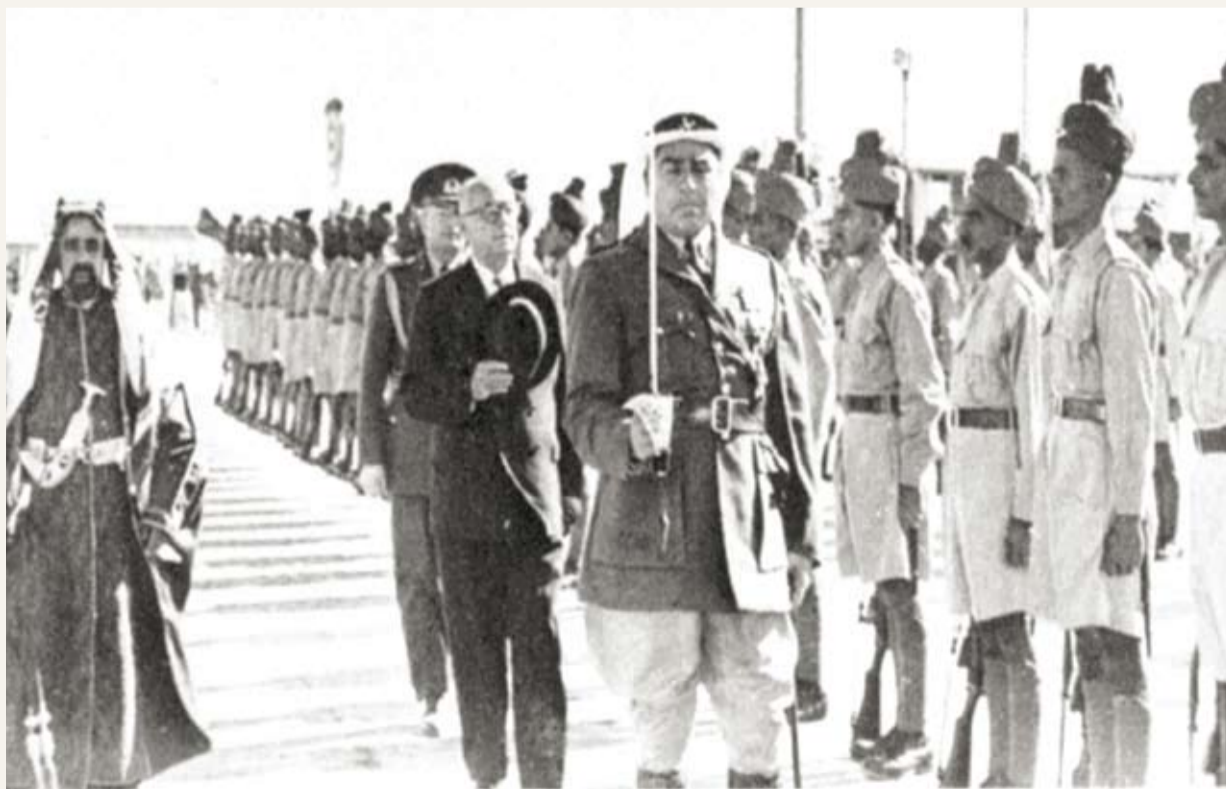
زيارة الرئيس التركي جلال بابار