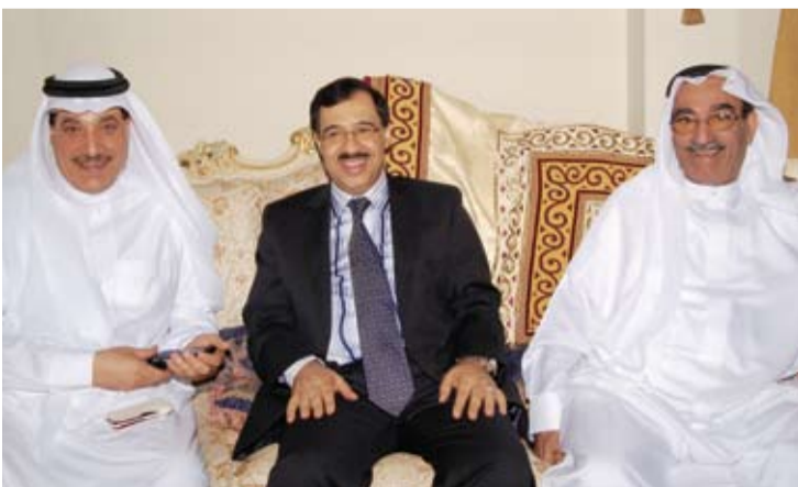
صور المجالس الرمضانية