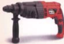
ROTARY HAMMER SDSMAX