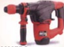
ROTARY HAMMERS SDSPLUS