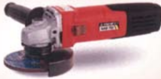
MINI ANGLE GRINDER