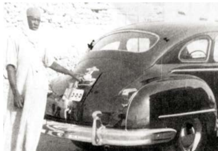
"رمضانيات" تروي ذكريات من أيام زمان