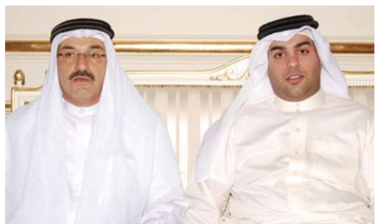
صور المجالس الرمضانية