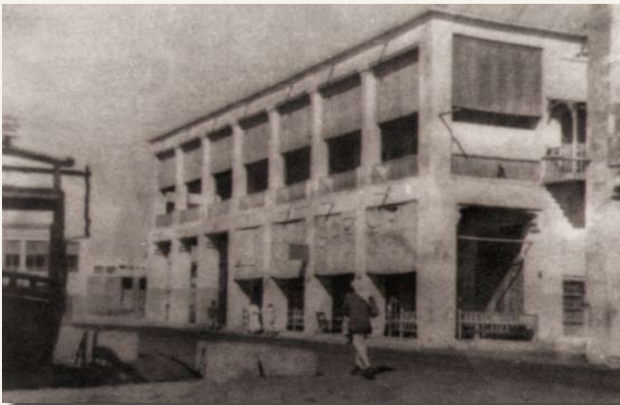
طريق بالمحرق يمر على محطة البترول القديمة