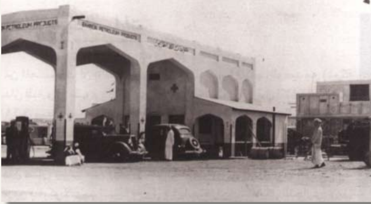
أول محطة بترول بالمنامة 1936