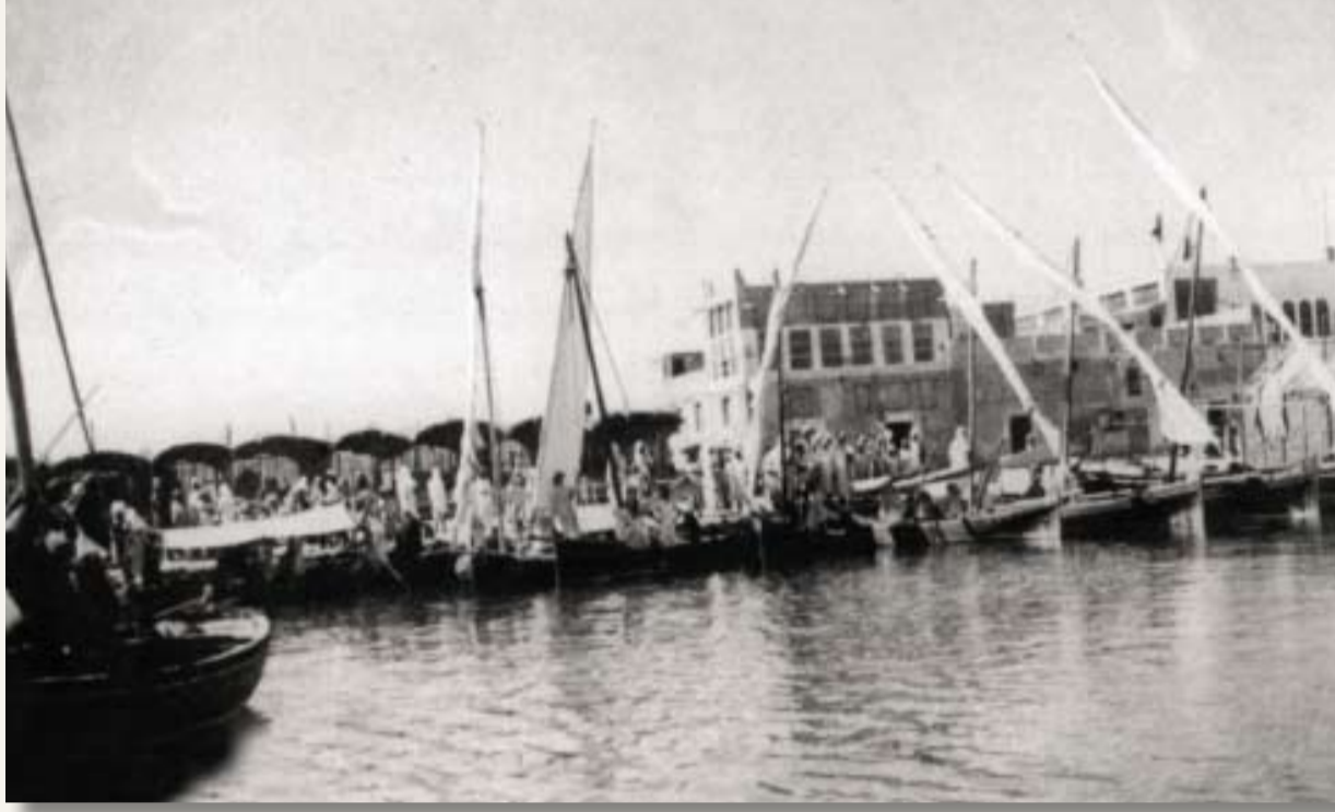
موقف المراكب الشراعية في المحرق