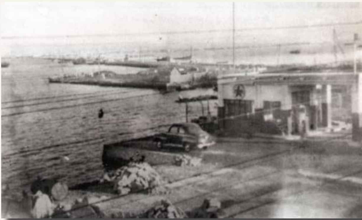
ثاني محطة بترول بالمحرق