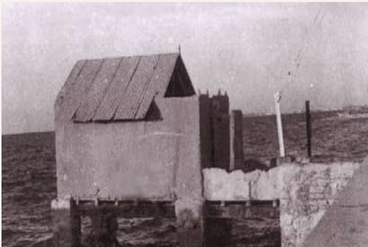
حمامات الفرضة «مقابل سينما القصيبي حاليا»