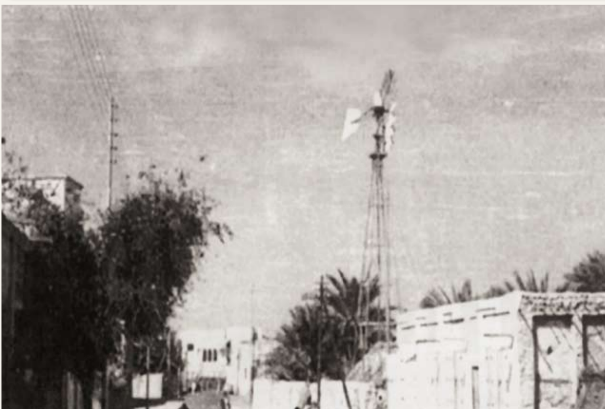
الطاحونة فريج العوضية «نخل المؤيد مقابل مصنع الثلج»