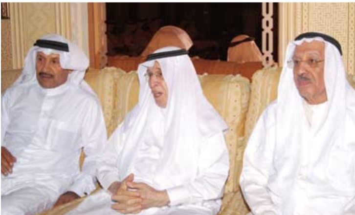
صور المجالس الرمضانية

الحجامة ممارسة طبية قديمة، عرفها العديد من المجتمعات البشرية، من مصر القديمة غرباً التي عرفتها منذ عام 2200 ق.م. مروراً بالآشوريين عام 3300 ق.م، إلى الصين شرقاً، وقد عرف العرب القدماء الحجامة، وجاء الإسلام فأقرها؛ وقد مارسها رسول الله (صلى الله عليه وسلم)، ففى الصحيحين أن النبي (صلى الله عليه وسلم) احتجم وأعطى الحجام أجره، كما أثنى الرسول (صلى الله عليه وسلم) على تلك الممارسة، فقال كما جاء في البخاري: ”خير ما تداويتم به الحجامة“، ورغم الخطوات العلمية الهائلة التي حققها الطب الحديث في مجال العلاج إلا أن الحجامة مازالت تمثل وسيلة علاجية ووقائية هامة ليس في مجتمعاتنا فحسب ولكن في جميع دول العالم، فيوجد الآن مراكز تقوم بتعليم الحجامة وممارستها مجاناً، كما بدأ بعض الأطباء يحيلون بعض مرضاهم لعلاجهم من بعض الأعراض، أما في الغرب والشرق فتُمارس الحجامة ويتم تعليمها وتصدر عنها الكتب وينشر عنها كجزء من حركة الطب البديل.. ”رمضانيات“ تفتح ملف الحجامة كأحد أهم العلاجات القديمة التي نجحت في علاج الكثير من الحالات التي فشل معها الطب الحديث.