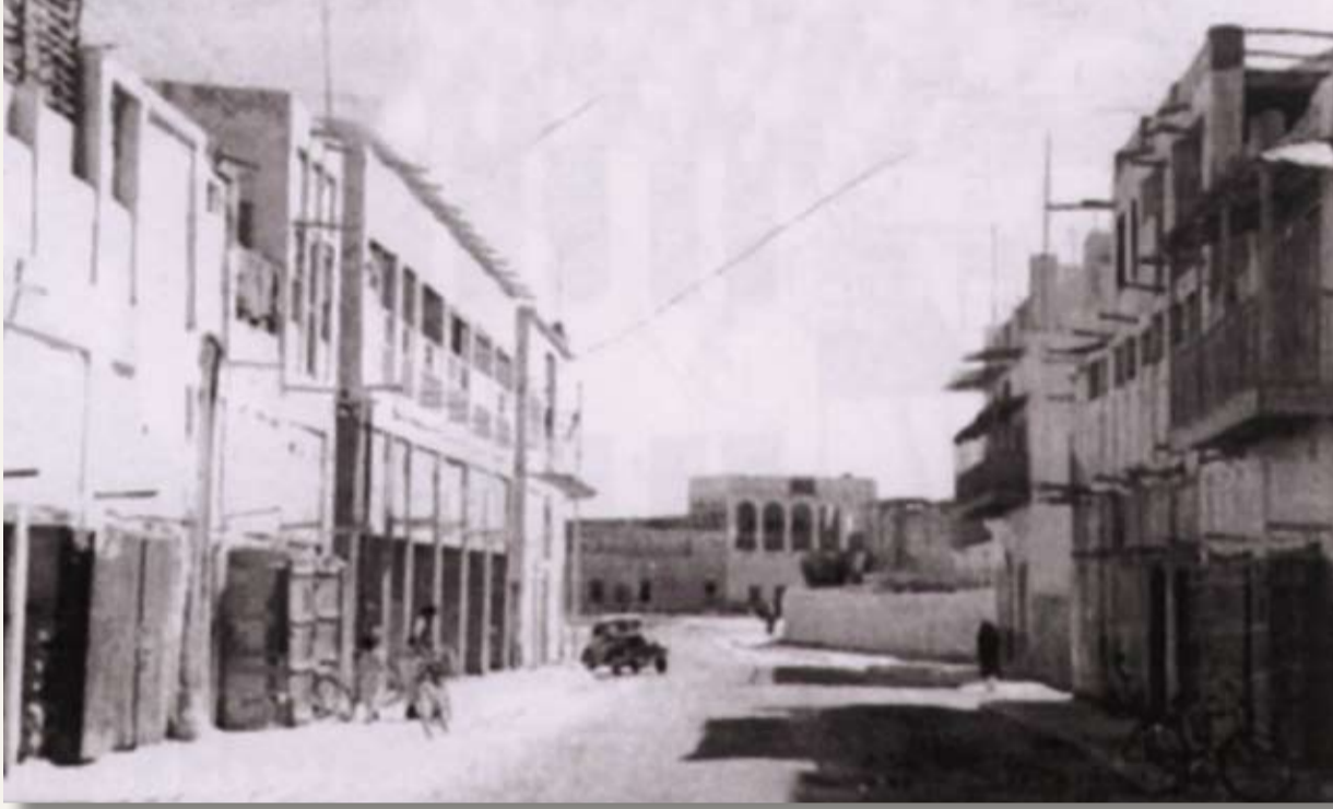
قهوة معري، دكان سيدفدادي، آيسكريم نصيف، منزل المؤيد، ومنزل العوضي