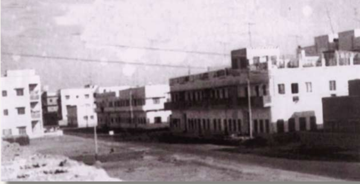
منطقة القضيبية، حلويات طارق وفتدق أطلس حالياً