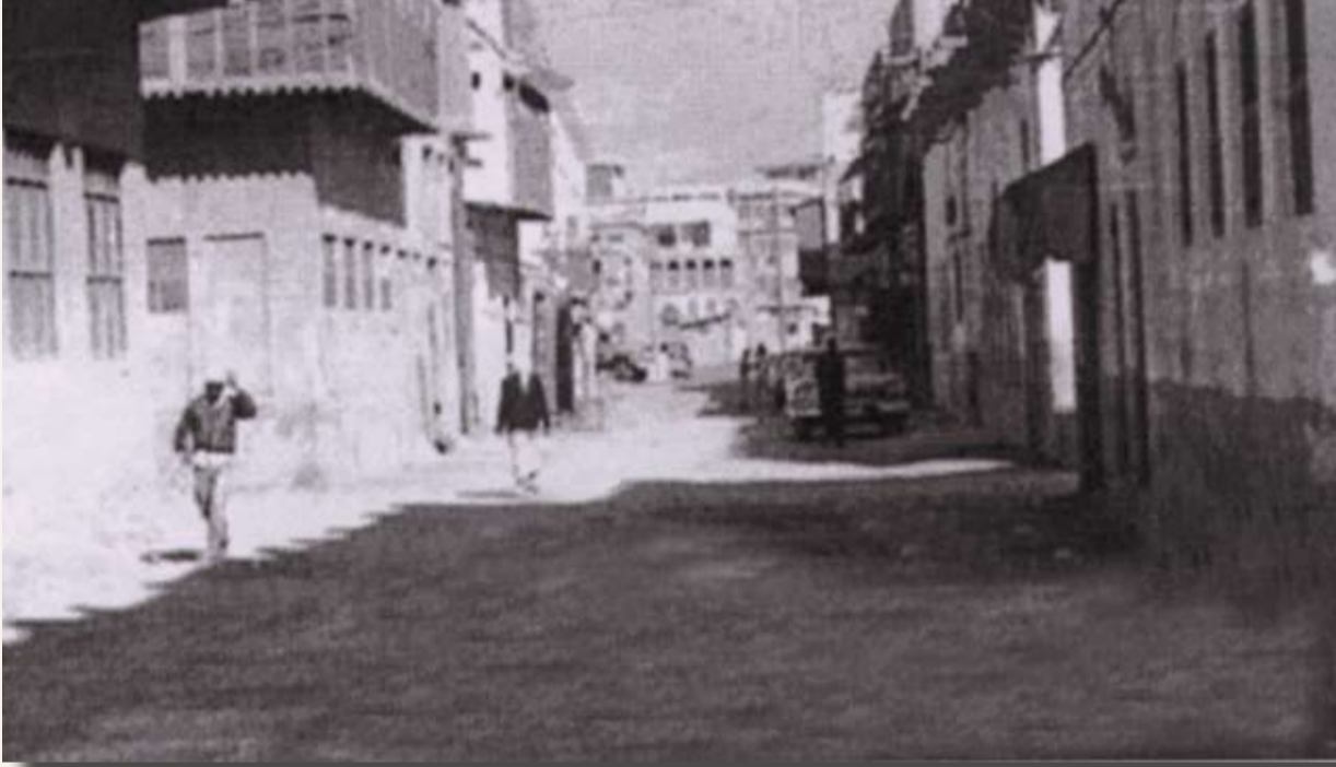
فريج الفاضل، منزل محمد علي جناحي، ومنزل القصيبي