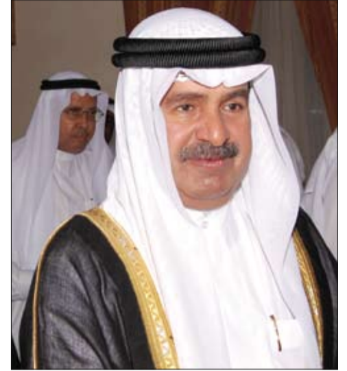
قام سمو الشيخ علي بن خليفة آل خليفة نائب رئيس مجلس الوزراء بزيارة مجلس محافظ محافظة المحرق سعادة سلمان بن عيسى بن هندي