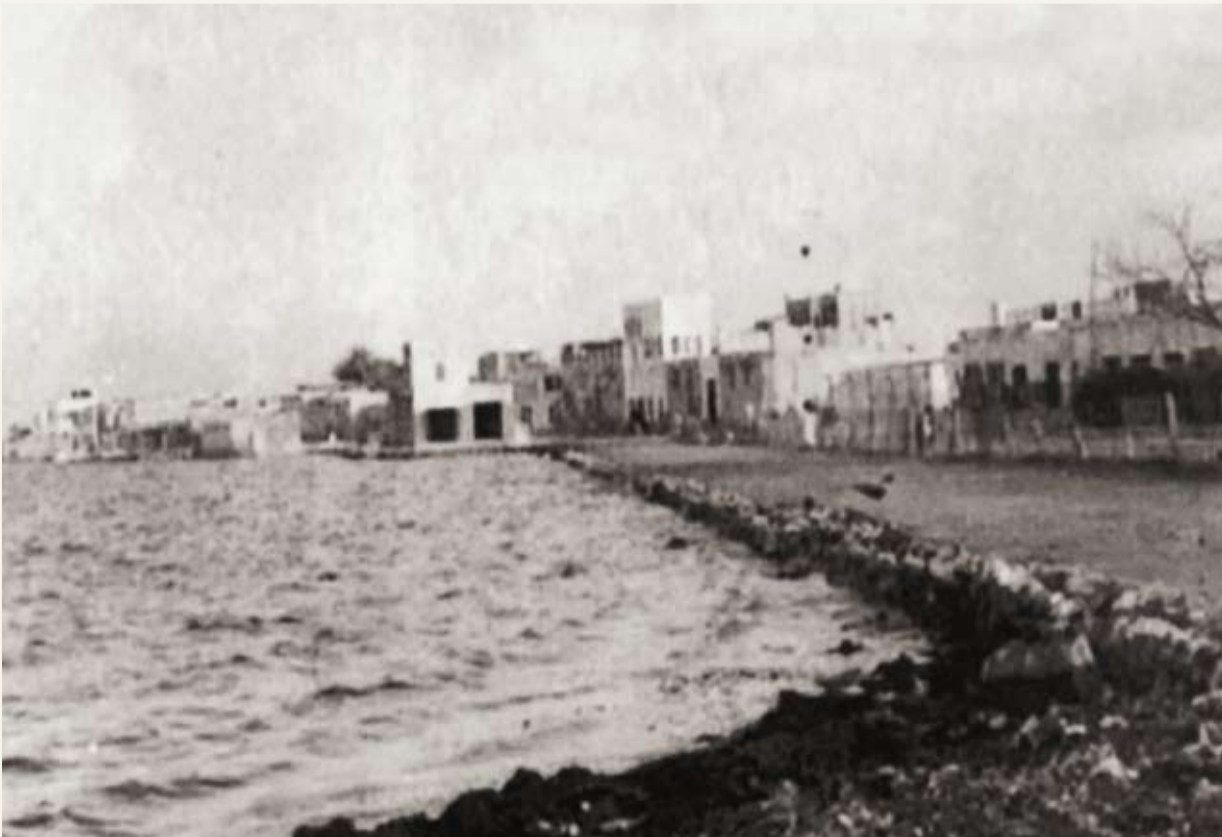
التلجراف، الاذاعة القديمة في الحورة