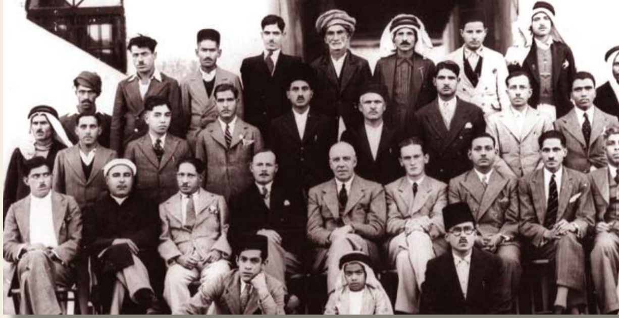
موظفو شركة كري مكنزي