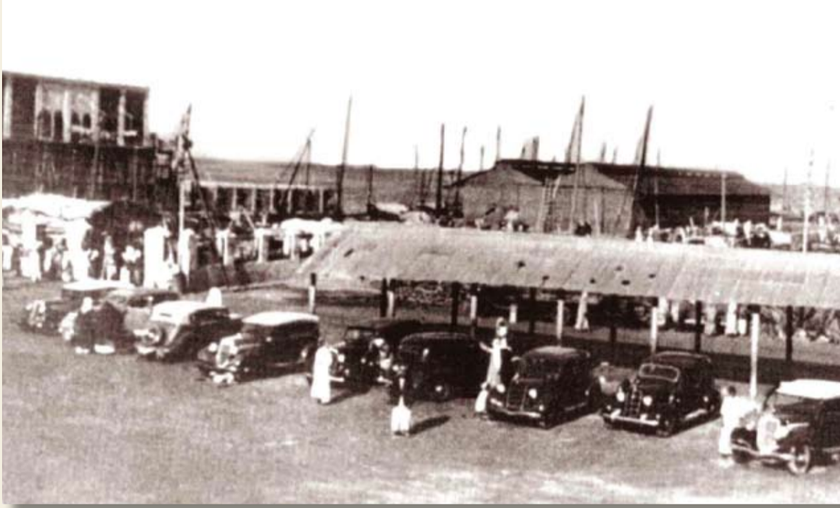
موقف سيارات الأجرة عند باب البحرين في أواخر الثلاثينيات