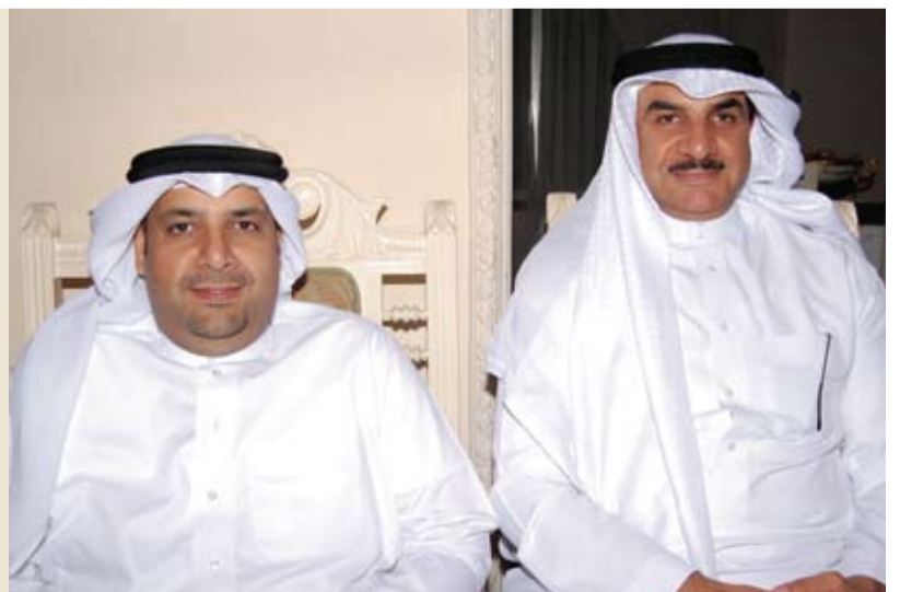
صور المجالس الرمضانية