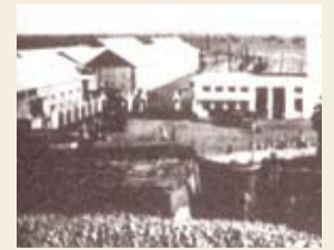
عين قصاري عام 1934